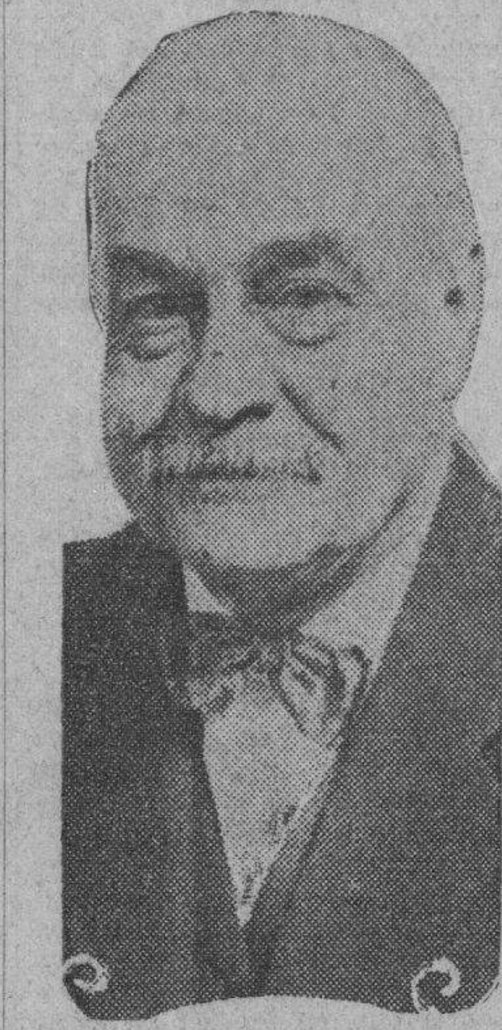
Dr. Nicholas Murray Butler

El Presidente de la Universidad de Columbia dice que no hay otro modo de proceder con respecto a la enmienda decimotercera de la Constitución, que prohíbe el tráfico de los licores