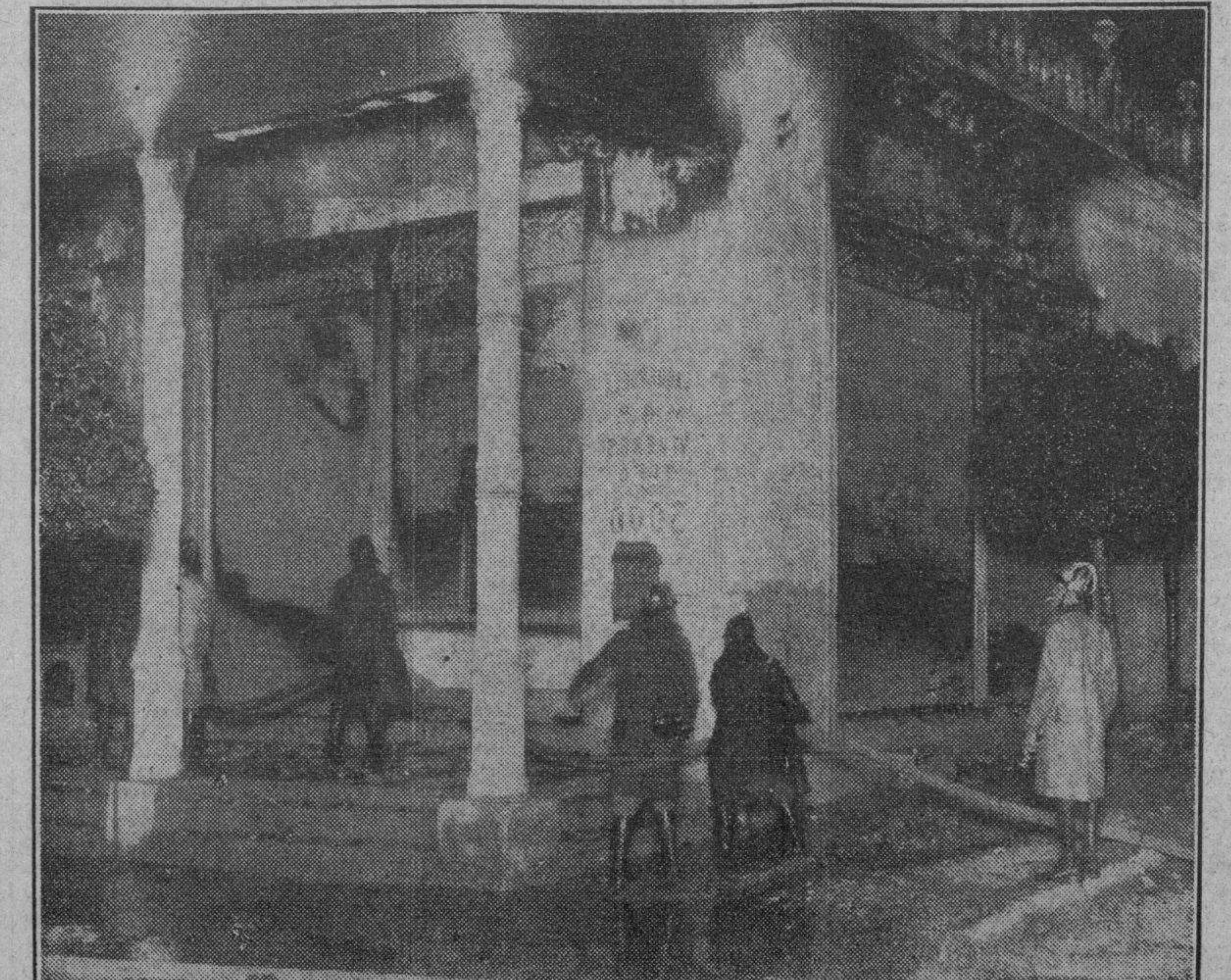
Fachada del establecimiento de viveres de Lagueruela y Cuarta, que anoche fué pasto de las llamas.