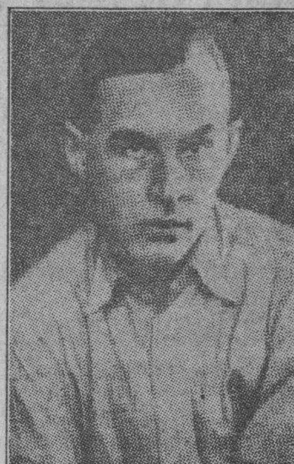
ERICH MARIA REMARQUE