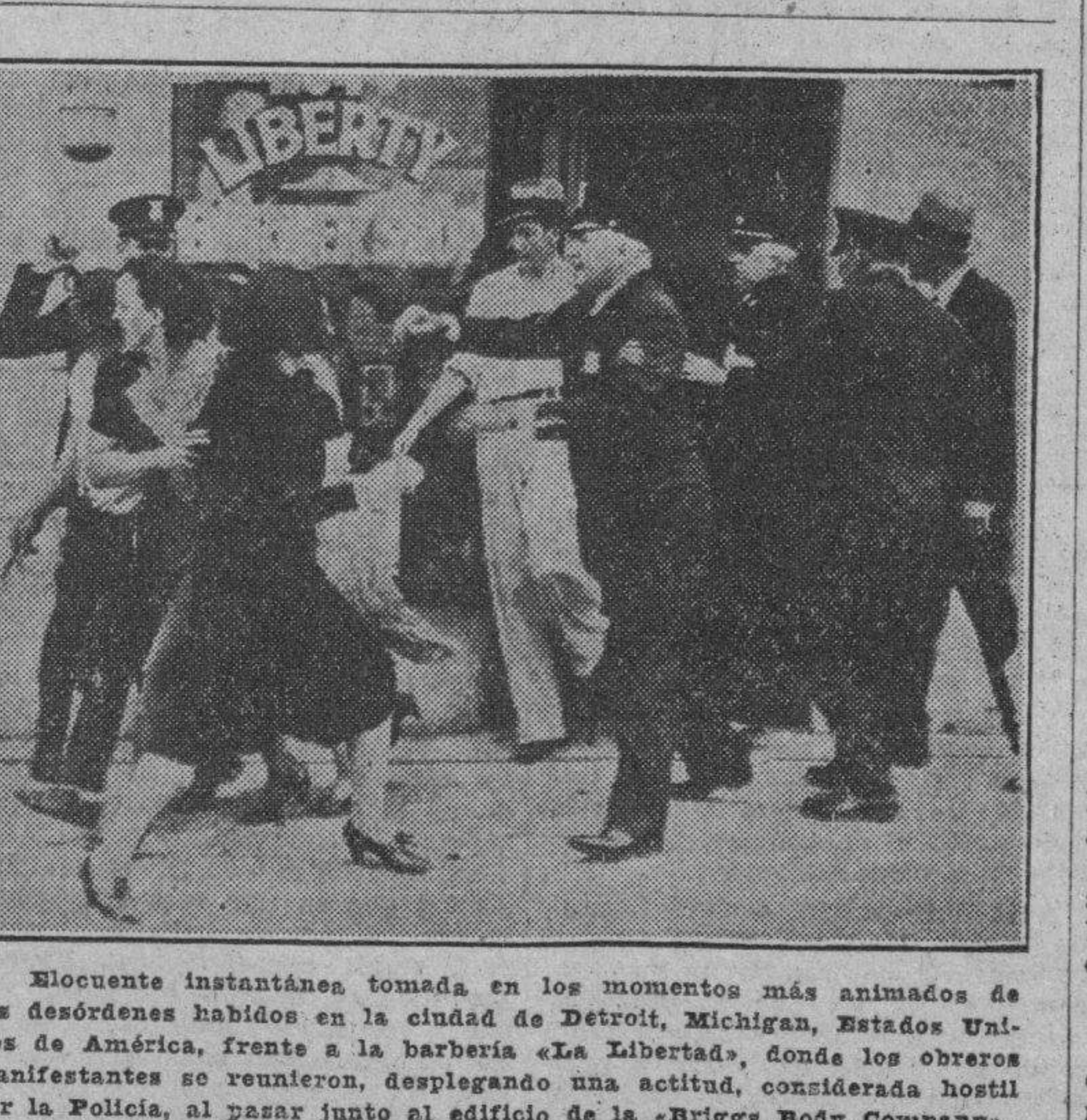
Momento instantáneo tomada en los momentos más animados de los desórdenes habidos en la ciudad de Detroit, Michigan, Estados Unidos de América, frente a la barbería «La Libertad», donde los obreros manifestantes se reunieron, desplegando una actitud, considerada hostil por la Policía, al pasar junto al edificio de la «Brigida Body Company». Comocenta policías no fueron suficientes para contener a los trabajadores, los cuales con la santa palabra «libertad» en sus labios resistieron a la fuerza pública. Y a la sombra de «La Libertad», que en este caso no fué un sagrado derecho sino un modesto establecimiento, lucharon los proletarios, muchos de los cuales perdieron aquella; nótese, si no, que no eran, por cierto, muy cariflanas compañías. Finclada ésta, como muchas, fiel de las ironías de la vida, en el constante hregar de la lucha por la existencia y de la más o menos recta interpretación del concepto de la santa libertad.

BARCOS QUE SE ESPERAN JUNIO 13 Quirigua, de New York y escales; President Jackson, de New York; Amapala y Permina, de New Orleans; La Perla, de Boston; Habana, de Veracruz; Cuba, de Tampa y Cayo Hueso. JUNIO 14 Orizaba, de New York; S. Teresa, de San Francisco; M. Castle, de Veracruz; Virginia, de New York; Florida, de Cayo Hueso. JUNIO 15 President McKinley, de San Francisco; Calamares, de Cristóbal. JUNIO 16 Karlruhe, de Bremen; Kreta, de Veracruz; Florida, de Cayo Hueso. JUNIO 17 Pennsylvania, de San Francisco; Cartago, de New Orleans; Heredia, de Puerto Barrio; Cuba, de Cayo Hueso. JUNIO 18 Oriente, de New York; Florida, de Cayo Hueso.