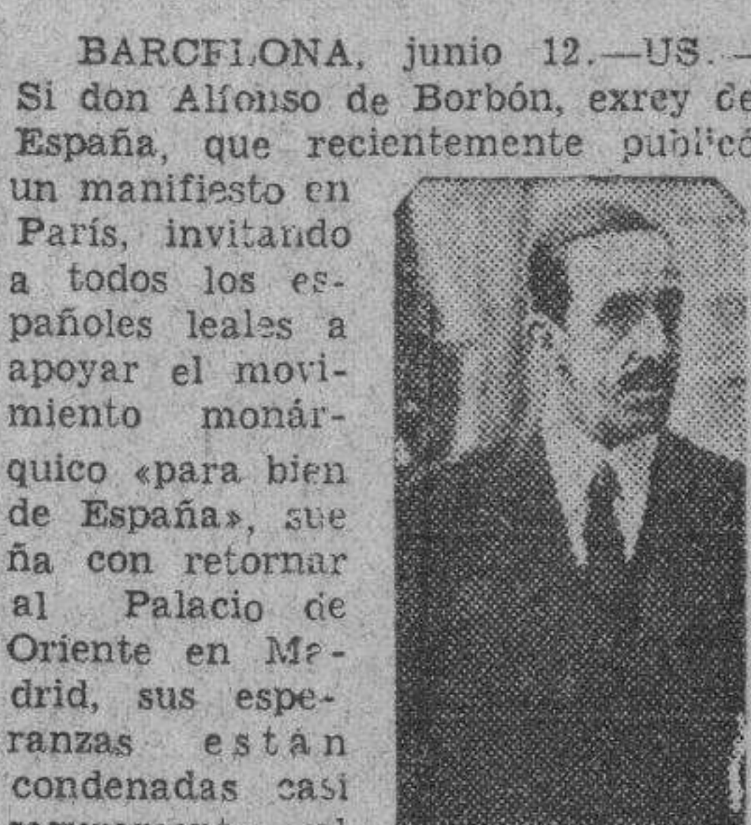
Don Alfonso de Borbón

Tal convicción hay en el pueblo español sobre su mal gobierno, que no le permitirán regresar