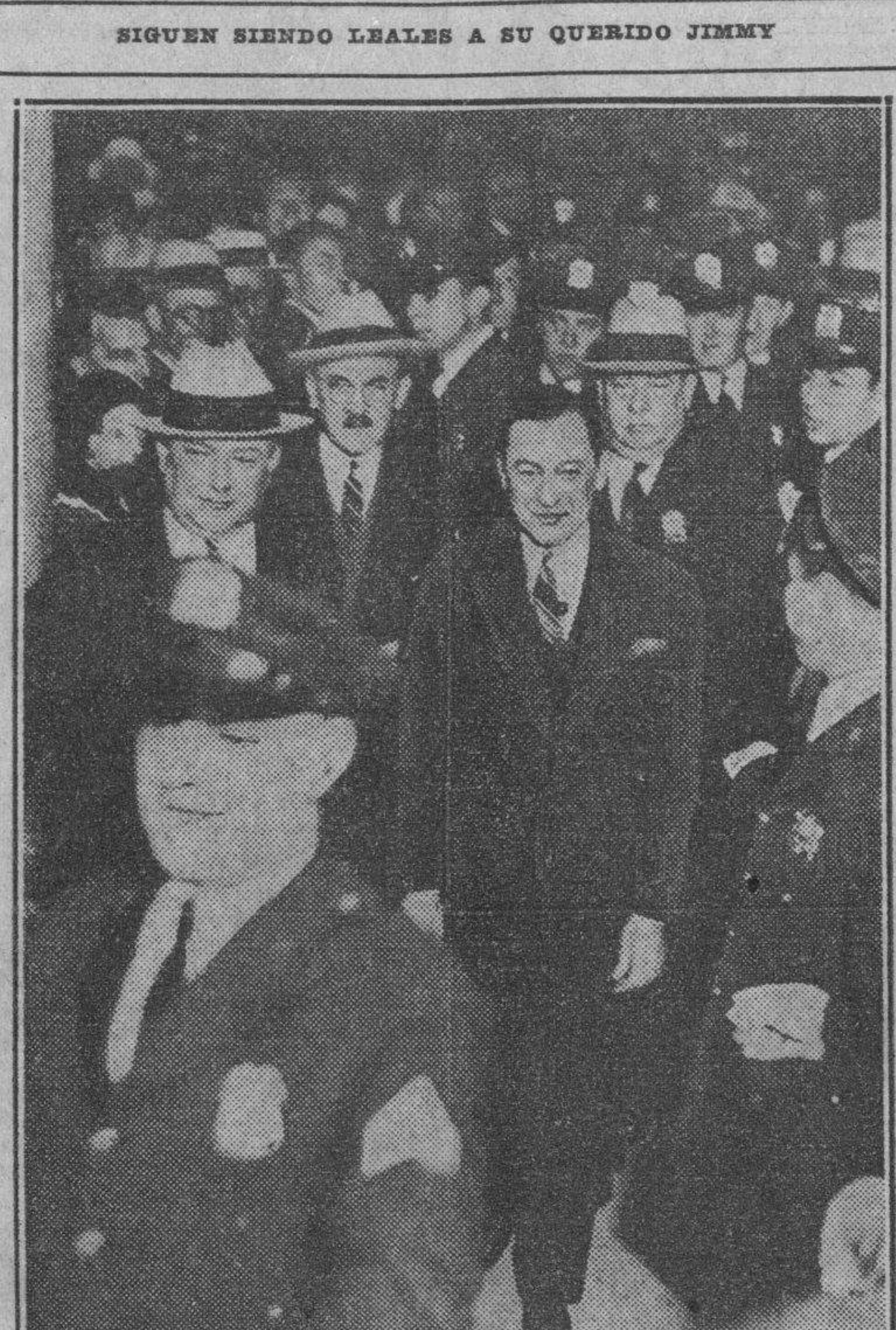
Señores de la Cámara de Representantes, ayer en la sesión.

Los representantes han sido citados para discutir esta tarde el Dictamen sobre la Ley de los Concejales.