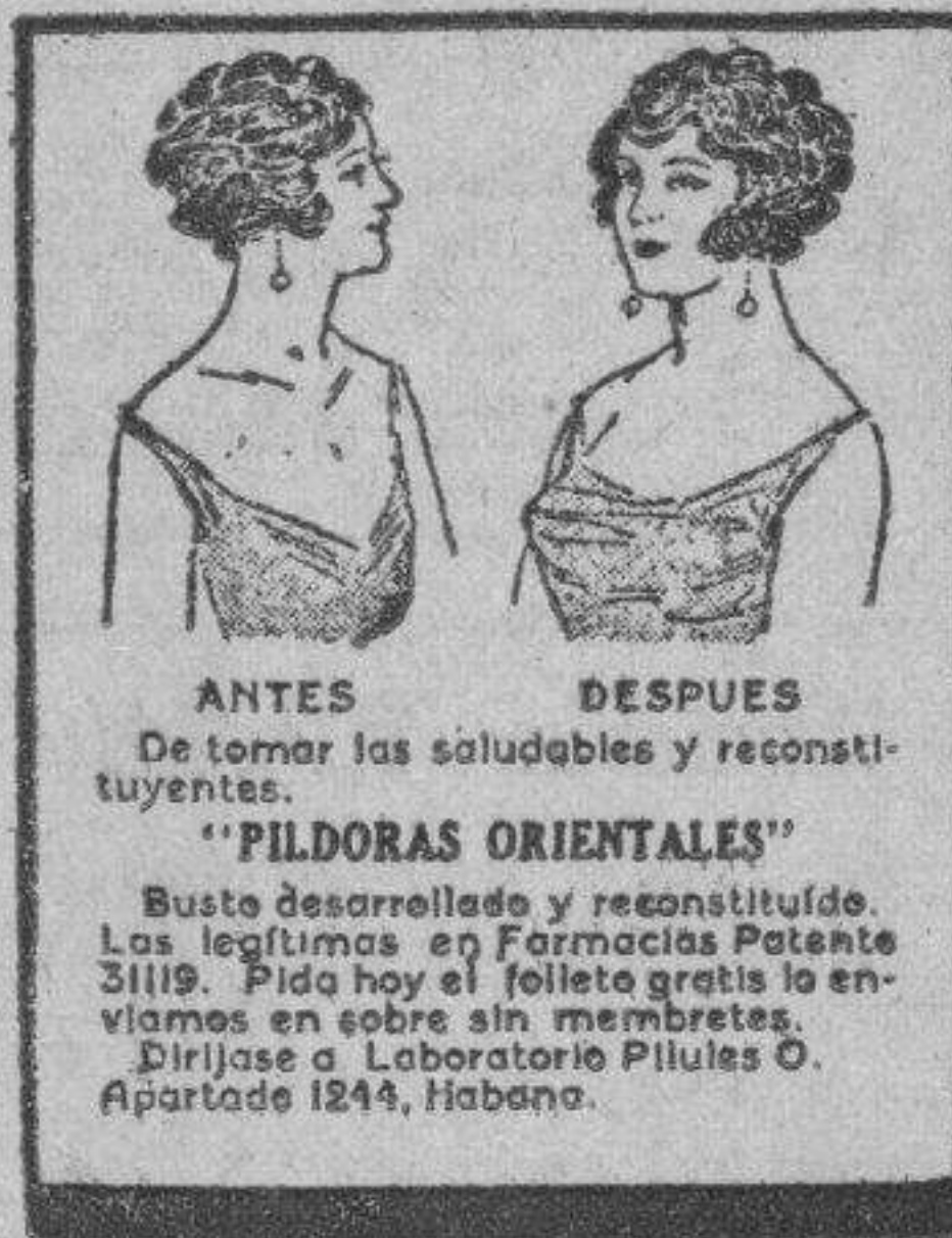
ANTES DESPUES De tomar las solubles y reconstituyentes. "FILDORAS ORIENTALES" Busto desorellado y reconstituido. Los legítimos en Farmacia Potente. ¿Puede hoy el boleto gratis le enviarnos sobre sin miembros. Divulgue el laboratorio Pilules O. Apartado 1244, Habana.

Ya he censurado lo que me parece útil o nocivo en la nueva Ley. Y porque no sé digno de mí que sólo tengo ideas destructivas, que sólo veo lo que se puede derribar, voy a exponer en esta segunda parte de la carta un modesto punto de vista constructivo que, quizás, a muchos parecerá fantástico e irrealizable. Pero no será, sin antes pedirle muy de veras me perdona por el abuso de confianza que supone distraer por tanto tiempo su atención.