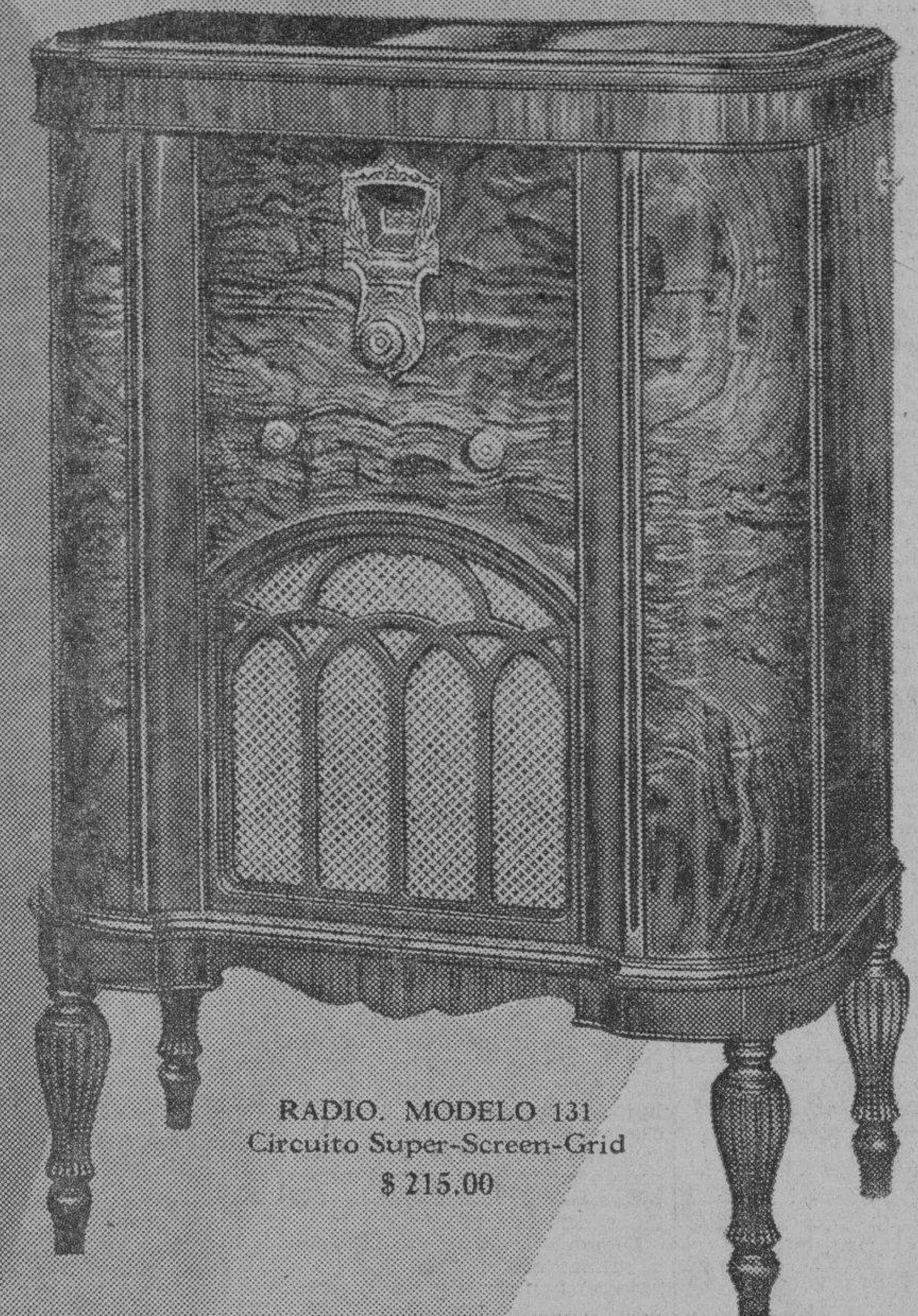
RADIO, MODELO 131. Circuito Super-Screen-Grid $ 215.00

“El Radio Más Extraordinario Jamás Construído”