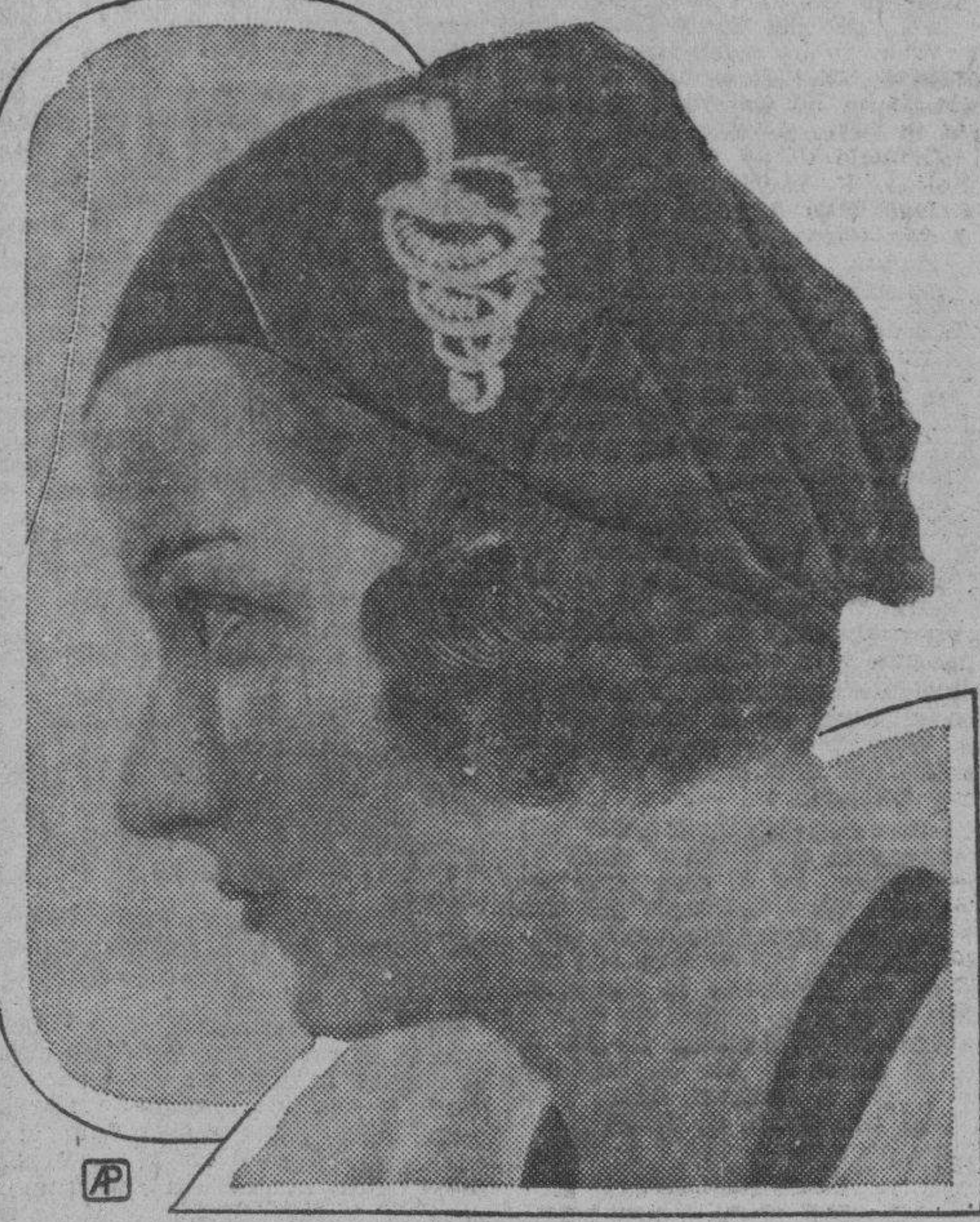
La última novedad en sombreros—producto de Patou—lleva un broche de piedras preciosas al lado.

Secretos de una Parisiense —: Conócete a ti misma