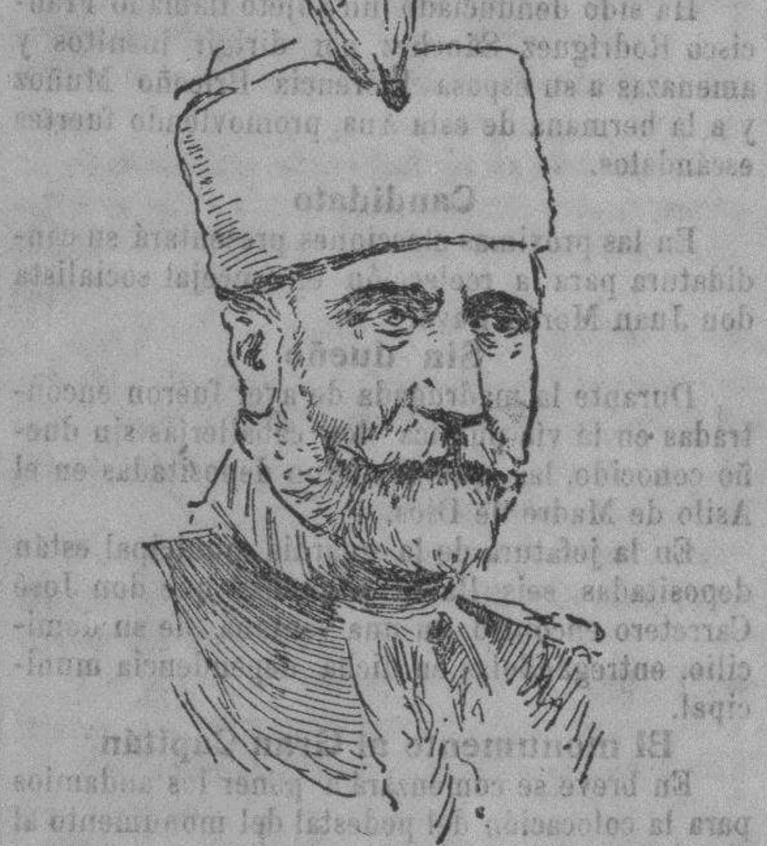
El vaivoda. Putnik, que ha presentado la dimisión del cargo de comandante en jefe del ejército serbio.