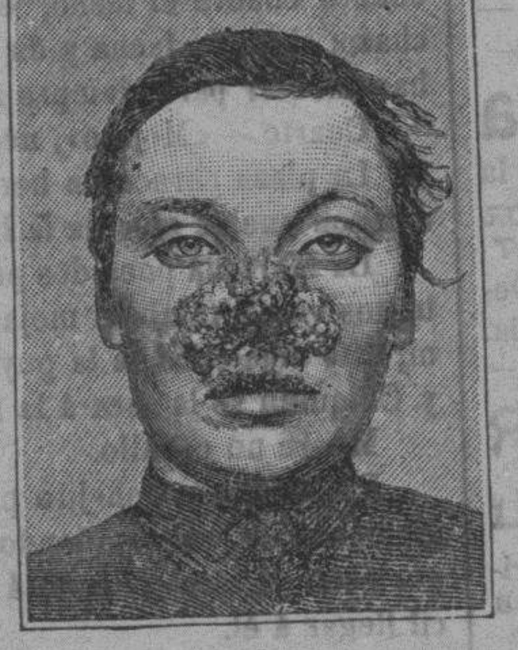
Antes de la curación.