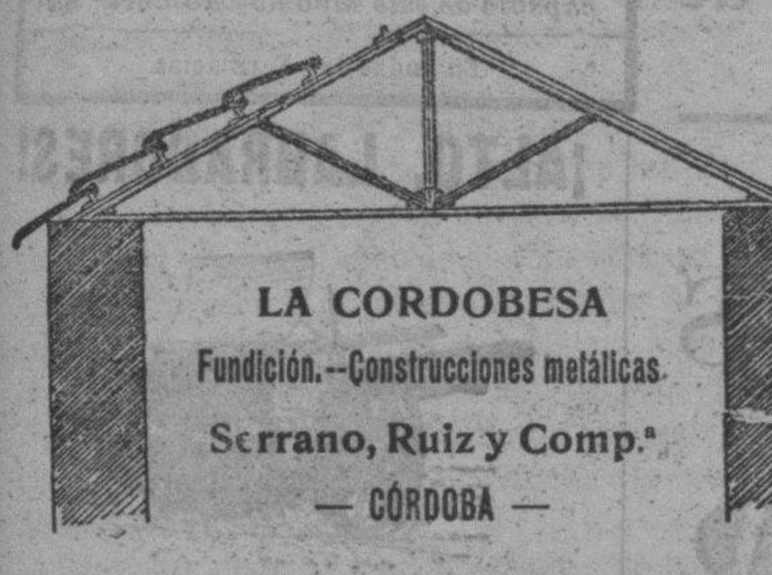
LA CORDOBESA Fundación.-Construcciones metálicas. Serrano, Ruiz y Comp. - CORDOBA -

ARMADURAS METÁLICAS PARA CUBRIR CON TEJA PLANA, LADRILLO POR TABLA Y TEJA DE RUEDA. Ligeras, resistentes, incombustibles, eternas y económicas.