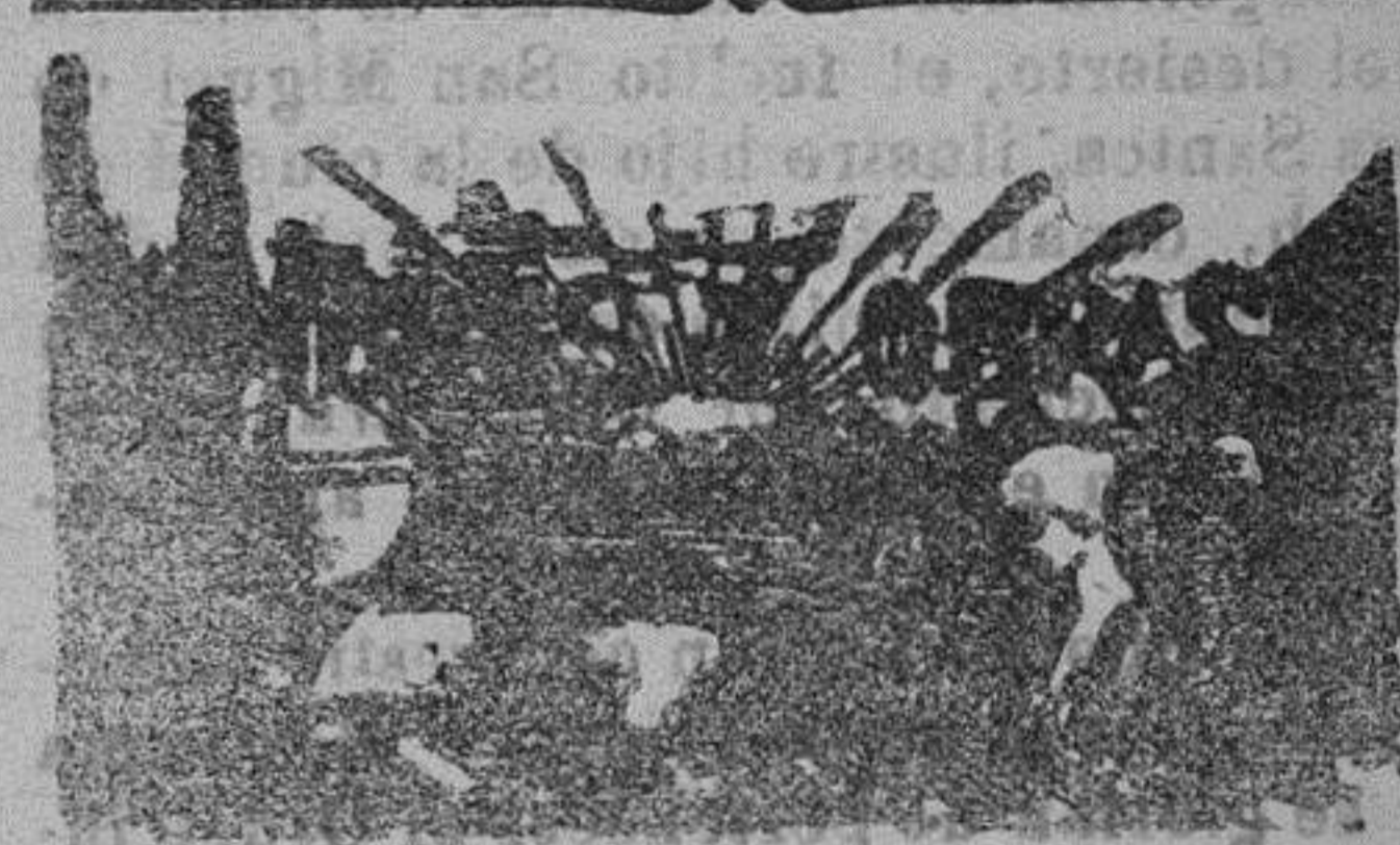
FEDERICO I, BARBARROJA