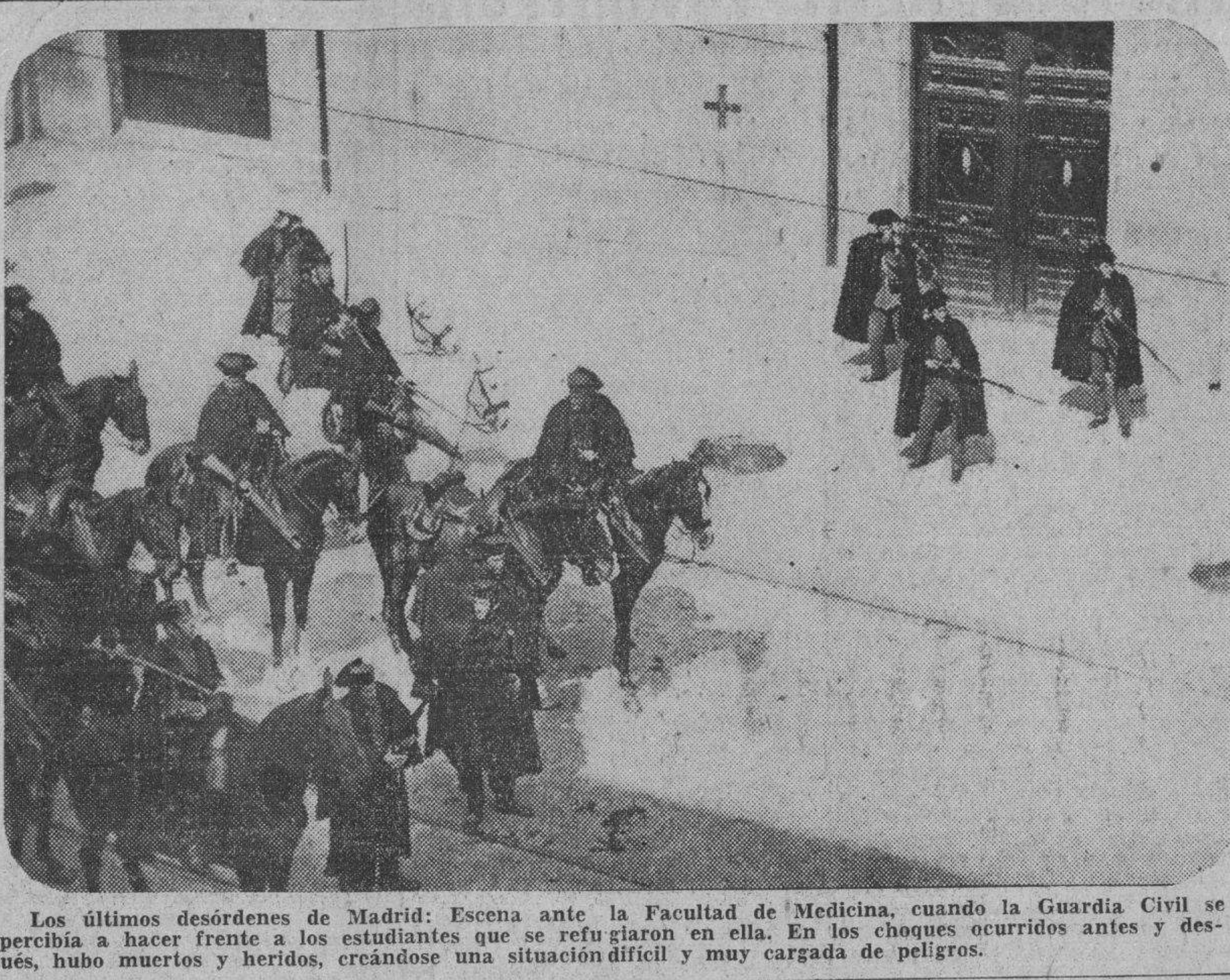
Los últimos desórdenes de Madrid: Escena ante la Facultad de Medicina, cuando la Guardia Civil se acercaba a hacer frente a los estudiantes que se refugiaron en ella. En los choques ocurridos antes y después, hubo muertos y heridos, creándose una situación difícil y muy cargada de peligros.