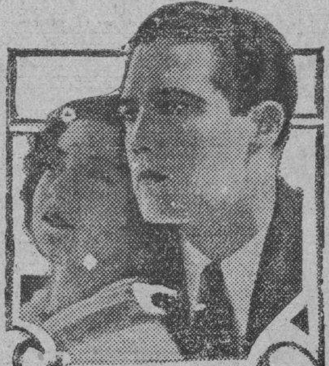
Una Merkel and John Holland