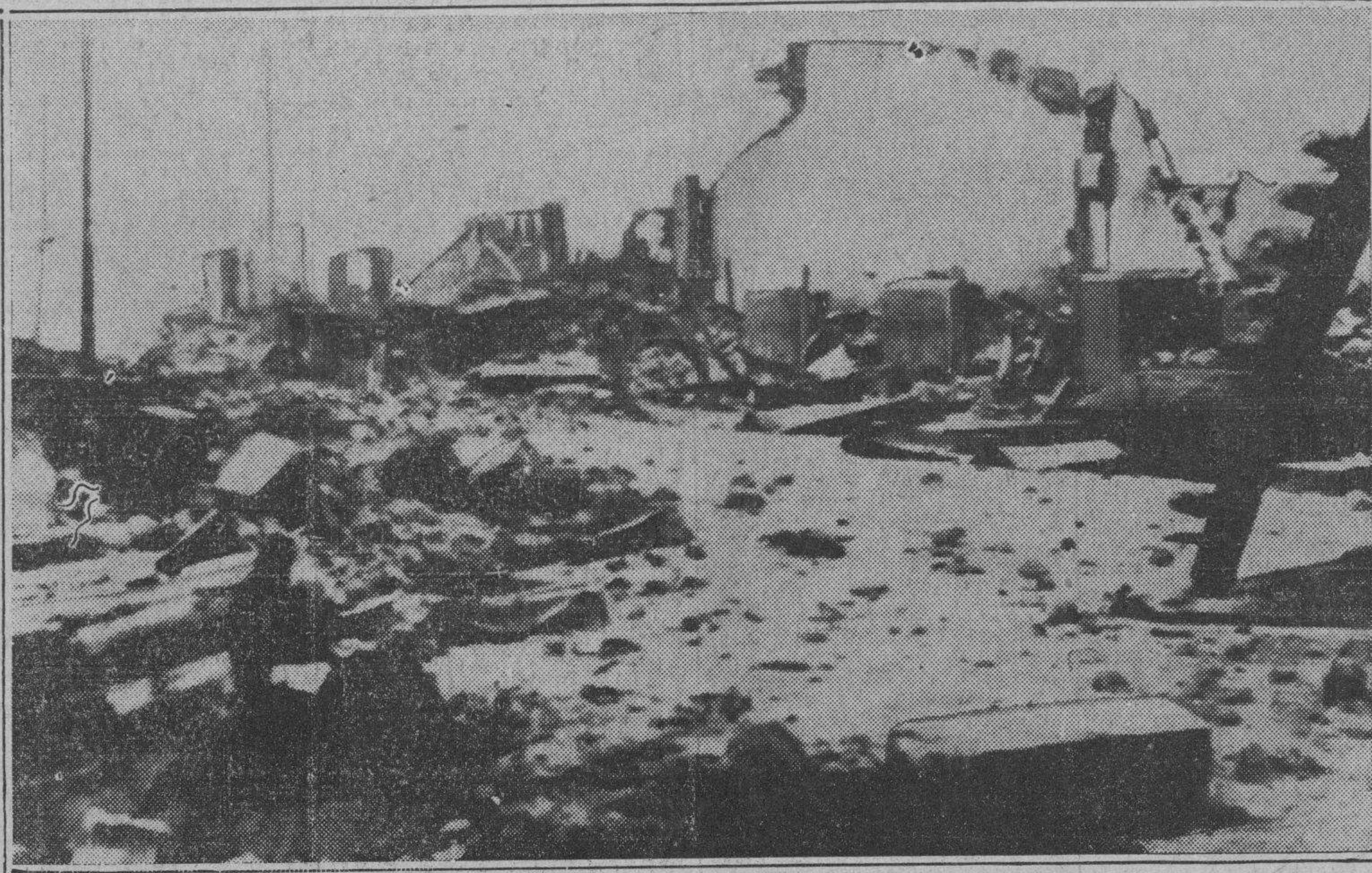
EL TERREMOTO DE MANAGUA: Aspecto del centro de la capital nicaragüense el mismo día en que un violentísimo sismo la convirtió, en pocos segundos, en montón informe de ruinas, como puede apreciarse por esta foto, exclusiva del DIARIO, al igual que las otras dos, enviada en aeroplano desde Managua a Atlanta, de donde fue telefotografiada a Nueva York, para ser reexpedida a la Habana por la vía aérea.