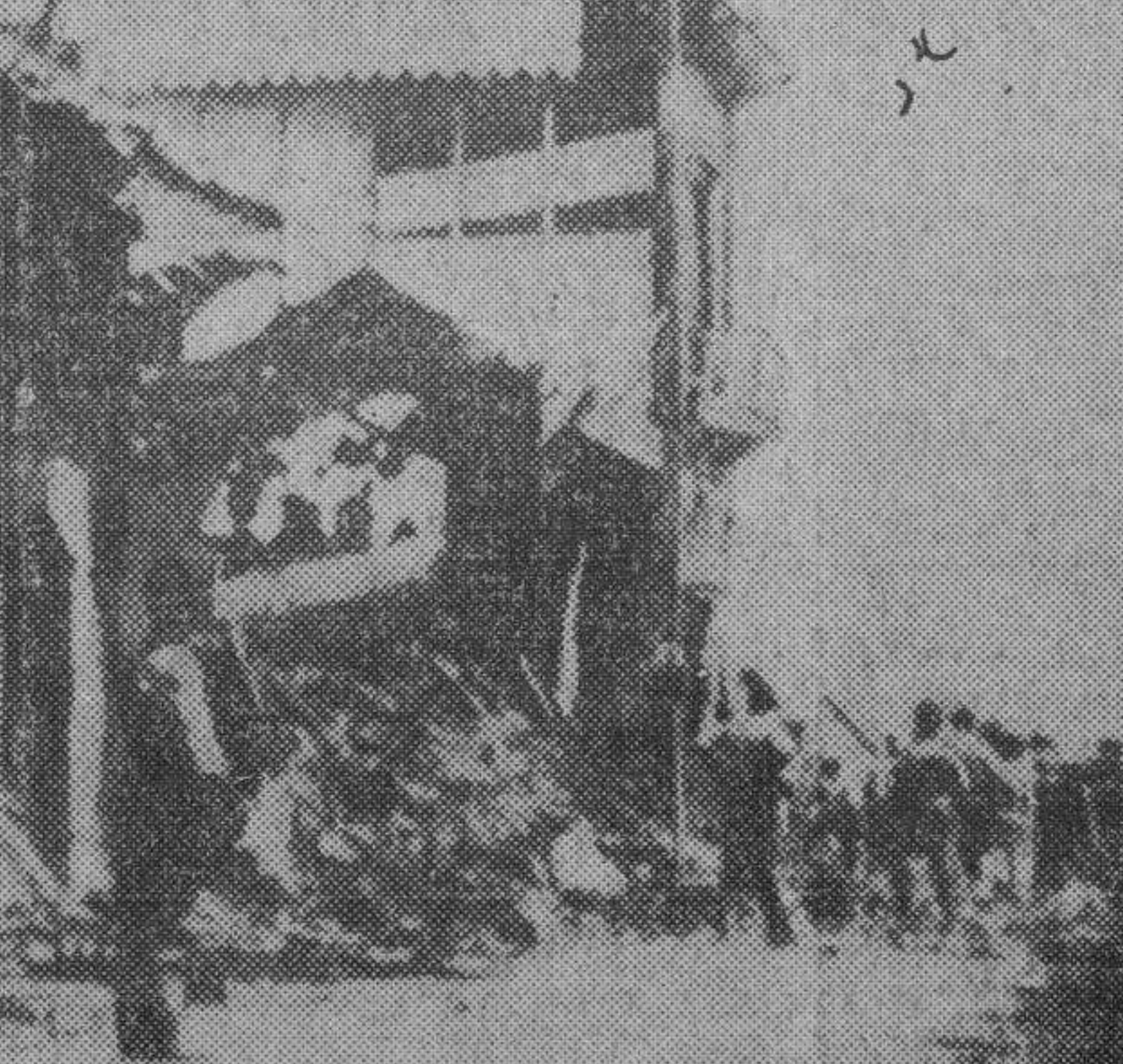
EL TERREMOTO DE MANAGUA: Aspecto de una de las calles de la capital de Nicaragua, menos sufrieron en el terremoto. En primer término se ve un montón de restos procedentes del edificio de la derecha, del que solamente quedaban en pie algunas paredes.

Han llegado a Balboa desde Managua, donde se hallaban