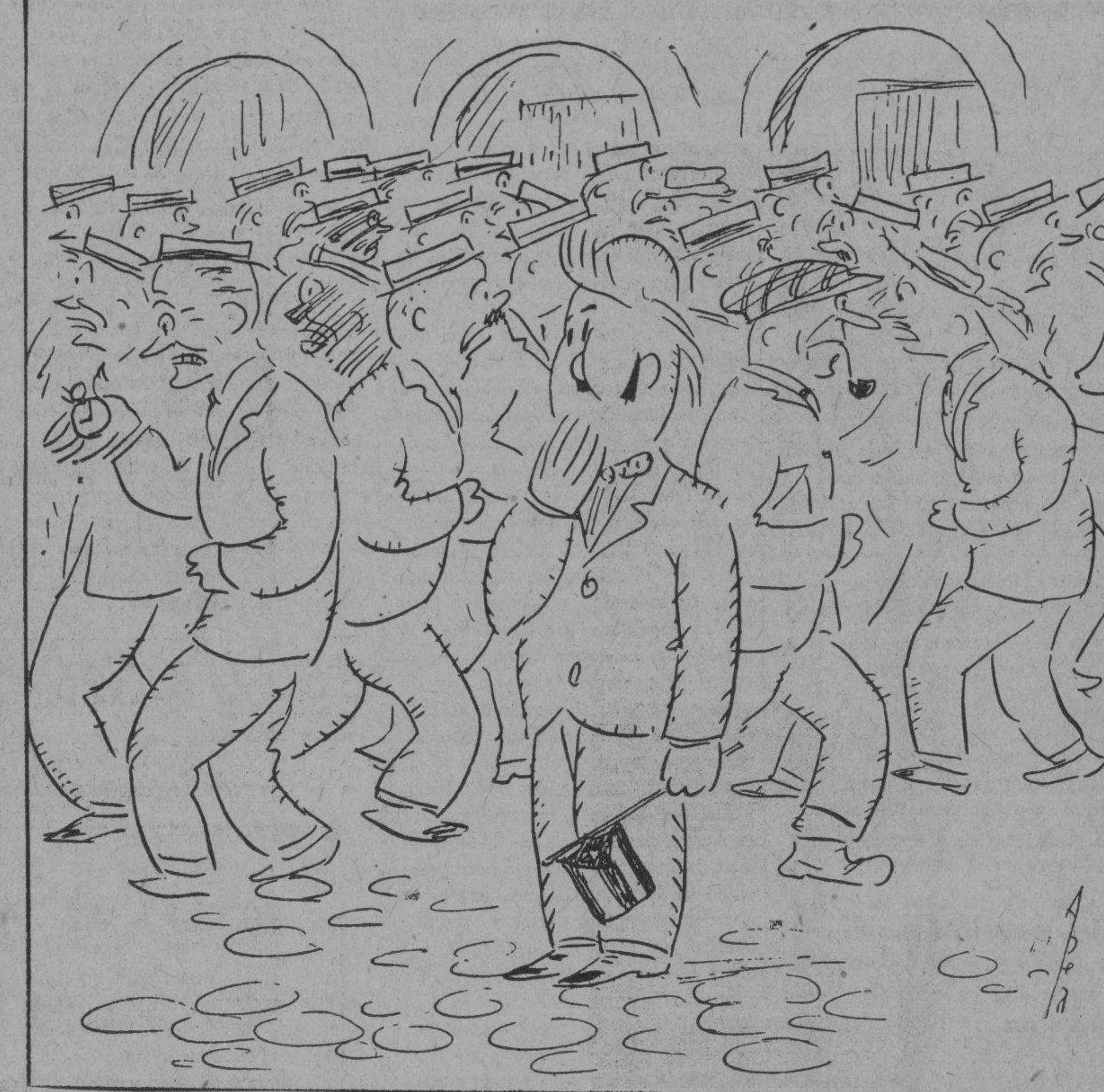
¡Cuánta actividad; qué gusto da ver como cada uno va a su negocio...