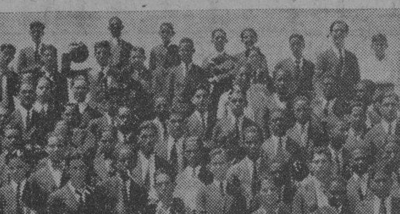
Los alumnos de Artes y Oficios, en la escalinata del Alma Mater.