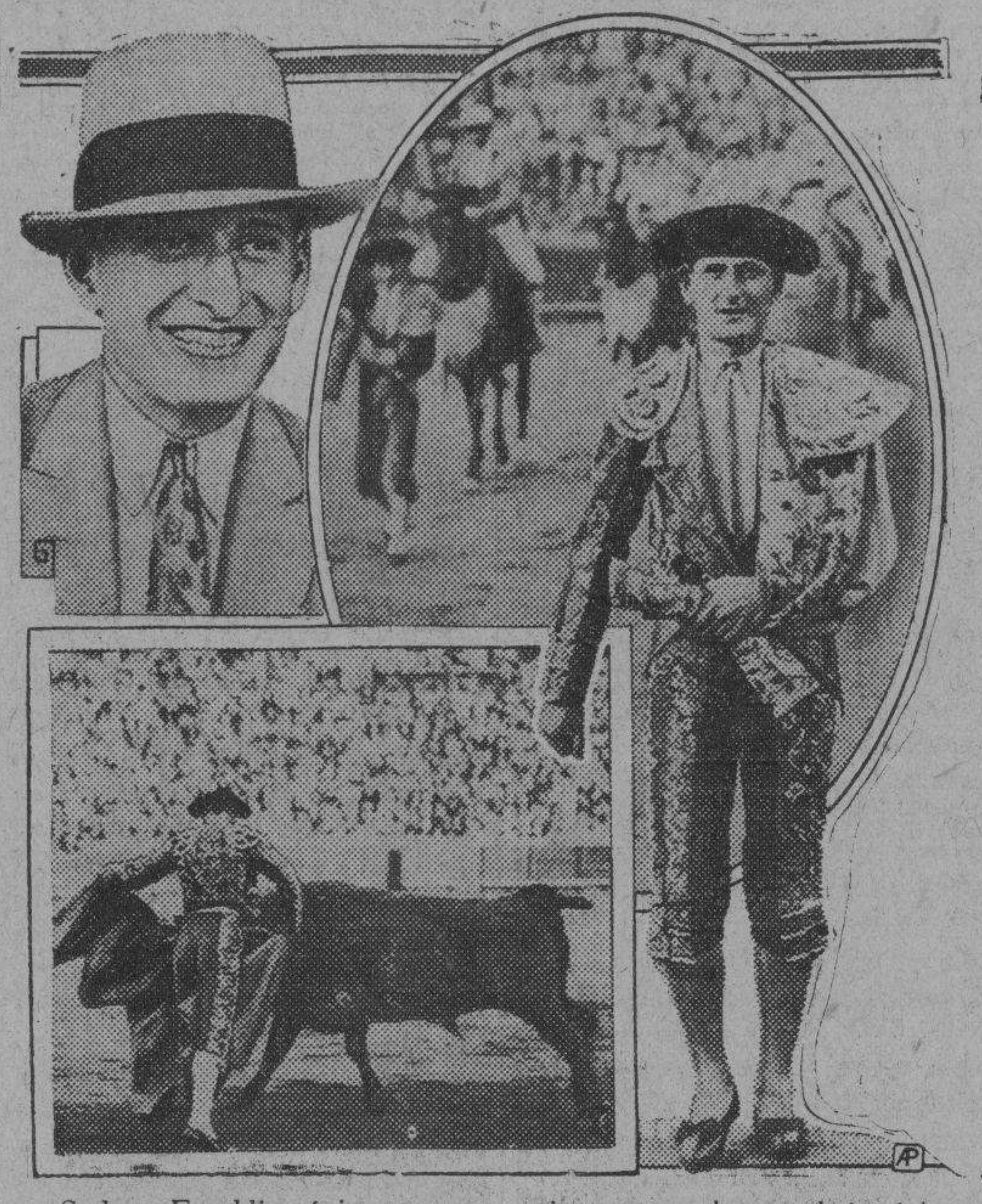
Sydney Franklin, único torero americano que obtuvo algún éxito en España y ahora se propone introducir la tauromaquia en su patria.