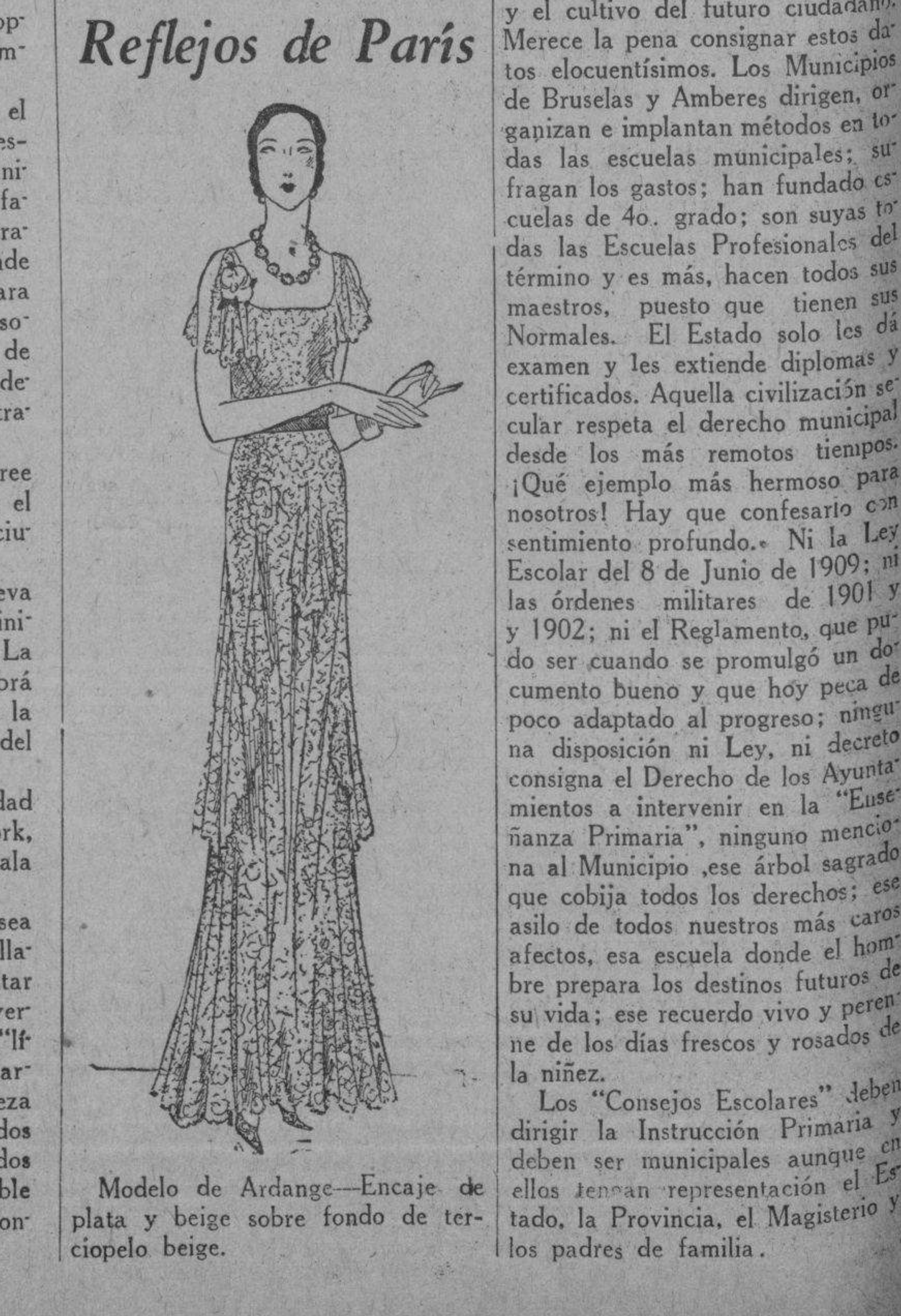
Modelo de Ardanje—Encaje de plata y beige sobre fondo de terciopelo beige.

Francia no puede servirnos de modelo en materia de enseñanza oficial, porque la organización es colar allí un tipo completo de centralización.