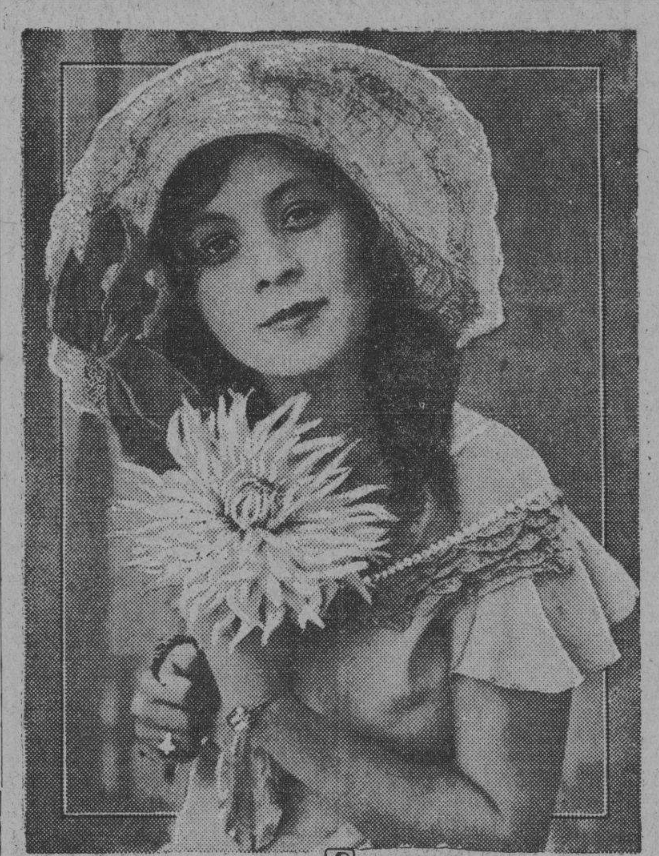
Aunque los reinados efímeros de belleza que anualmente se celebran en Galveston, han decaído bastante, no faltan industriales que exploten el rápido paso de la "Reina del Universo" por los escenarios de la publicidad.