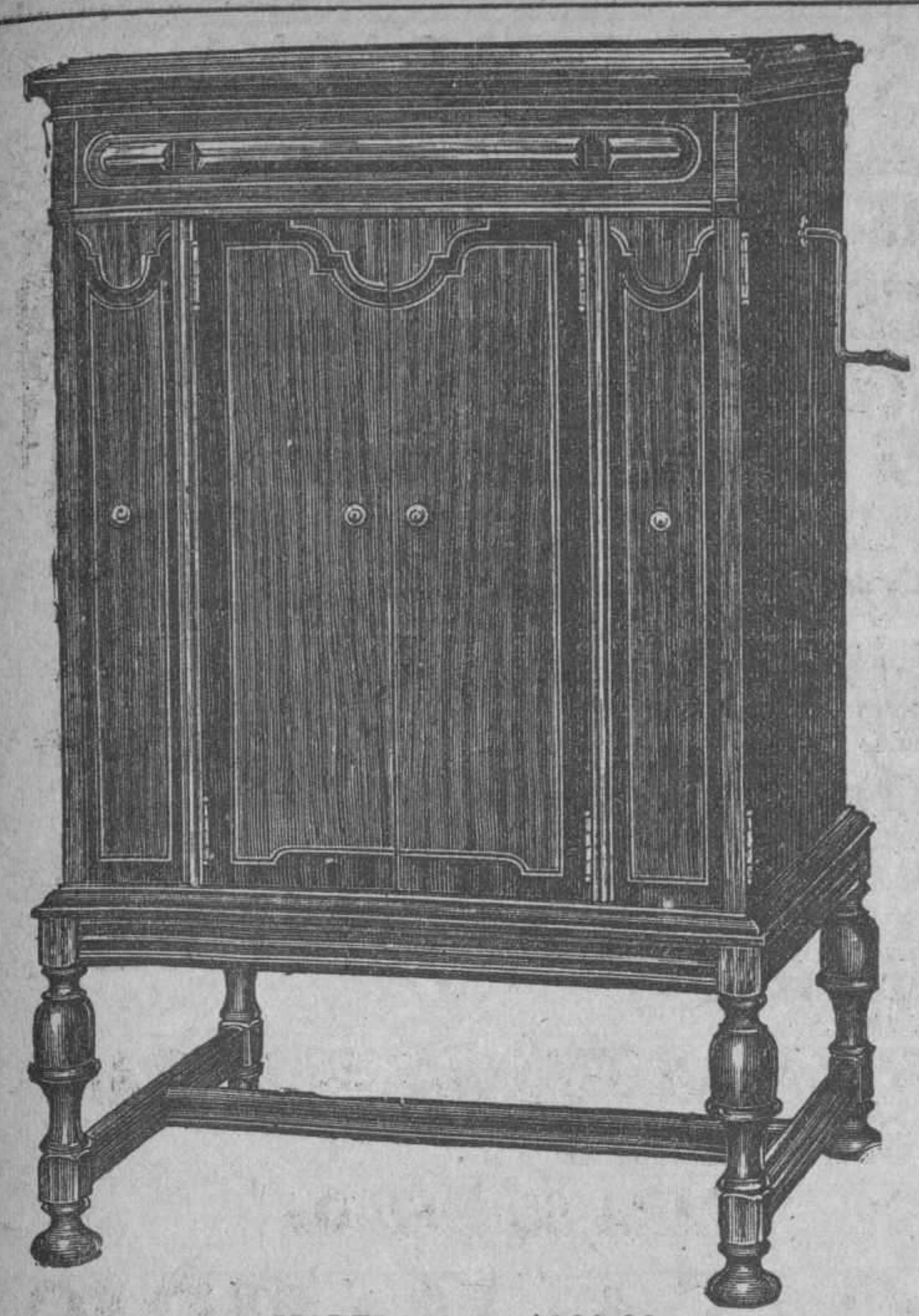
MODELO 8-4: $300.00