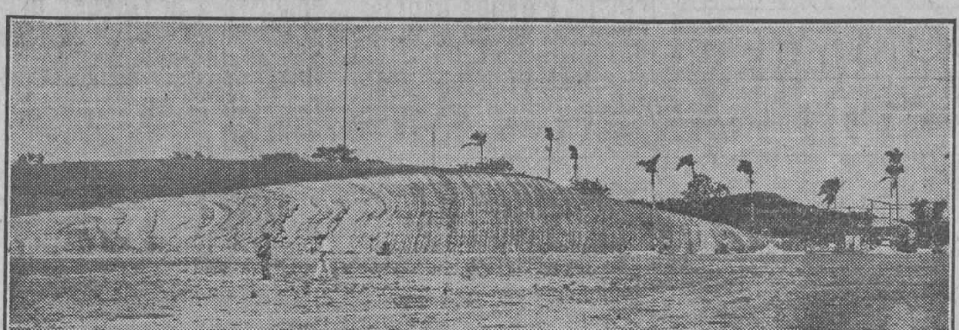
He aquí dos vistas del "Campo Armada", el Club Deportivo Hispano América, y con las cuales completamos la información que publicamos días pasados. En la loma que aparece en la parte superior del grabado se encuentra el edificio que se pondrá a trabajar en la loma que se ve a la izquierda de todo el campo.