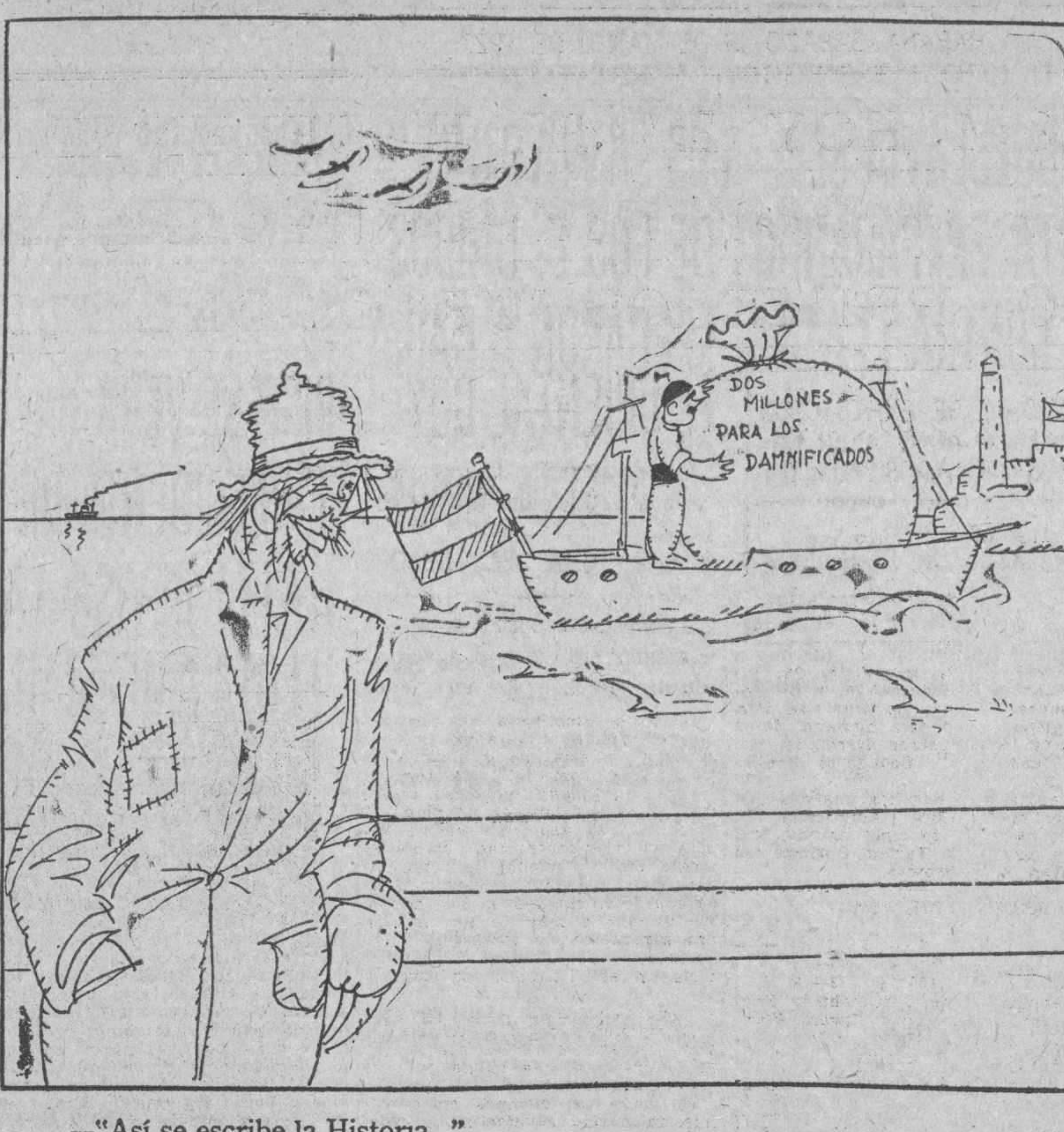
—“Así se escribe la Historia...”