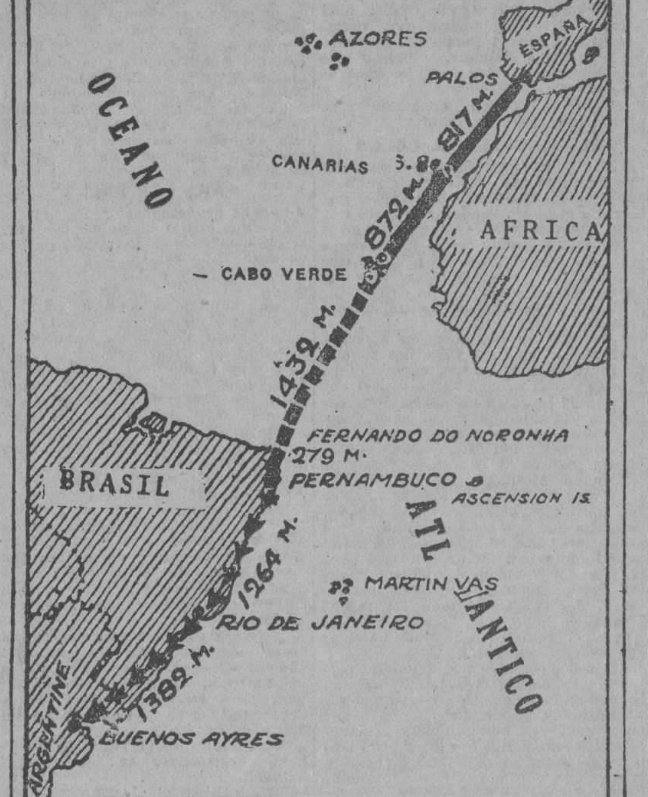
El viaje aéreo del Coronel Franco en sus diversas etapas.

$2,500,000 DA UN AMERICANO PARA LA AVIACION