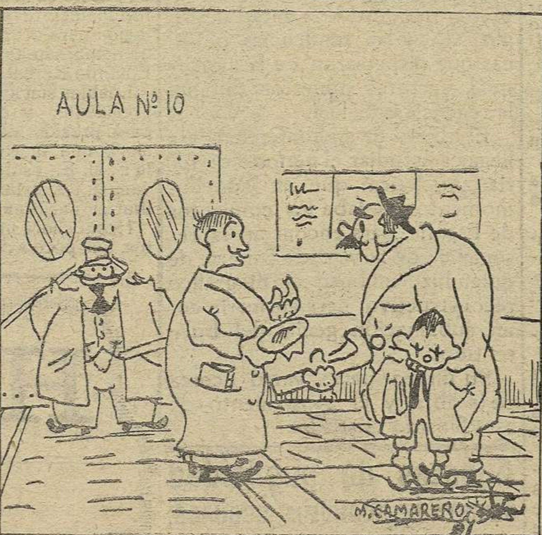
El profesor. — Vamos a ver, muchacho. ¿Cuánta crisis ha habido en España en el siglo actual? El alumno. — 44.444. El profesor. — Muy bien. Aprobado.

IMPRENTA DE CARLOS MARTÍN INFANTA ISABEL 16