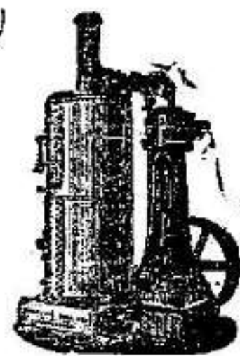
Máquina de vapor vertical.

SUCURSAL EN VALLADOLID, ACERA DE RECOLETOS, 6.