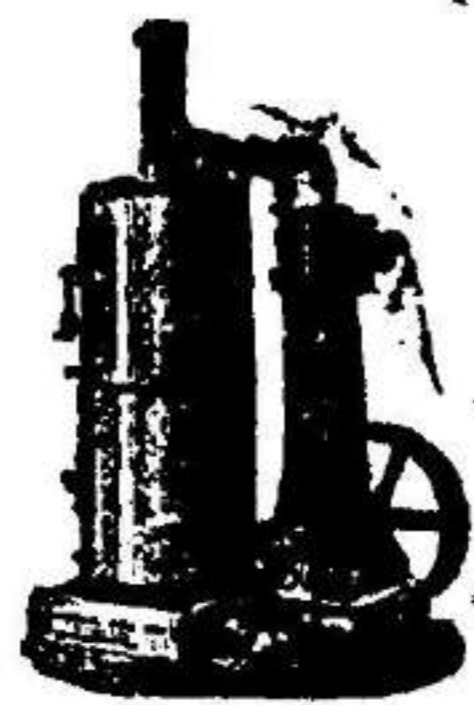
Máquina de vapor vertical.