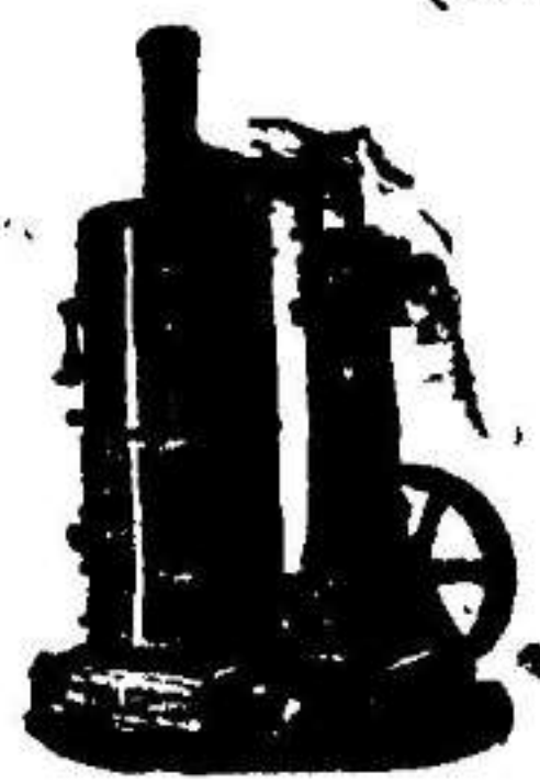
Máquina de vapor vertical.