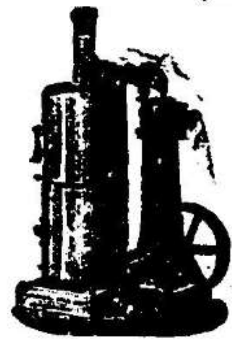
Aráquina de vapor vertical.

SUCURSAL EN VALLADOLID, ACERA DE RECOLETOS, 6.