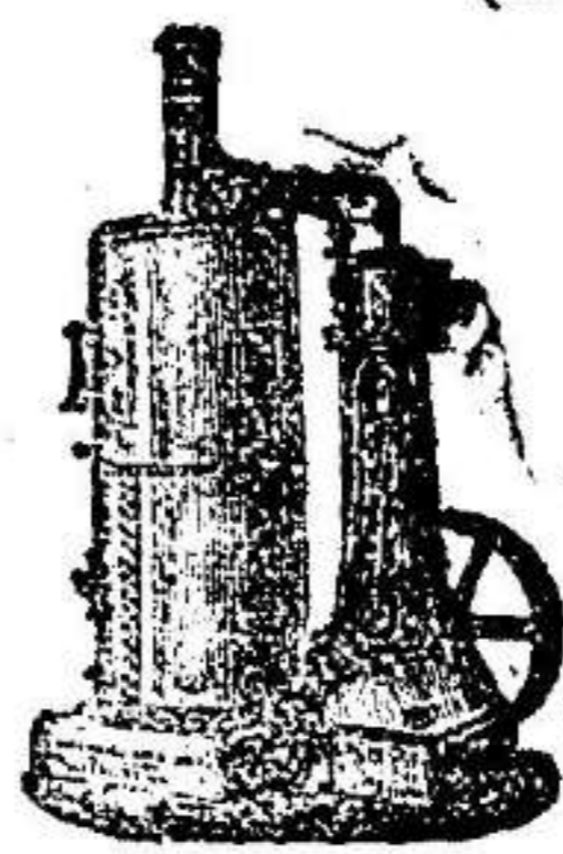
Máquina de vapor vertical.