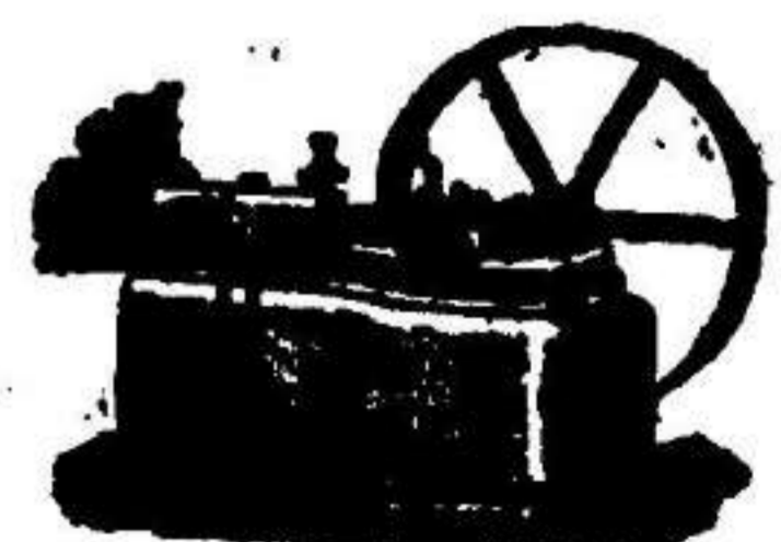
Máquina de vapor horizontal.

Catálogos gratis y francos á quien los pida.