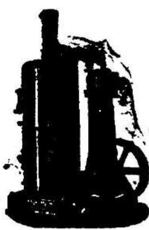
Máquina de vapor vertical.

Camas inglesas bronceadas y con preciosos dibujos. Gran novedad en estuches con todas las herramientas de carpintería, propios para hacer regalos á los niños. Ba- lanzas de porcelana, último sistema. Caprichosísimas ti- jeras en forma de cigüeña, indispensables en los costureros de las señoritas. Juegos de té, de metal blanco. Planchas económicas niqueladas, último sistema. Colchones metáli- cos con graduador. Batería de cocina, diamantes para vi- drieros, objetos para iglesia, herrajes, toda clase de herra- mientas y un magnifico surtido en collares para perros. EL CHAUBERSKI legitimo. (Calorifero móvil.) CAL HIDRAULICA Y CEMENTO ROMANO.