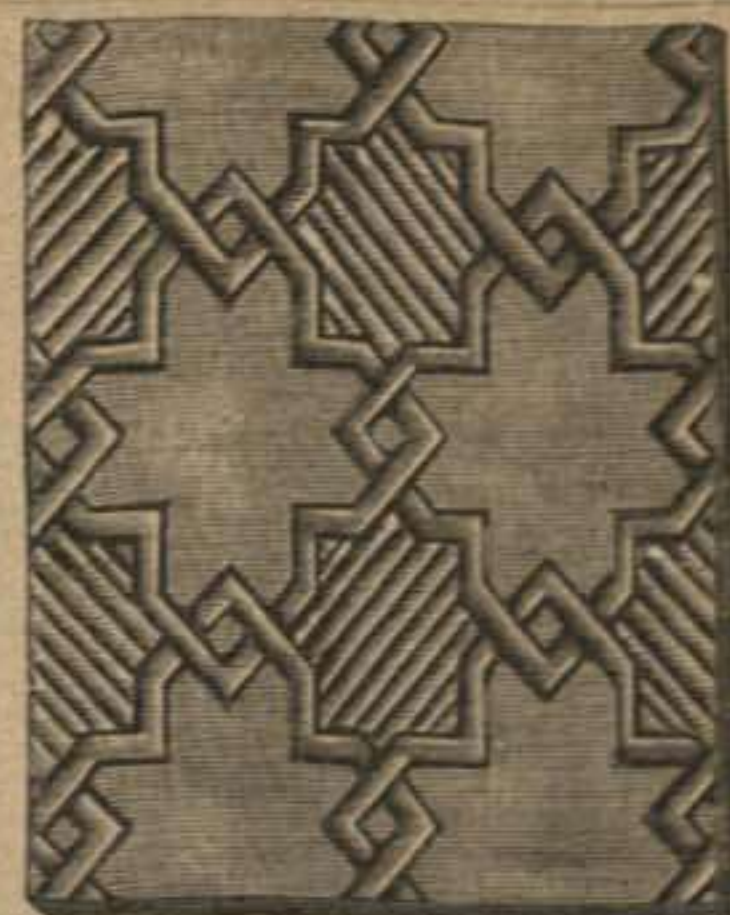
68. Fondo de cuero recortado para el devocionario, dibujo 67.