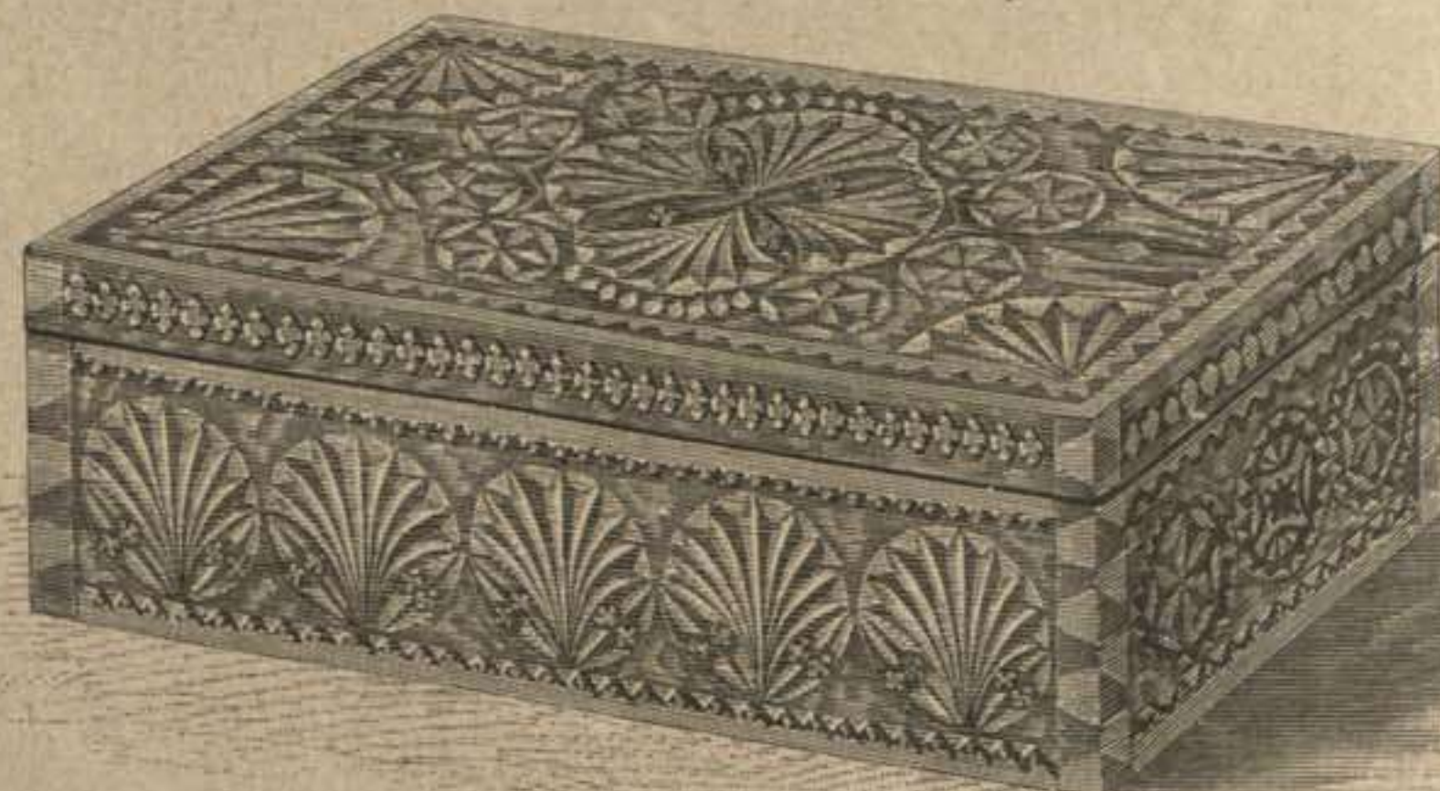
80. Caja para papel de cartas, retazos etc. Madera recortada (escultura hueca). Dibujo de adorno: Supl., Recto, fig. 45 y 46.

80. Caja para papel de cartas, retazos etc. Madera recortada (escultura hueca). — Dibujo de adorno: Supl., Recto, fig. 45 á 47. — La caja está de 10 cent. de altura por 30 cent. de largo y 18 cent. de ancho. La fig. 45 reproduce la cuarta parte del adorno de la tapadera y la fig. 46 una parte de la decoración del lado. El seso sobre la tapa terminada en una capa de varniz claro.