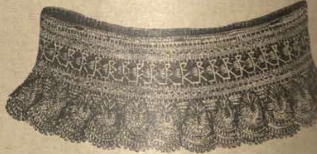
63. Guarnición de pantalones. Crochet hiladillo. Véase el dibujo 64.