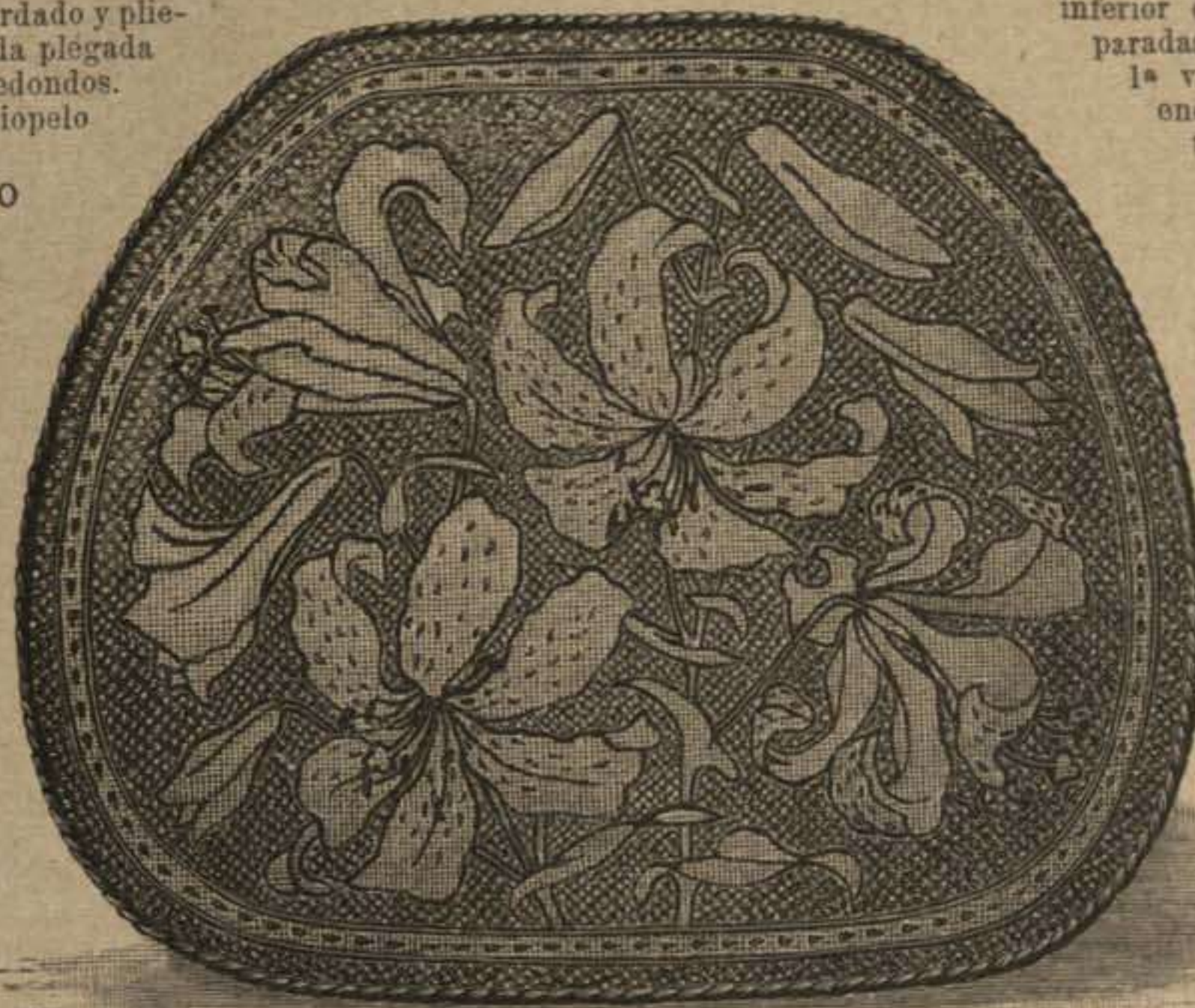
73. Almohadón para butaca de jardín, balcón etc., adornado con bordado. Véase el bordado, dibujo 74. Dibujo de adorno completo: Supl., Recto, fig. 41.