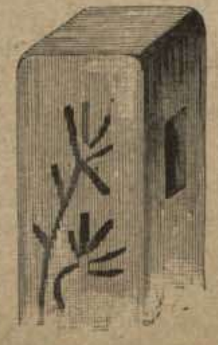
61. Pié adornado de pintura para el estantillo, dibujo 60. Véase el dibujo 62.