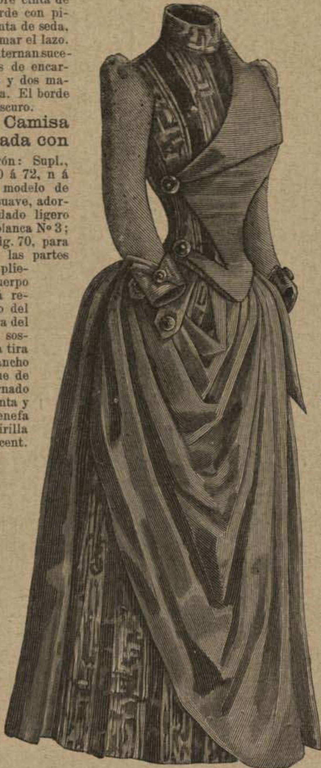
54. Traje con falda apañada diferentemente sobre los dos lados. Véase la espalda, dibujo 41, y de perfil, dibujo 46. Patrón: Supl., Recto, N.º X, fig. 42, estrella, doble punto.

35. Camisa de dormir con cuello ancho vuelto. — Patrón Supl., Recto, N.º IX, fig. 41, estrella, doble punto. — Debe cortarse y confeccionarse con nansú fino sobre a y b, de la fig. 41. La espalda cosida á plieguecitos está montada de manera que forme canesú. El cuello, saliendo de lo ordinario, es pegado á la tirilla del escote del cuello, formando punta con arreglo á los signos correspondientes; con plieguecitos y encaje Valen-sienne que disimula los botones de la pechera. El mismo adorno en la manga. Lazos.