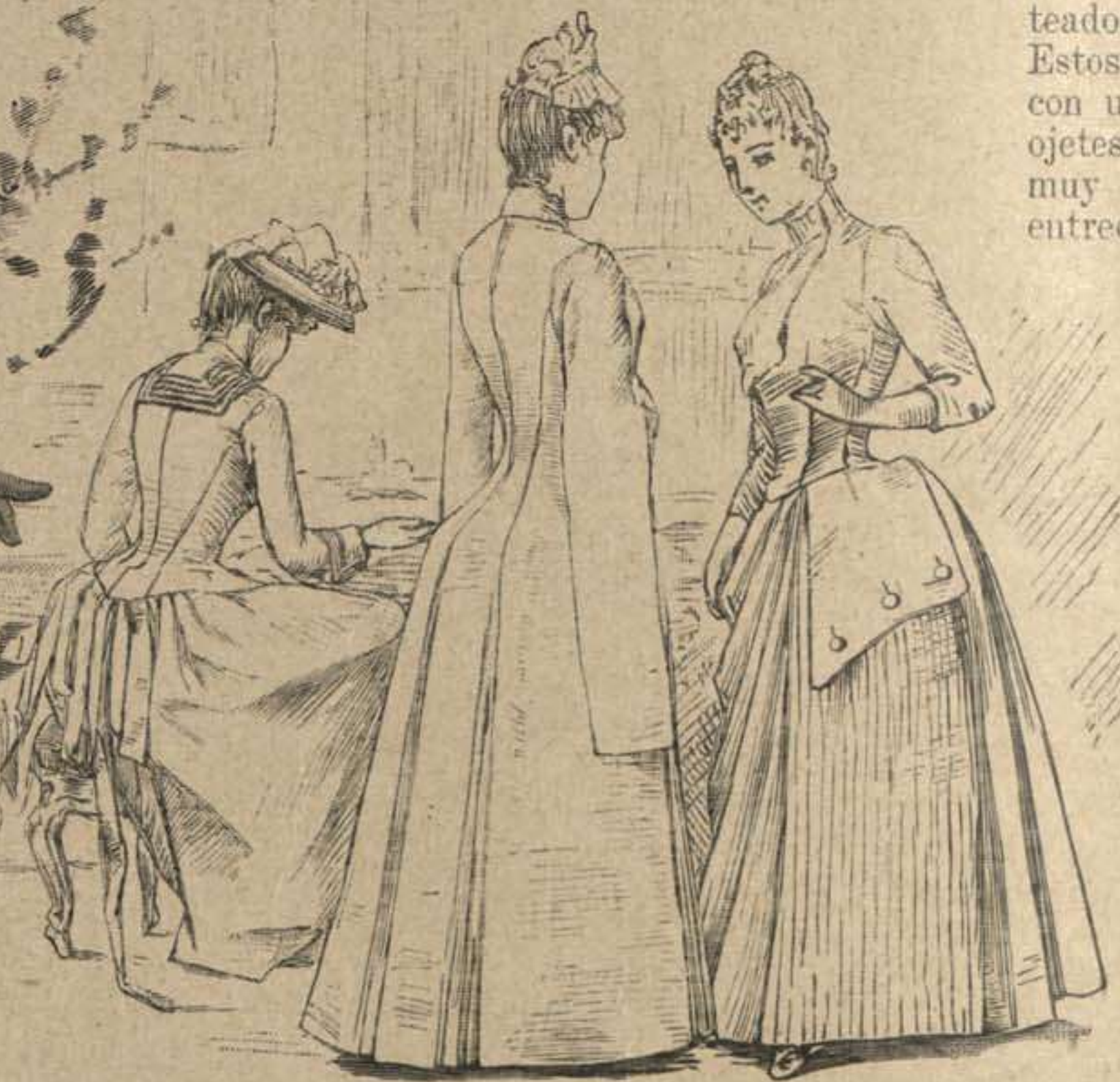
40. Mañanita con manga á la griega. Espalda del dibujo 45. Patrón: Supl., Verso, N.º XXV, fig. 87. 42. Paletó corto ajustado con cuello marino. Patrón: Supl., Recto, N.º II, fig. 12 á 18, a á o, estrella, cruz, doble punto. 43. Paletó corto, ajustado con delanteros. Patrón: Supl., Recto, N.º II, fig. 12 á 22, a á o, estrella, cruz, doble punto, punto.