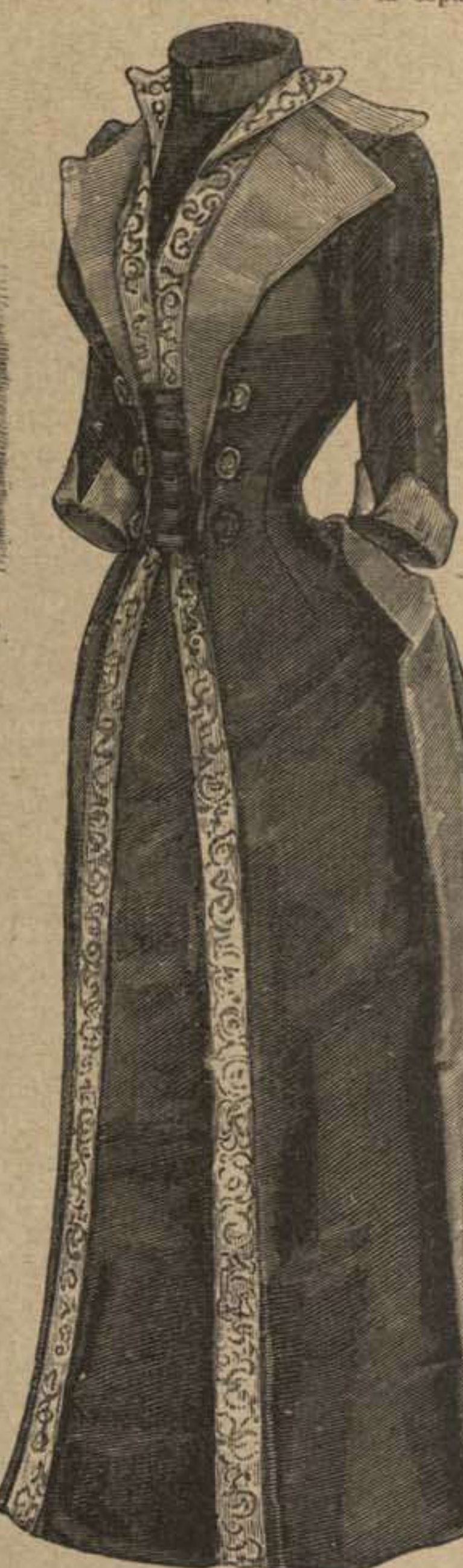
55. Traje con túnica forma de gabán.

damasco de unos 55 cent. de ancho, colocado, desde el medio delantero; a del croquis, representa el apañado recogido de cachemir. El borde izquierdo queda flotante, mientras que el borde derecho queda reducido con el apañado á 18 cent. y sugeto al talle. El borde superior plegado á pliegues apretados, se monta á la cintura; el recto recae sobre el damasco haciendo una curva y se sugetará con dos tirillas puntiagudas de 8 cent. de ancho por 20 á 30 cent. de largo. El paño b que cae recto, completado con la tapadera de bolsillo c se debe juntar con arreglo á las líneas (véase dibujo 46). Se volverá á plegar los dos bordes del lado de los dos paños de detrás, siguiendo la línea para formar solapas; estos dos lados cosidos en punta, se forran con cachemir, los de la espalda con damasco.