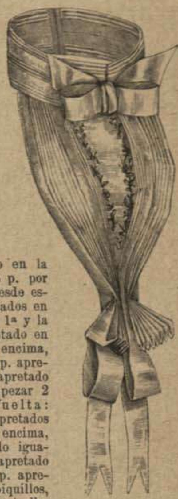
69. Pechera de crespón y cinta pintada.