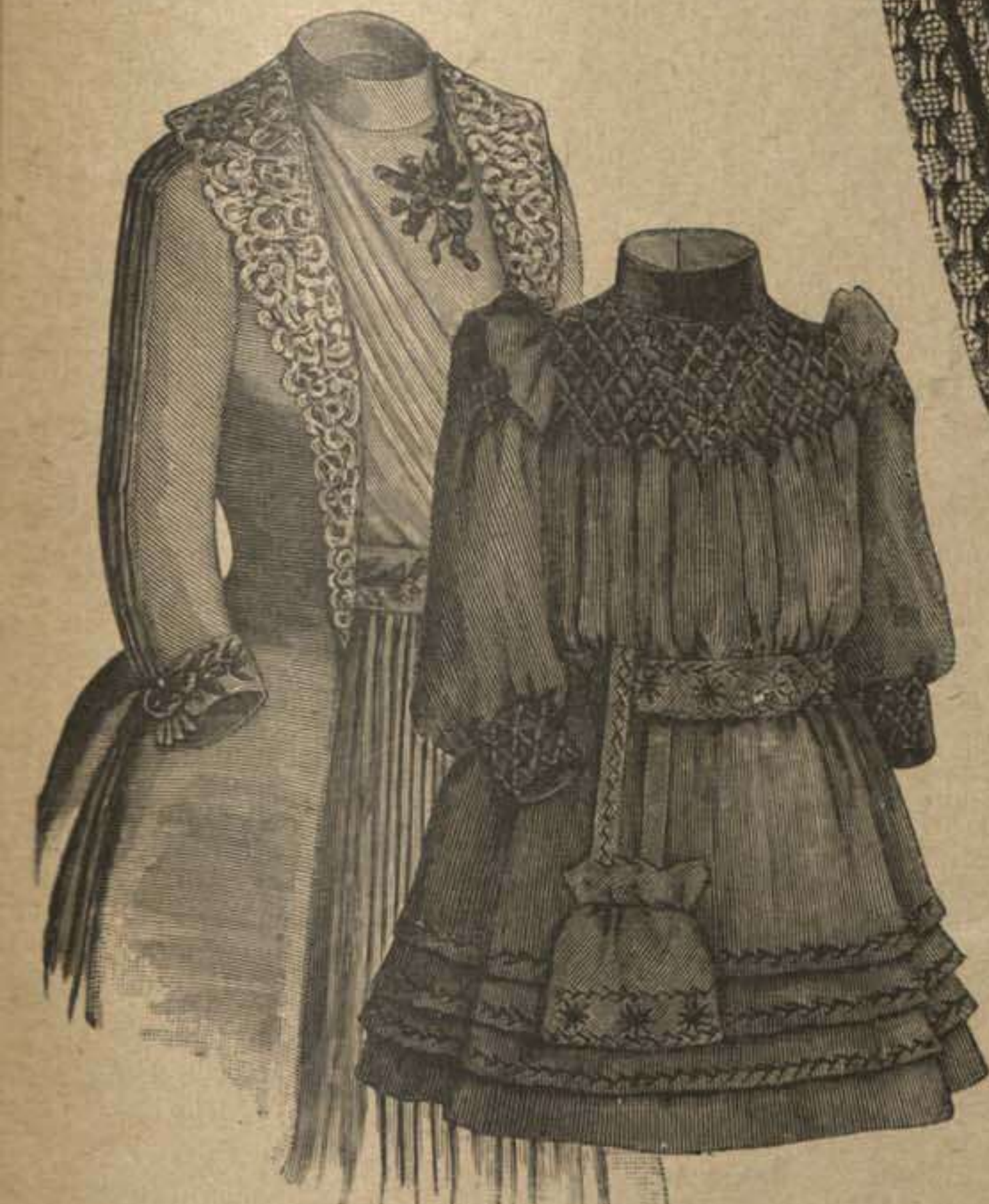
71. Delantero del vestido con túnica recta para jovencita. Espalda del dibujo 65.

60 á 62. Estante con pintura decorativo. — Dibujo de adorno: Supl., Verso, fig. 90 á 93. — Nuestro modelo de percal se monta sin cola por medio de estaquillas. Los cuatro pies tienen 25 cent. de altura; el del medio 17 cent., unidas con planchas de 2/3 cent., colocadas, 2, 10, 17 y 23 1/2 cent. de altura. Estas planchas tienen 10 cent. de ancho, 25 cent. de largo en la parte de abajo y arriba y 15 cent. en el medio. Véanse los dibujos 61 y 62 para recortar las planchas en los espigones para los