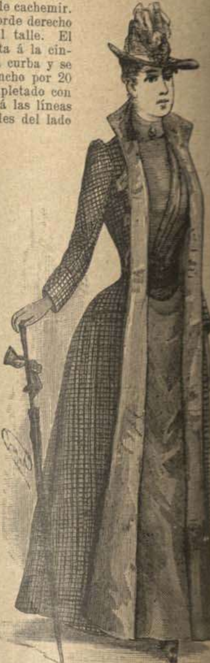
58. Abrigo largo medio ajustado forma gabán. Véase el dibujo 57. Patrón y espalda: Supl., Recto, N.º III, fig. 23 á 27, p á z, estrella de la manga.

recto de cachemir, formando una profunda abertura. La manga forma algunos pliegues encima del puño de damasco como cuello. Tones grandes de pasamanería, marrón y canela.