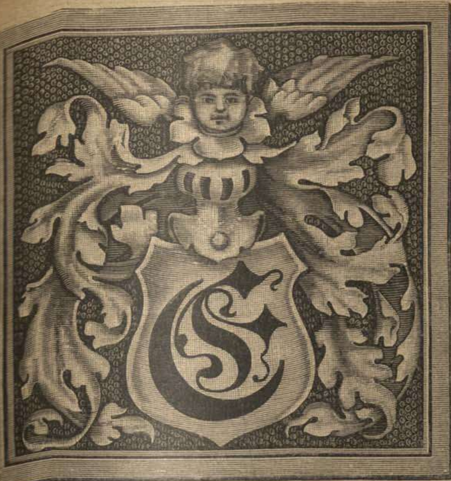
Adorno de encuaternación. Cuero recortado para el devocionario, dibujo 67.

mitad de la cola. Se sujetará el borde superior de los dos lados, a, formando pliegues juntos sobre la falda, el medio arreglado en pliegues planos, se abrocha sobre los faldones del corpiño. Este está adornado con una pechera de encaje y un cinturón plegado. Manga de ancho contorno guarnecida con encaje en la parte de abajo.