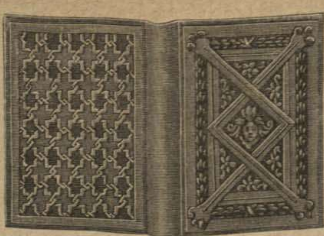
67. Devocionario de cuero recortado. Véanse el fondo, dibujo 63, y el dibujo 66. Diseño de adorno: Supl., Verso, fig. 88.

52. Vestidito escotado para niño de 2 á 3 años. — De batista con corpiño de talle largo, arreglado en pliegues de 3 cent. y plegado al canesú del bordado. Entredós de bordado y pliegues á la falda plegada de 3 cent. y pegada al canesú del bordado. Entredós de bordado y pliegues en la falda plegada á pliegues redondos. Lazos de terciopelo verde.