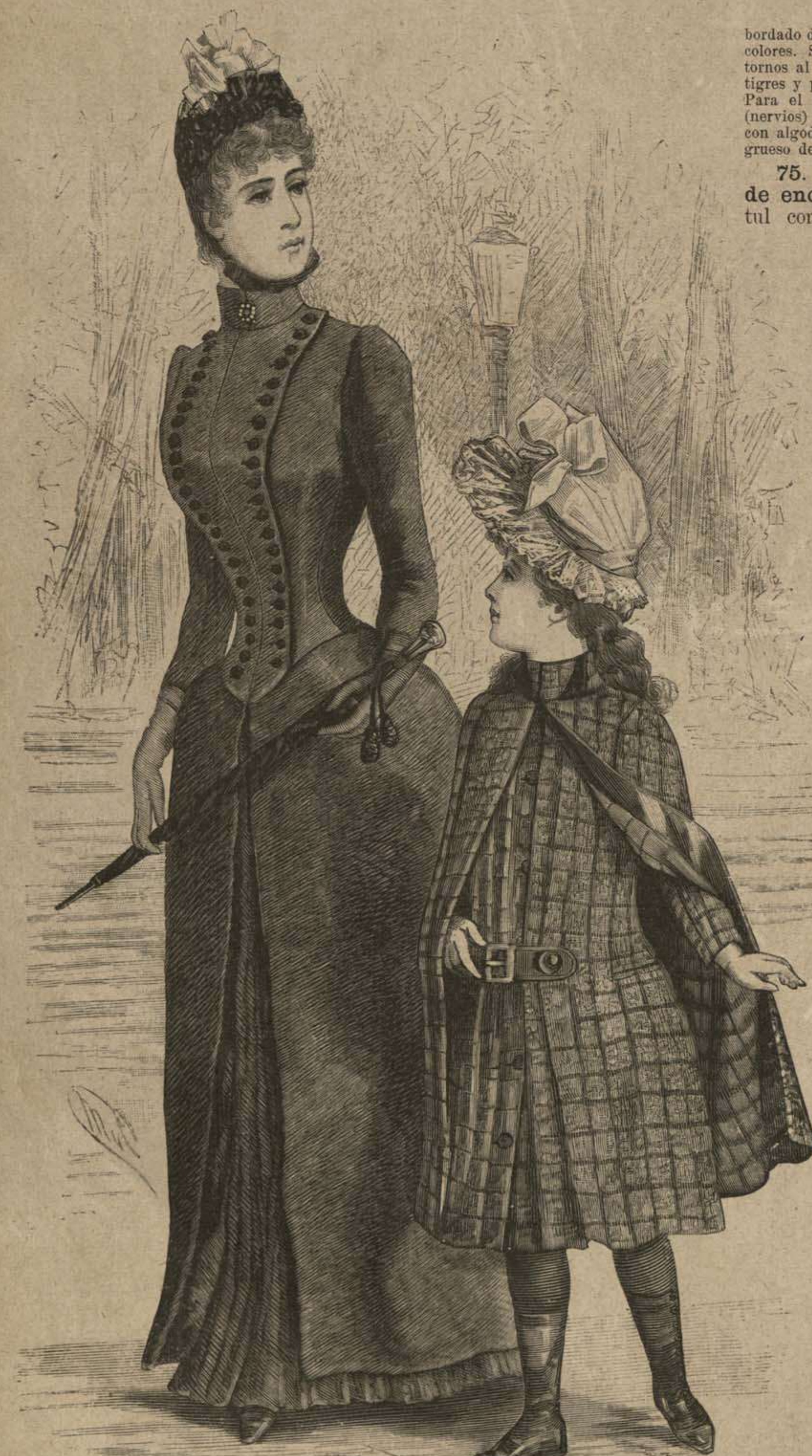
77. Traje de paseo con túnica de forma gabán. Patrón y espalda: Supl., Recto, N.º I, fig. 1 á 11, A á Z, estrella, doble punto, pliegues 1 á 3.