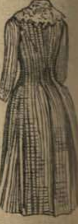
65. Espalda para abrigo para cita, dibujo 57.