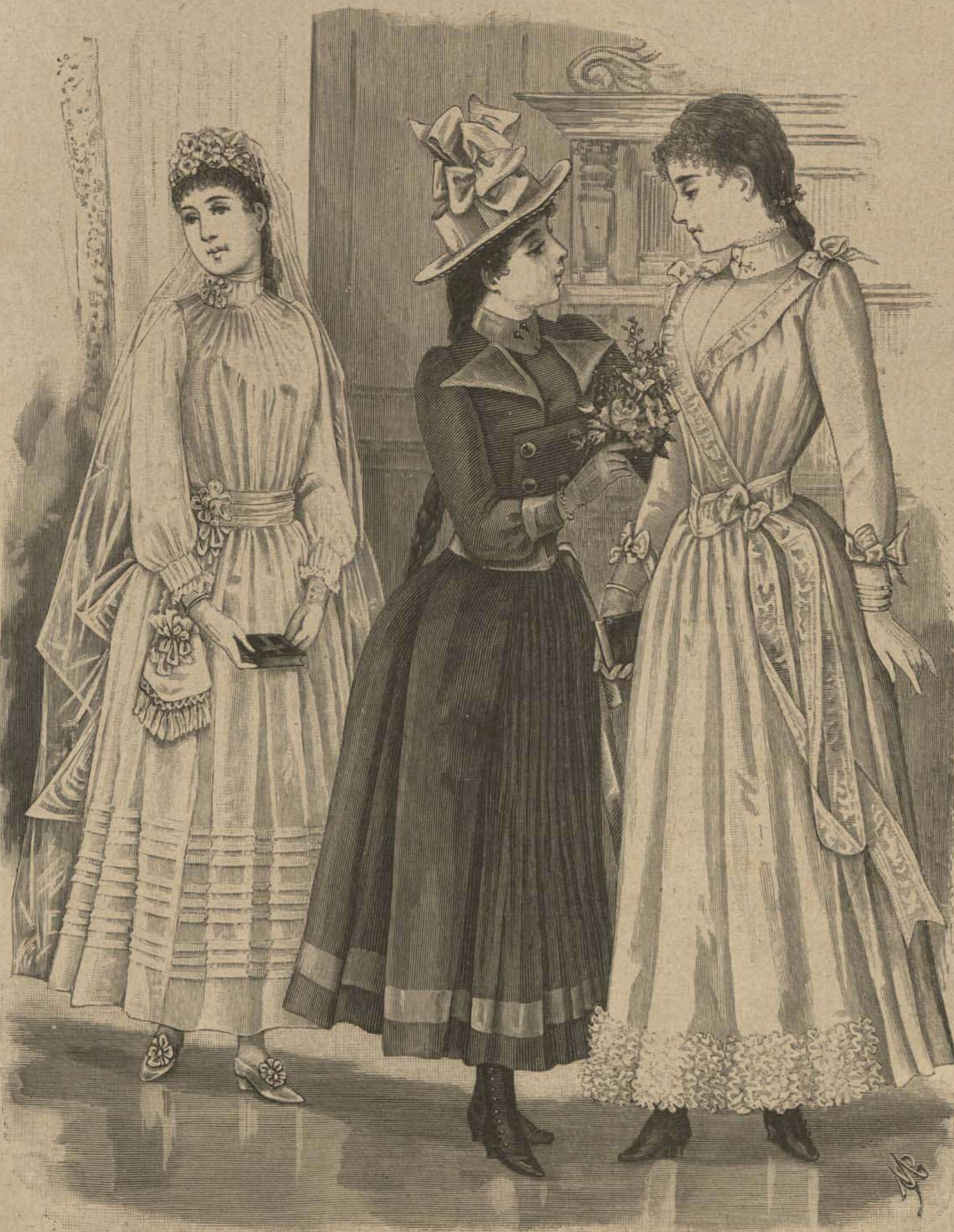
1. Traje de comunión para jovencita.

fruncidos y bullonados. En este momento se está positivamente abusando de los enaguados, puntillados y ropillas de