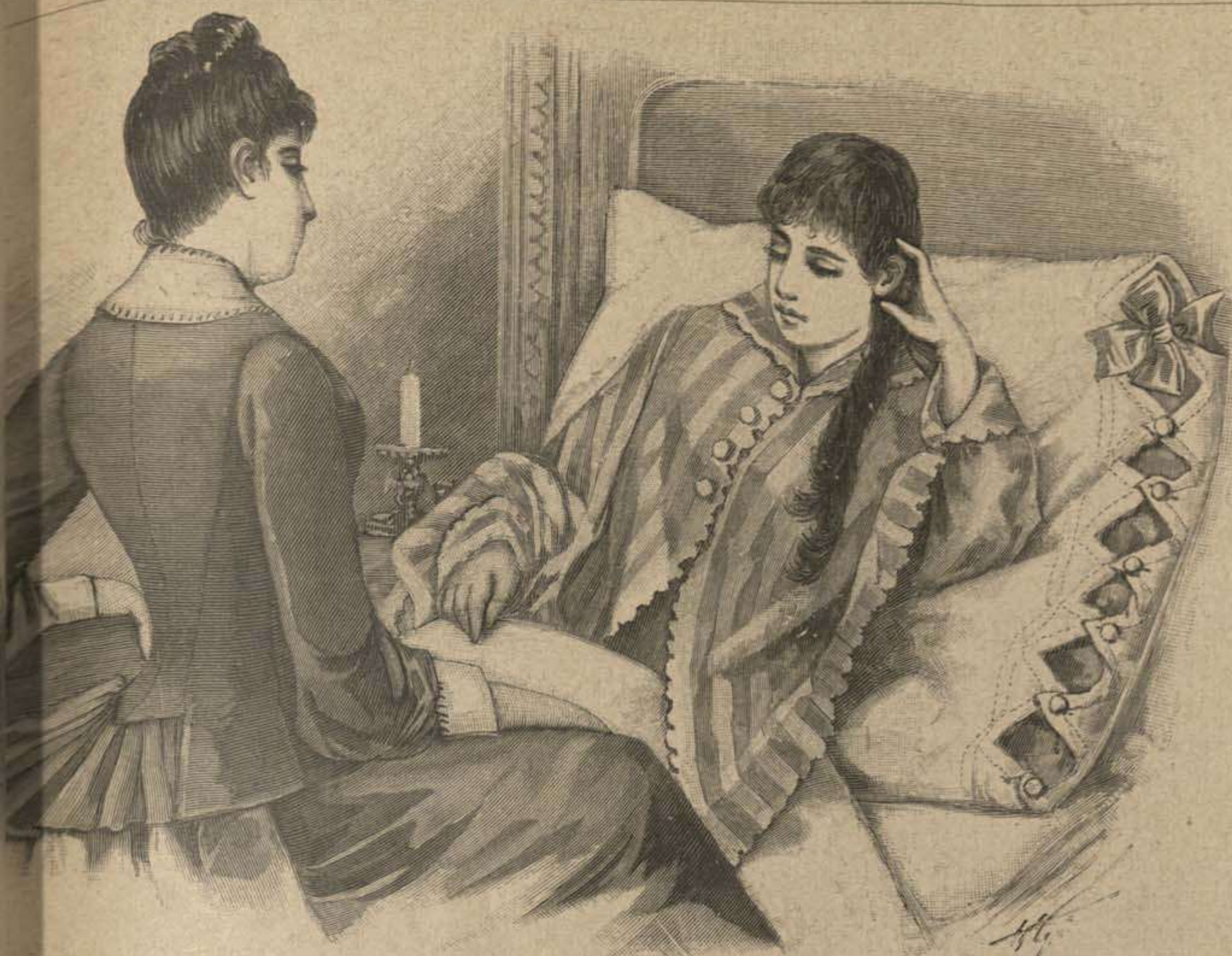
47. Pechera flotante. Delantero del dibujo 70. Patrón: Recto, No XI, fig. 43, estrella, doble punto.