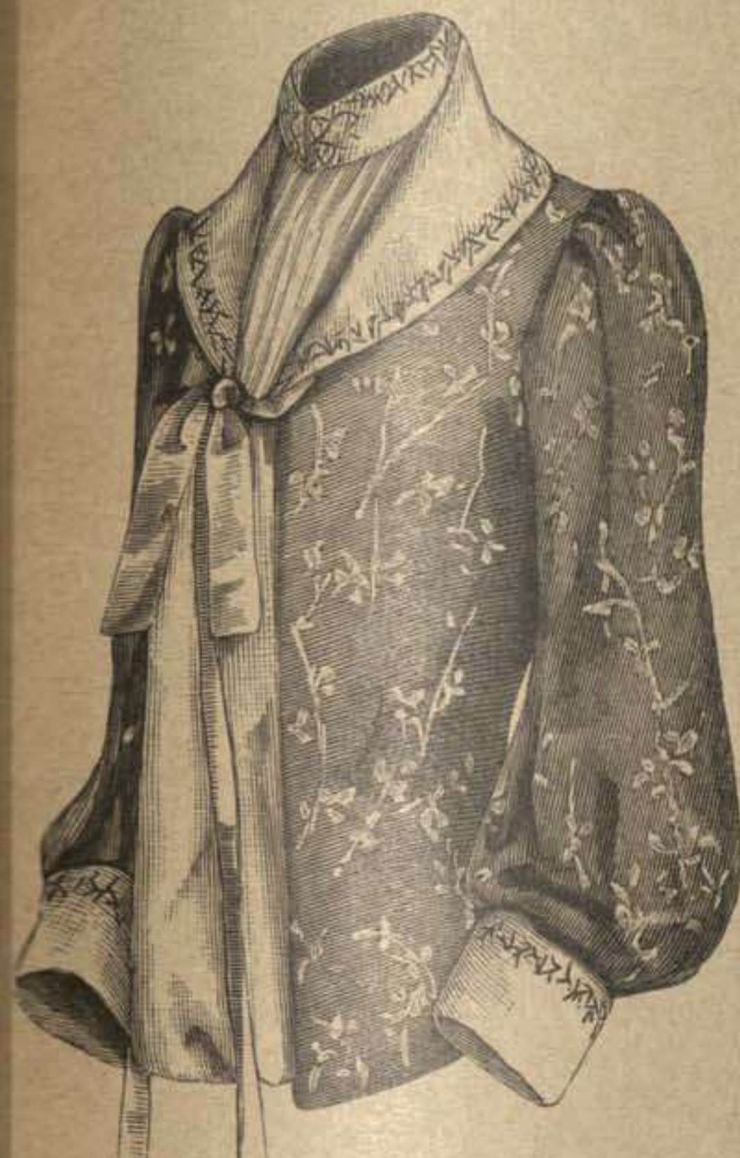
70. Mañanita con pechera. Delantero, del dibujo 47. Patrón: Supl., Verso, N.º XI, fig. 43, estrella, doble punto.

sirve á la vez de vestido y abrigo. Es de paño fino, verde musgo y de seda, del mismo color con bordado multicolor. Los delanteros de paño se cortan de un solo pedazo; la falda de seda por detrás, se une á los delanteros y prende al faldón del corpiño por detrás. Pechera de paño, anchas solapas y bocamangas de seda. El delantero, á la altura del talle, está retenido con presillitas de seda y botones. Mírase el dibujo para disposición del cuello y de la guarnición.