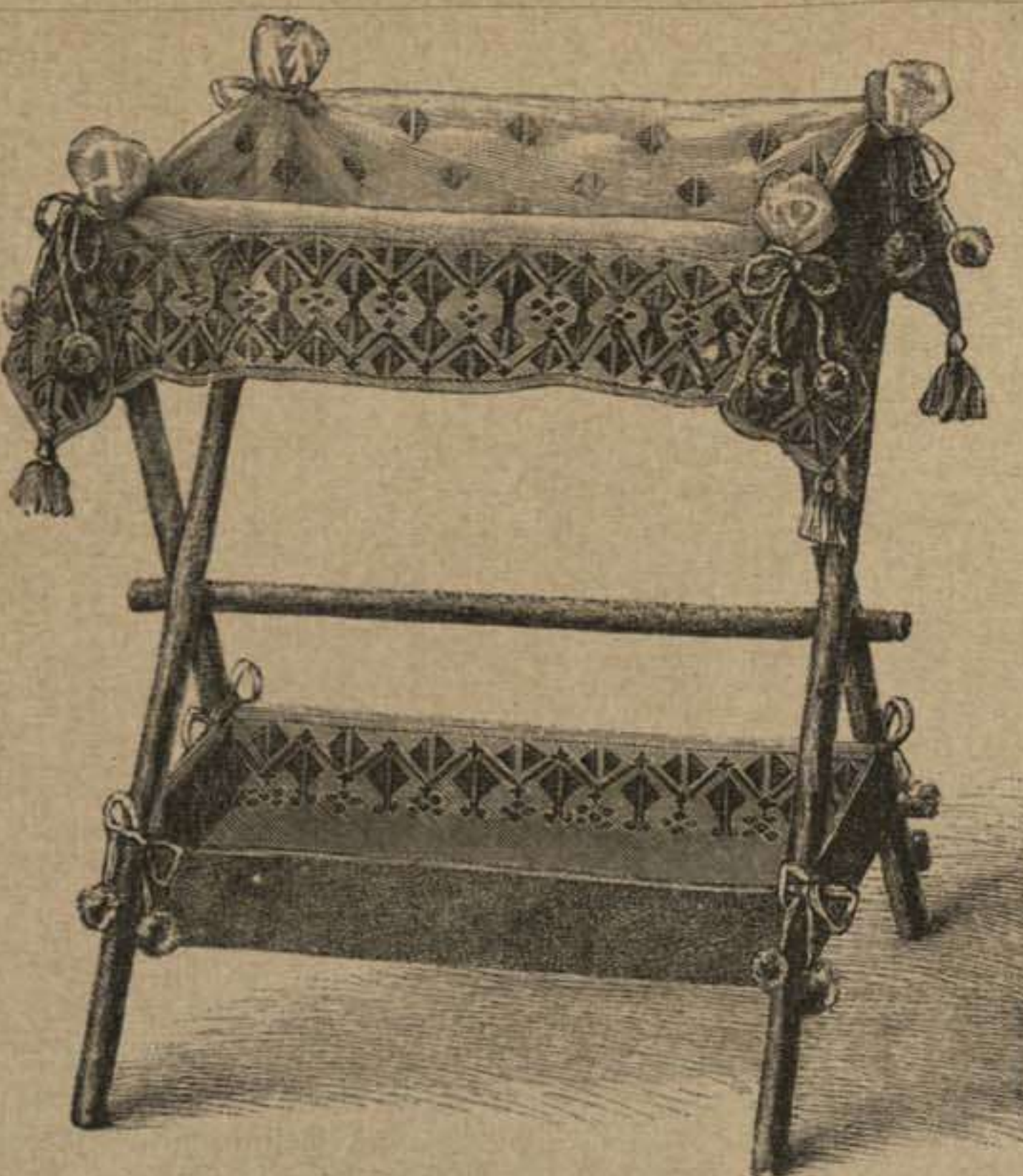
53. Aparador adornado de cenefas bordadas. Véase el dibujo 17.