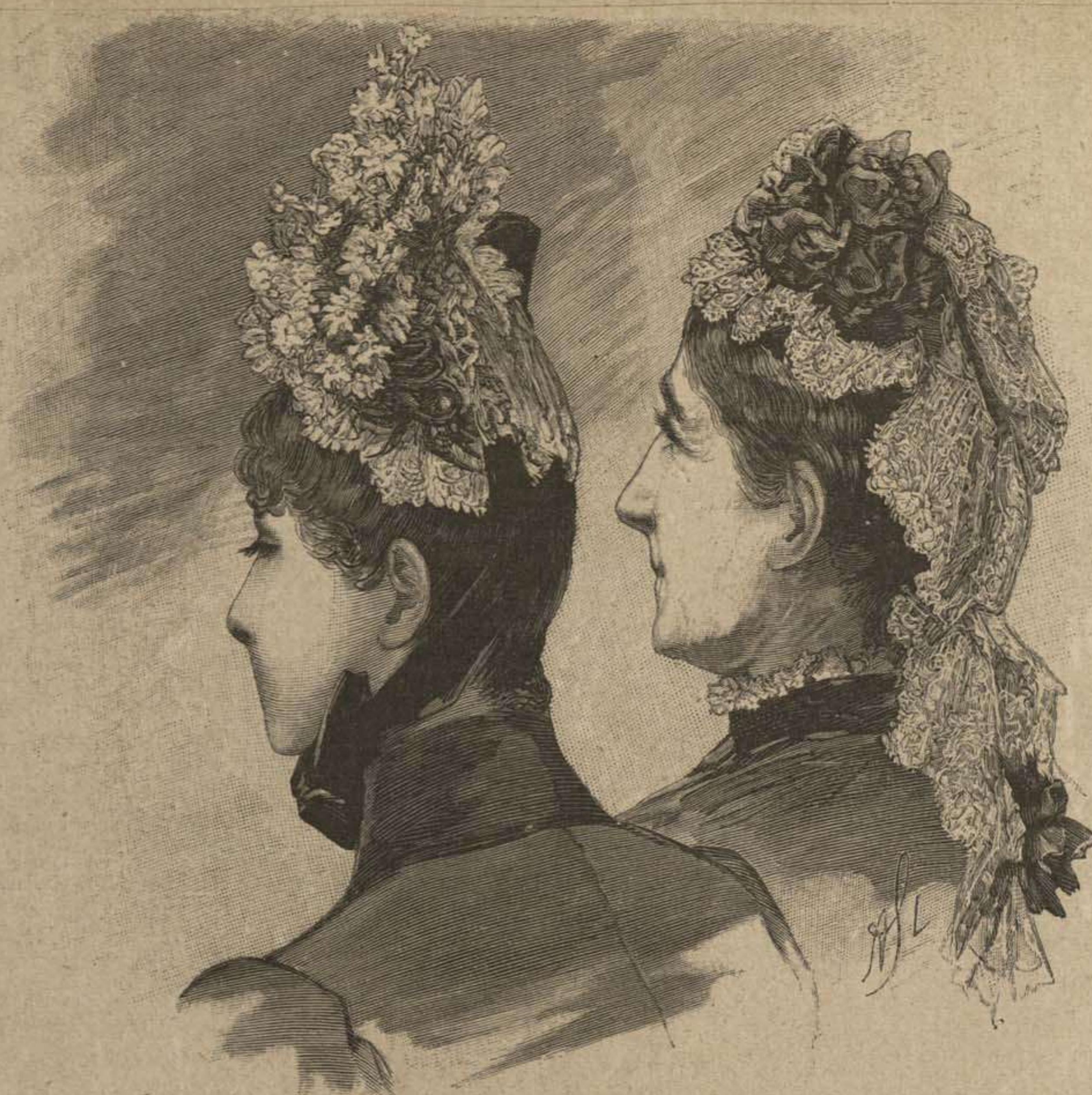
75. Sombrero de primavera de encaje. 76. Gorra de encaje para señora de edad.

73 y 74. Almohadón para butaca de jardín, balcón etc., adornado con bordado. — Dibujo de adorno: Supl., Recto, fig. 44. — Nuestras suscriptoras nos han felicitado por un modelo de tapete que publicamos no ha mucho; las ofrecemos hoy otra labor procedente de la misma casa artística. El cojin tiene 43 por 36 cent. de ancho del medio tomado por el medio. La parte del bordado, tamaño natural, dibujo 74, se completará con el dibujo del adorno, fig. 44. El fondo es de tela blanca, llamada, „tela de ojo de perdiz“ el