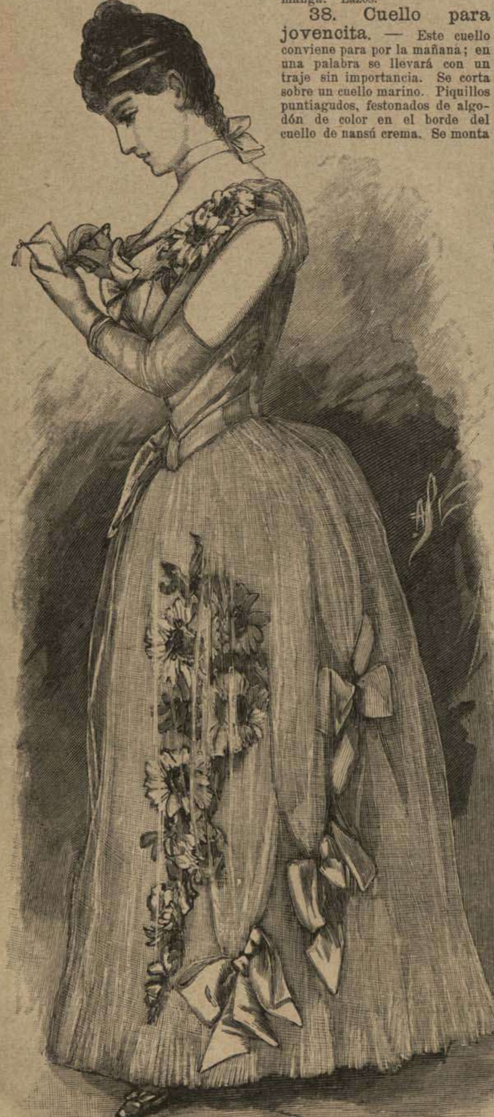
59. Traje para baile de tul.

38. Cuello para jovencita. — Este cuello conviene para por la mañana; en una palabra se llevará con un traje sin importancia. Se corta sobre un cuello marino. Piquillos puntiagudos, festonados de algodón de color en el borde del cuello de nansú crema. Se monta