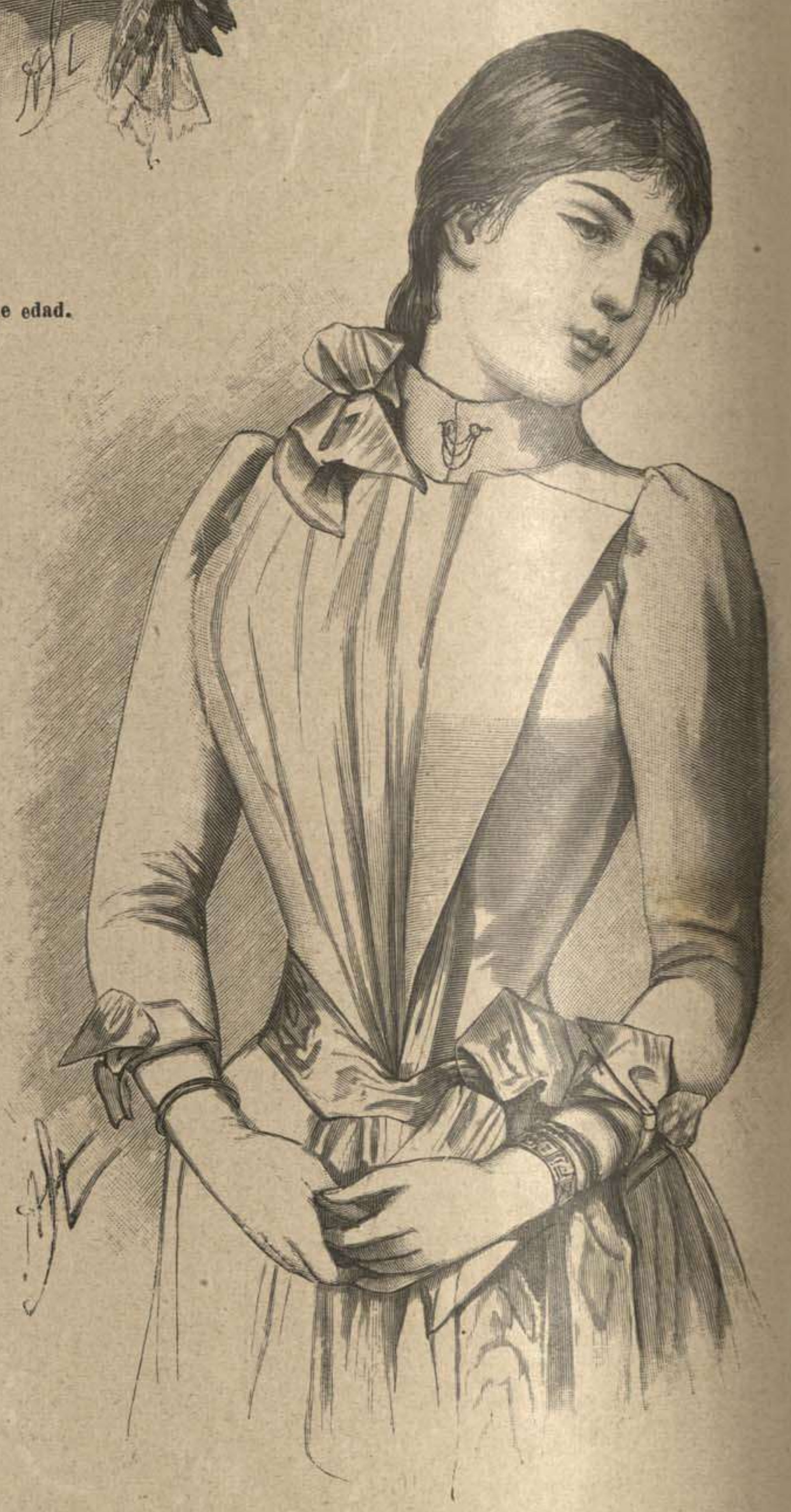
79. Corpiño plegado con solapas. Véase el vestido de primero comunión, dibujos 3 y 4. Patrón: Supl., Verso, N.º XII, fig. 50 á 54, A á M, estrella, doble punto, pliegues 1 á 3.

77. Traje para paseo con túnica en forma de gabán. — Patrón y espalda: Supl., Recto, N.º I, fig. 1 á 11, A á Z, estrella, doble punto, pliegues 1 á 3. — Este vestido es clásico para la estación. La falda esta cubierta delante, de lado y á mitad de la altura, con cheviota plegada á cuadros. Córtese la túnica sobre el patrón indicado, añádase el paño suplementario del delantero de delante y del lado al corpiño cruzando á doble hilera de botones (fig. 5 desde J hasta estrella para