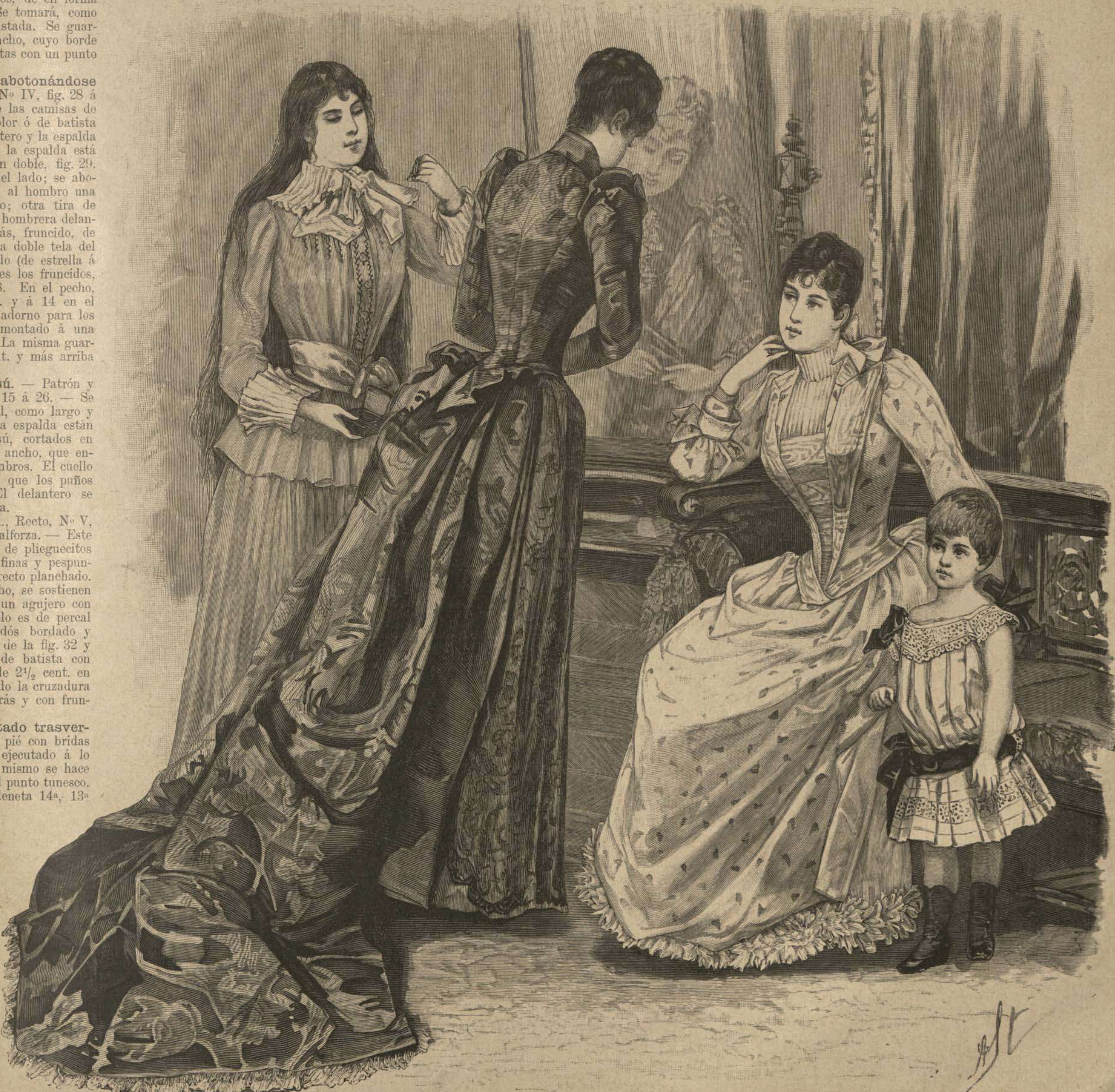
49. Mañanita con canesú plegado. Patrón y espalda: Supl., Verso, No XIII, fig. 55 á 58ª, N á U.

ejecutado trasver- por el pié con bridas icima, ejecutado á lo encaje mismo se hace como el punto tunesco. la cadenetá 14ª, 13ª no se mo se (véase ado ó a 10ª, en el en el imase, esillas é con el pi- ejecu- da en chado, a dar tiempo p. de er p. chado, la que y la ele un es pre- mego