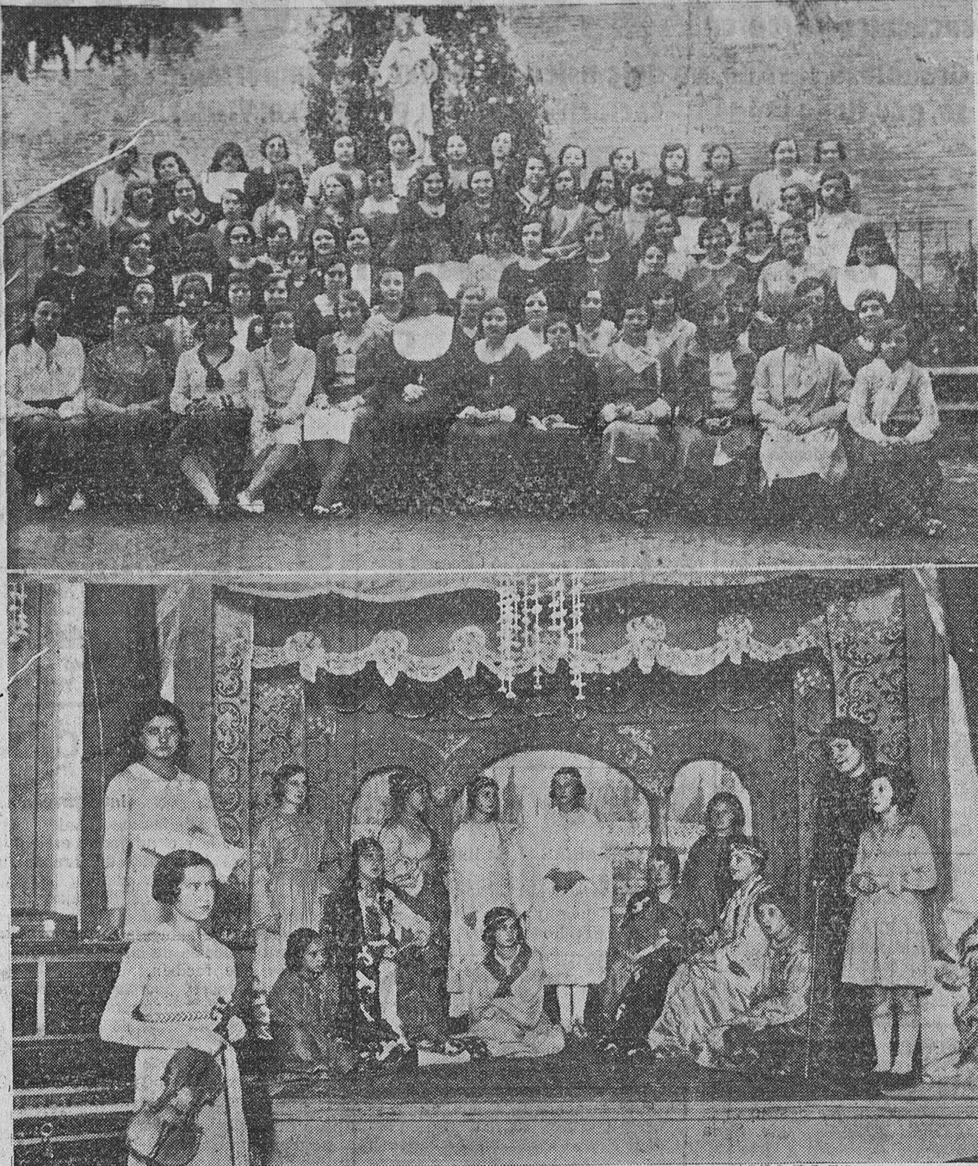
Las antiguas alumnas y la velada teatral verificada recientemente. (Fotos Ansedé y Juanes).