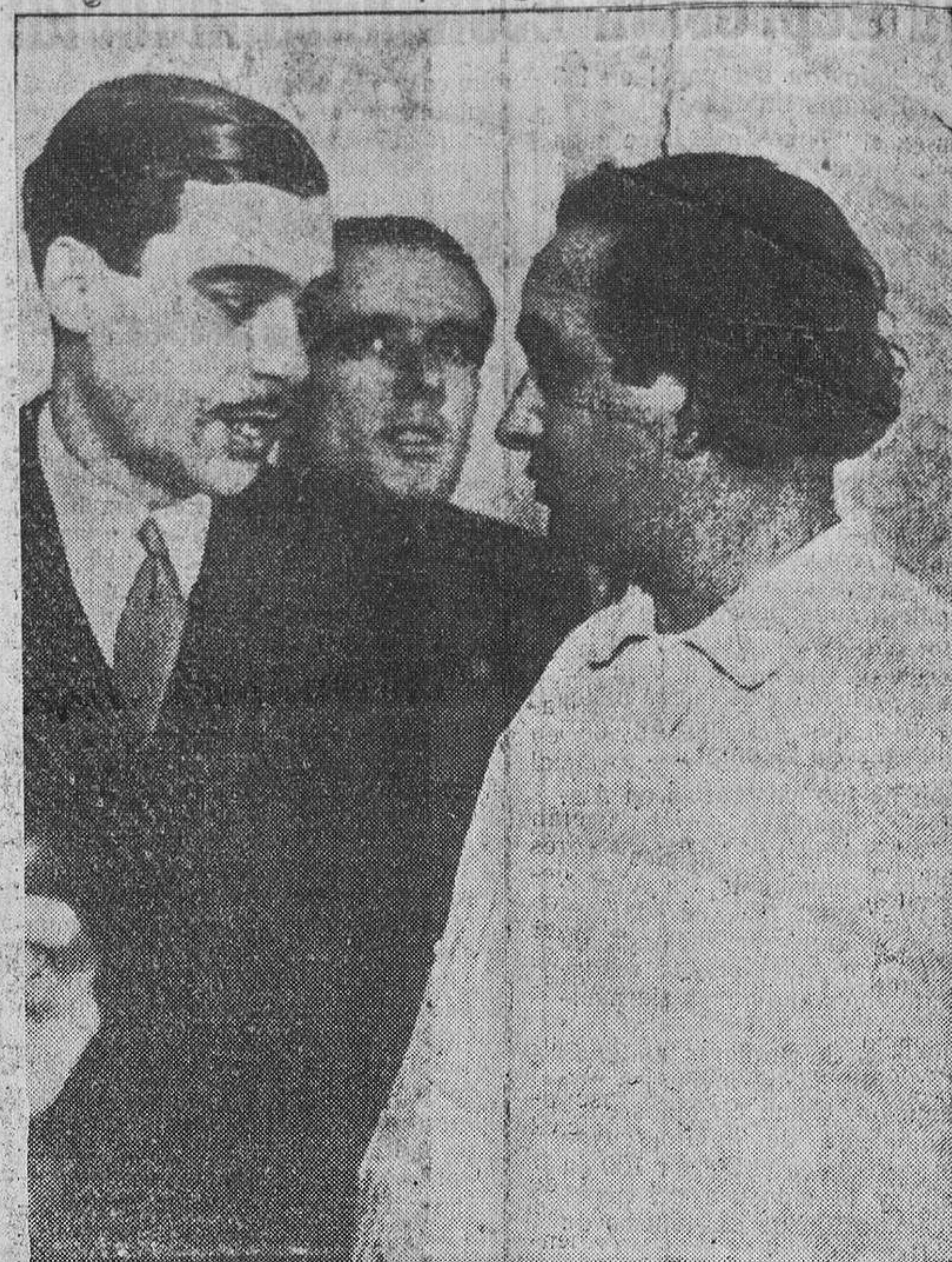
El Consejero de la Generalidad y diputado a Cortes Ventura Gassols, dando cuenta del atentado de que ha sido víctima en Madrid, en el hotel donde se hospeda, y en el que, como es sabido, intentaron cortarle la melena, habiéndole arrancado varios mechones de cabello