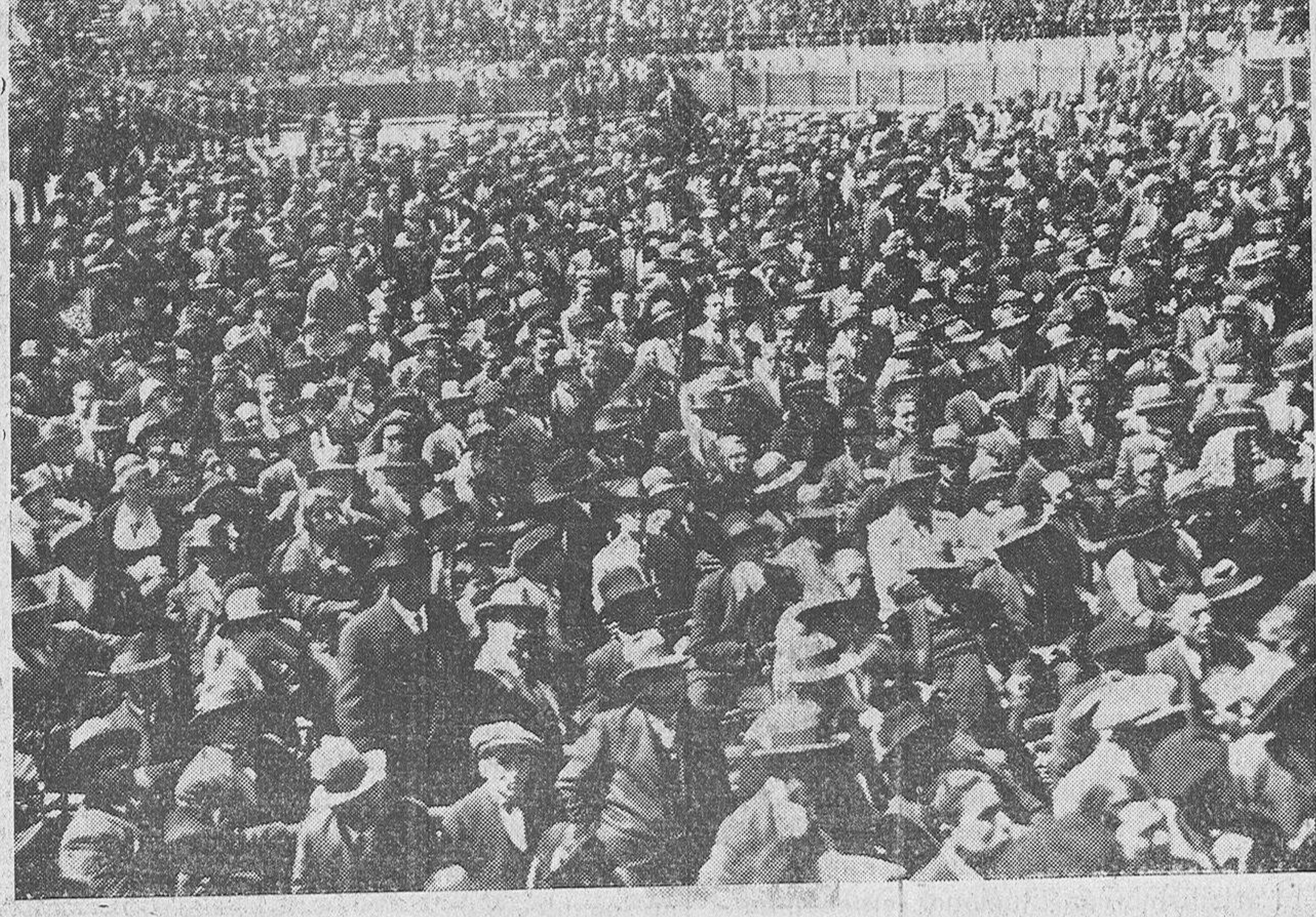
El ruedo de la Plaza de Toros, durante el mitin del domingo.

Mayores estragos, mucho mayores, ha podido producir el sectarismo, este sectarismo de dos clases: el sectarismo antirreligioso y el sectarismo político. Esos sectarismos han mediado alguna parte de la obra del Gobierno y de las Cortes, y con su parcialidad han hecho que se desviara o se mostrara hostil un sector considerable de la opinión nacional, que debería estar incondicionalmente al lado de la República.