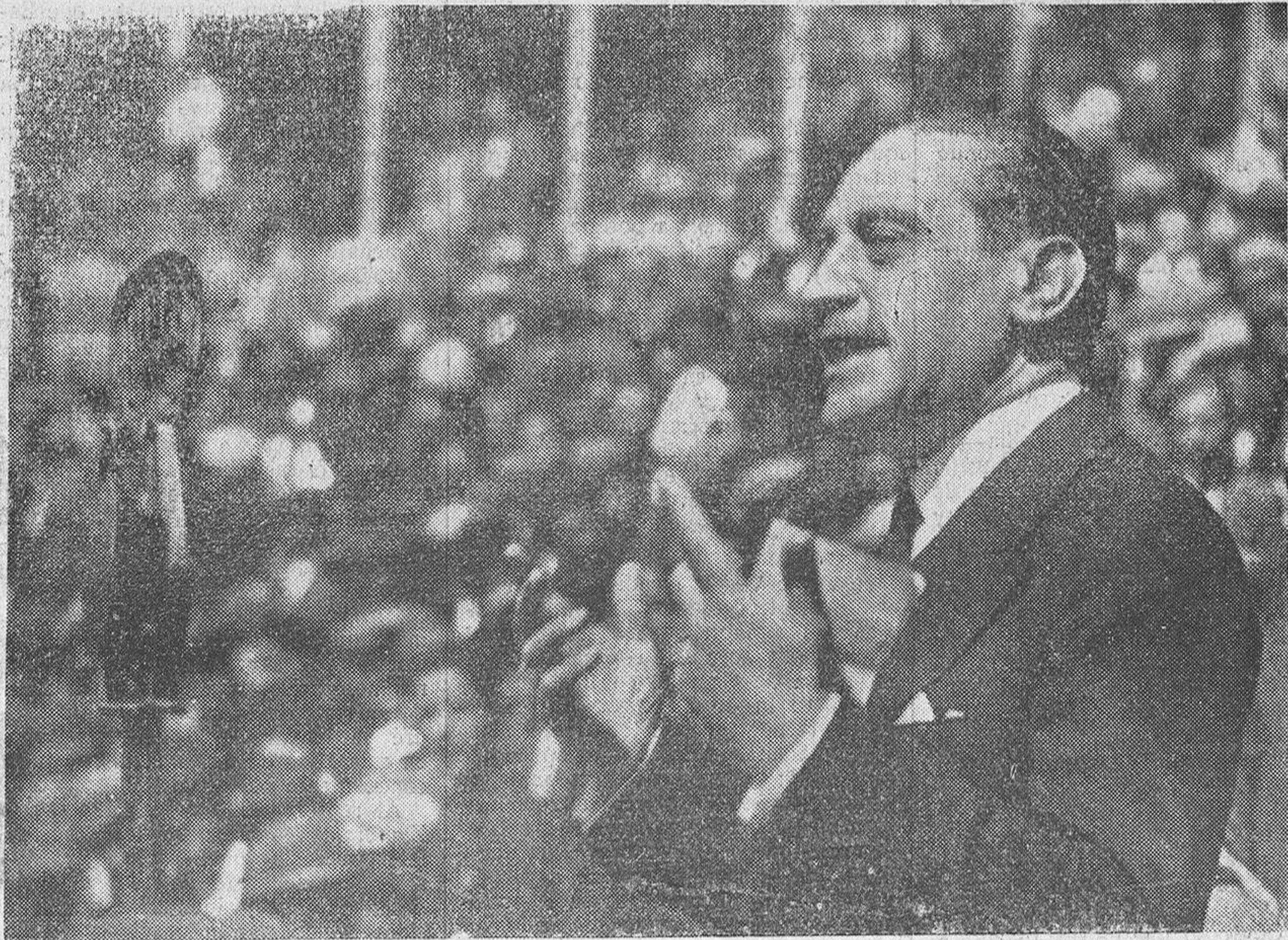
Don Miguel Maura, pronunciando su discurso