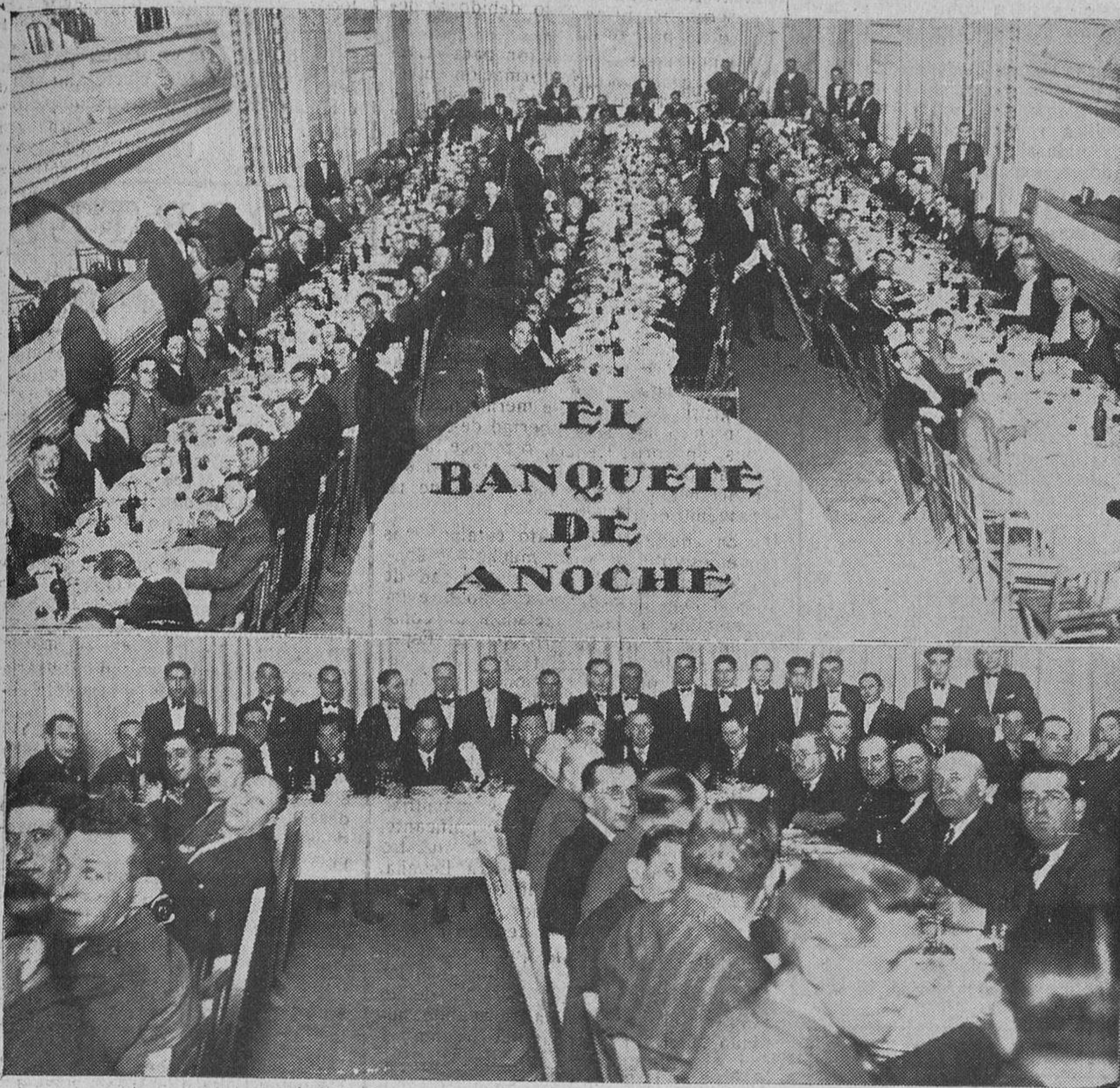
Arriba: Aspecto que ofrecía la sala del Teatro del Liceo, durante el banquete republicano de anoche. Abajo: Mesa presidencial del acto.