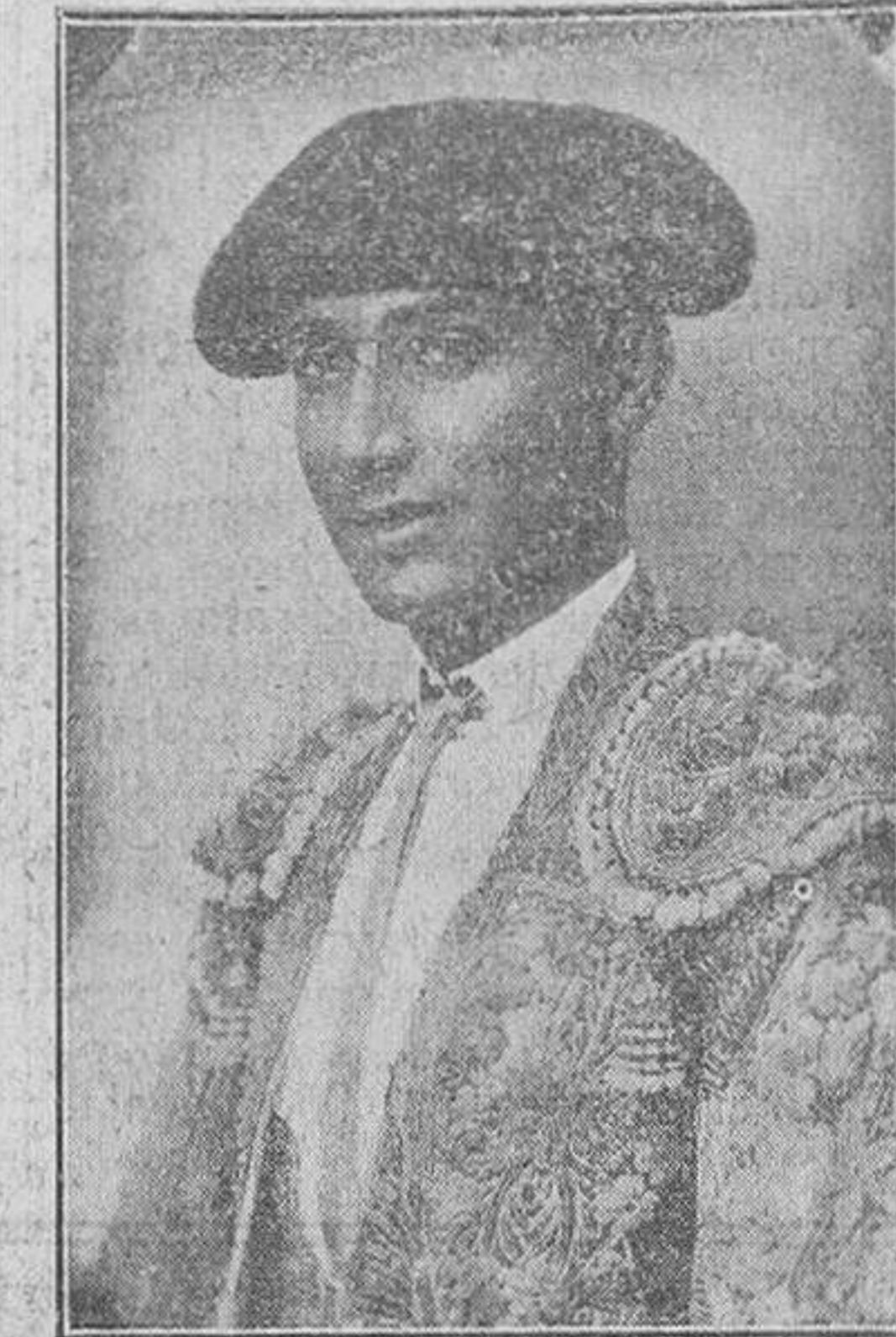
El desgraciado torero -francisco Vega de los Reyes (Gitanillo de Triana)

El estado general del torero, con todas estas complicaciones, era cada vez más precario, con fiebre persistente, que se exacerbaba en cada una de estas recaídas, sin conseguir en los intervalos que desapareciera. La alimentación era defectuosa, y la posición en