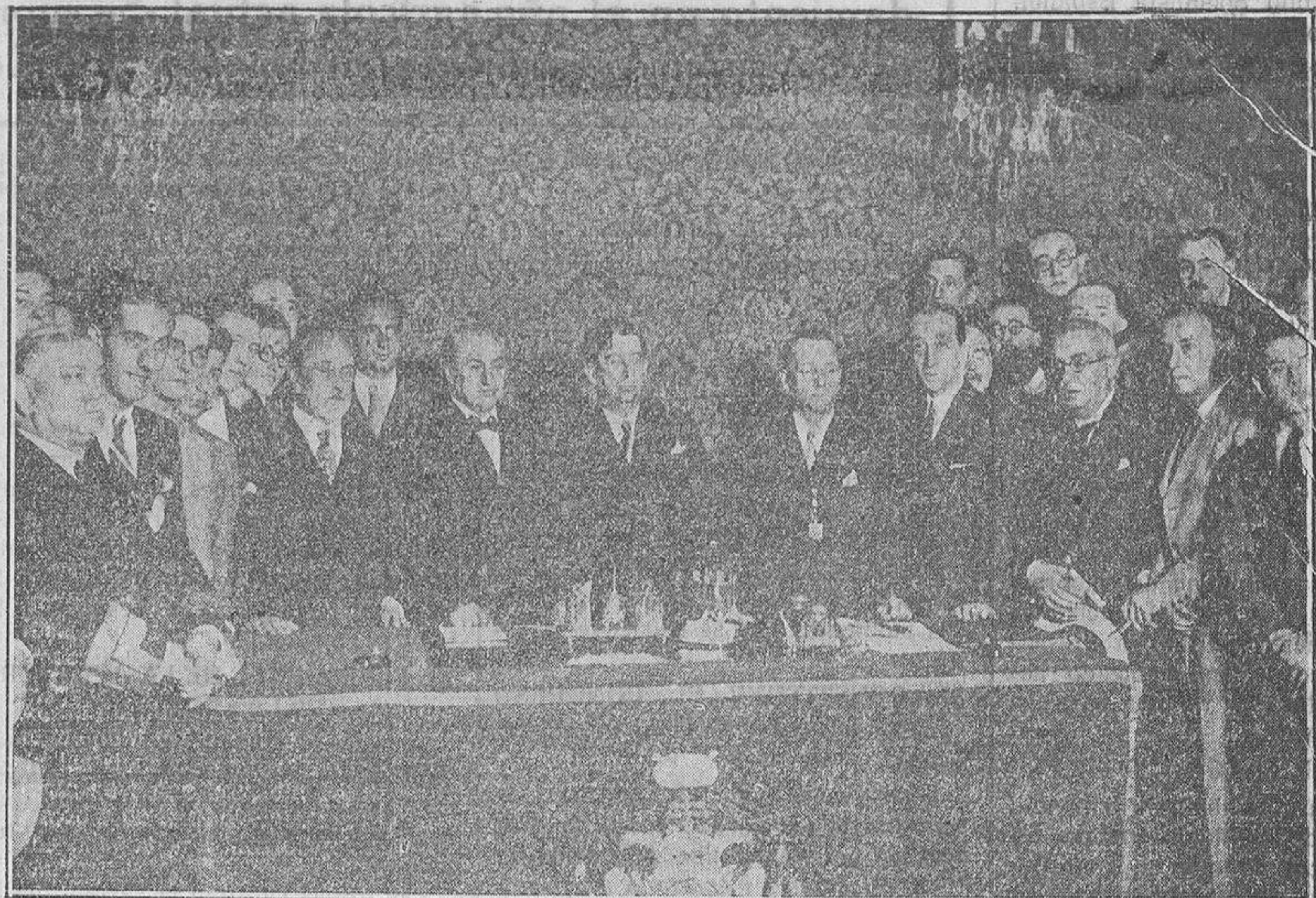
El ministro de Instrucción Pública, don Marcelino Domingo, presidiendo el acto de la toma de posesión del cargo de Rector de la Universidad Central del catedrático don José Giral

—Los estudiantes esperan fundamentalmente la solución de esos pequeños problemas de asistencia social de la Universidad, tales como comedores universitarios, campamentos de vacaciones, salas de permanencia en la Universidad, etc., etcétera. ¿Cree usted que habrá dificultad en ello?