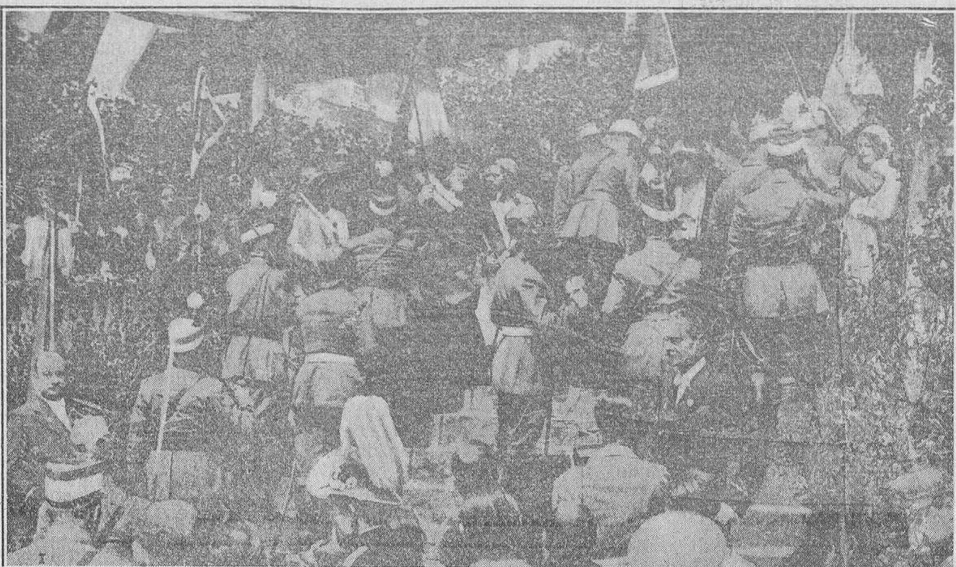
Entrega, con toda solemnidad, de las banderas republicanas a los Cuerpos de la guarnición de Barcelona, fiesta celebrada el domingo último, a la que asistió la inmensa mayoría del pueblo catalán