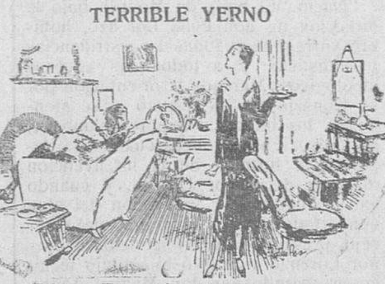
TERRIBLE YERNO Ella.—¿Eres tú el que has puesto mirando a la pared el retrato de mamá? El.—¿Que? ¿Ha mordido el pap...?