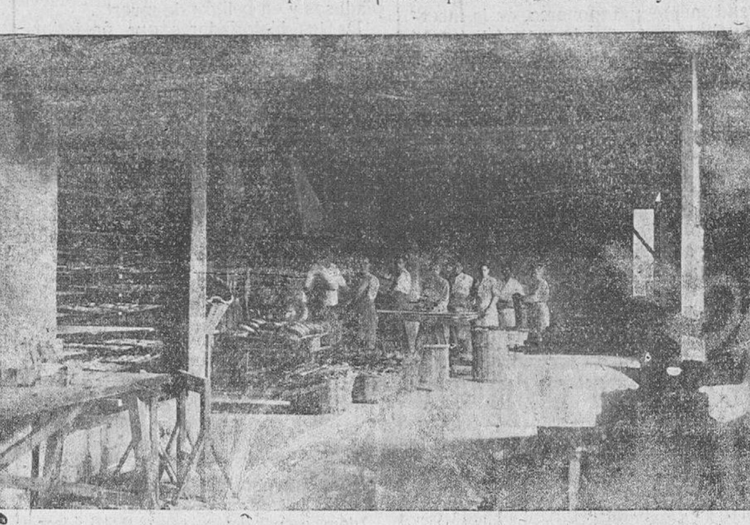
Interior de la fábrica de pan “El Carmelo”

celente, exquisito, pan y bollería de lujo.