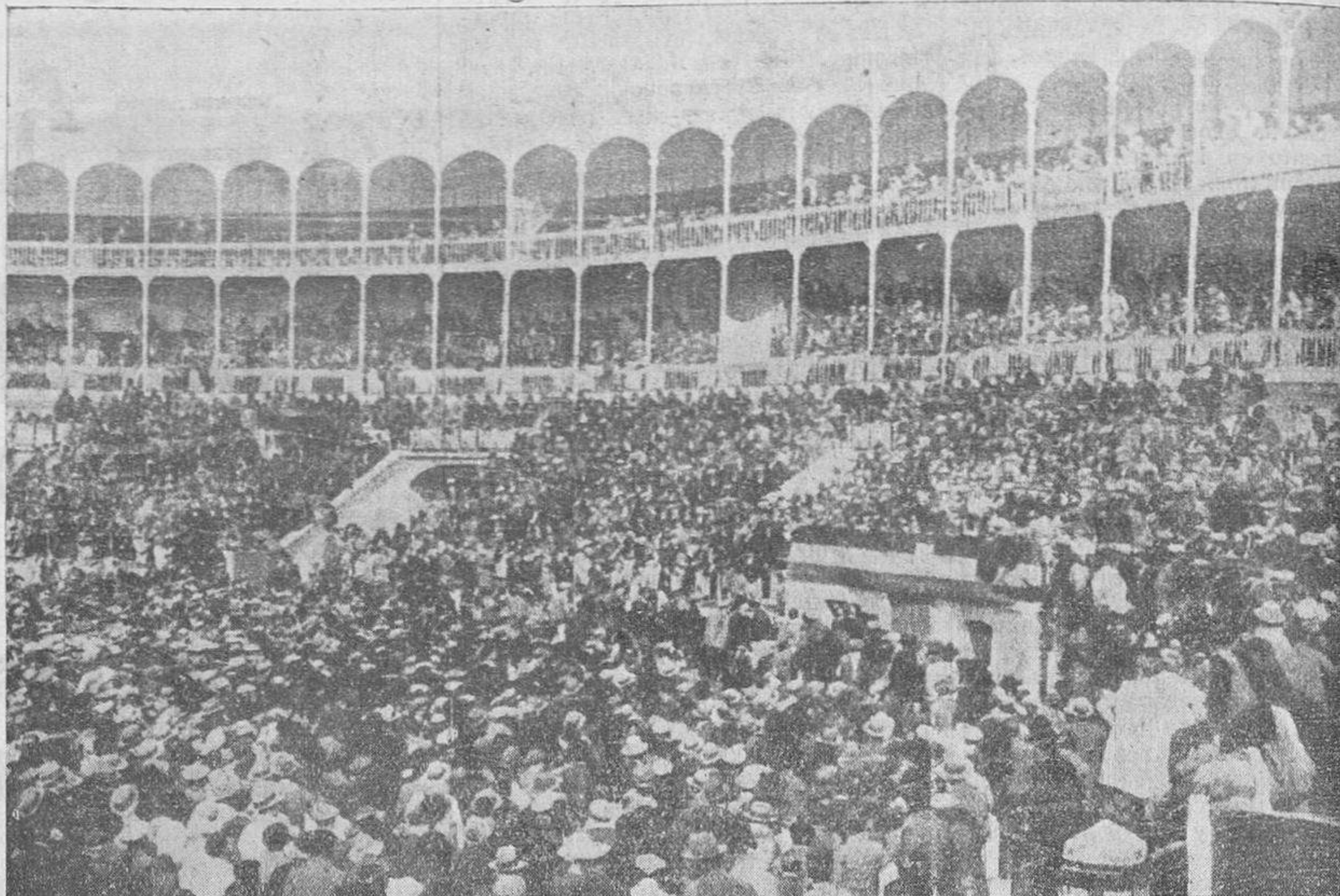
Vista de la Plaza de Toros durante la Asamblea celebrada el domingo, con asistencia de representantes de todos los pueblos de la región castellano-leonesa.