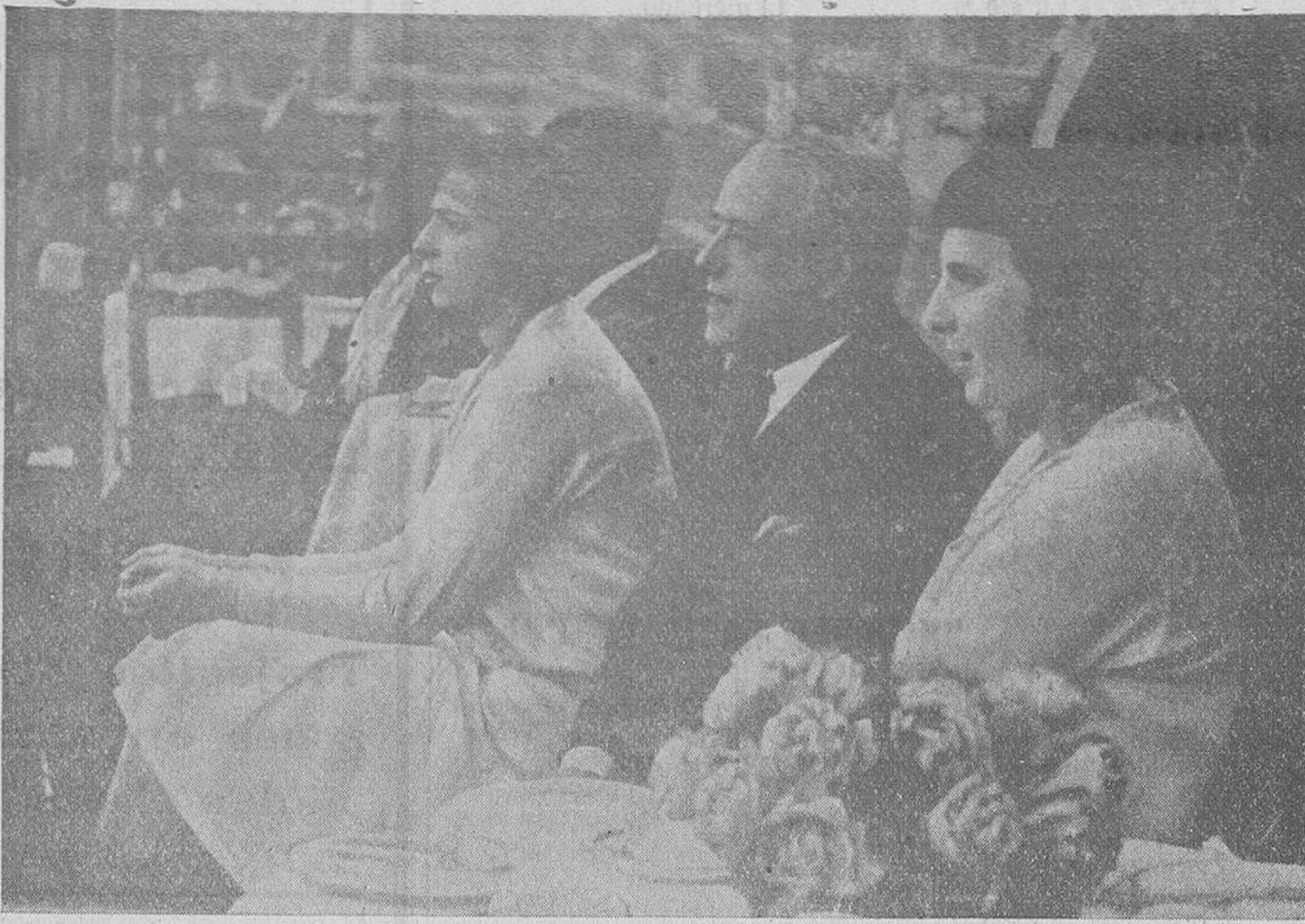
Sus Altezas Reales las infantas doña Beatriz y doña Cristina, presenciando las finales del Campeonato de España de Tennis, en el Turó, de Barcelona