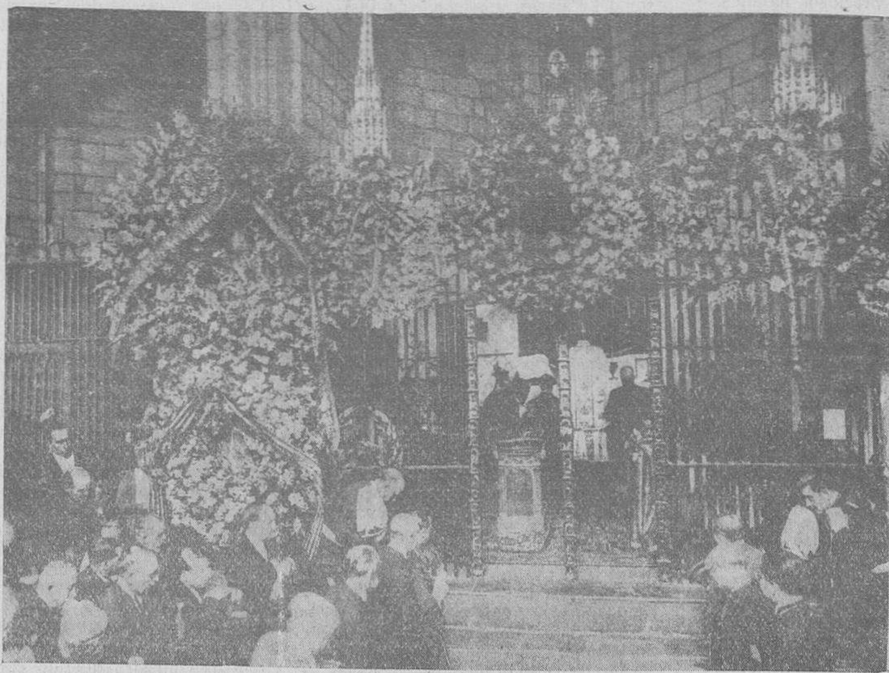
Misa celebrada a la memoria de los mártires de la Independencia, celebrada bajo la presidencia del infante don Jaime, en la Catedral de Lérida