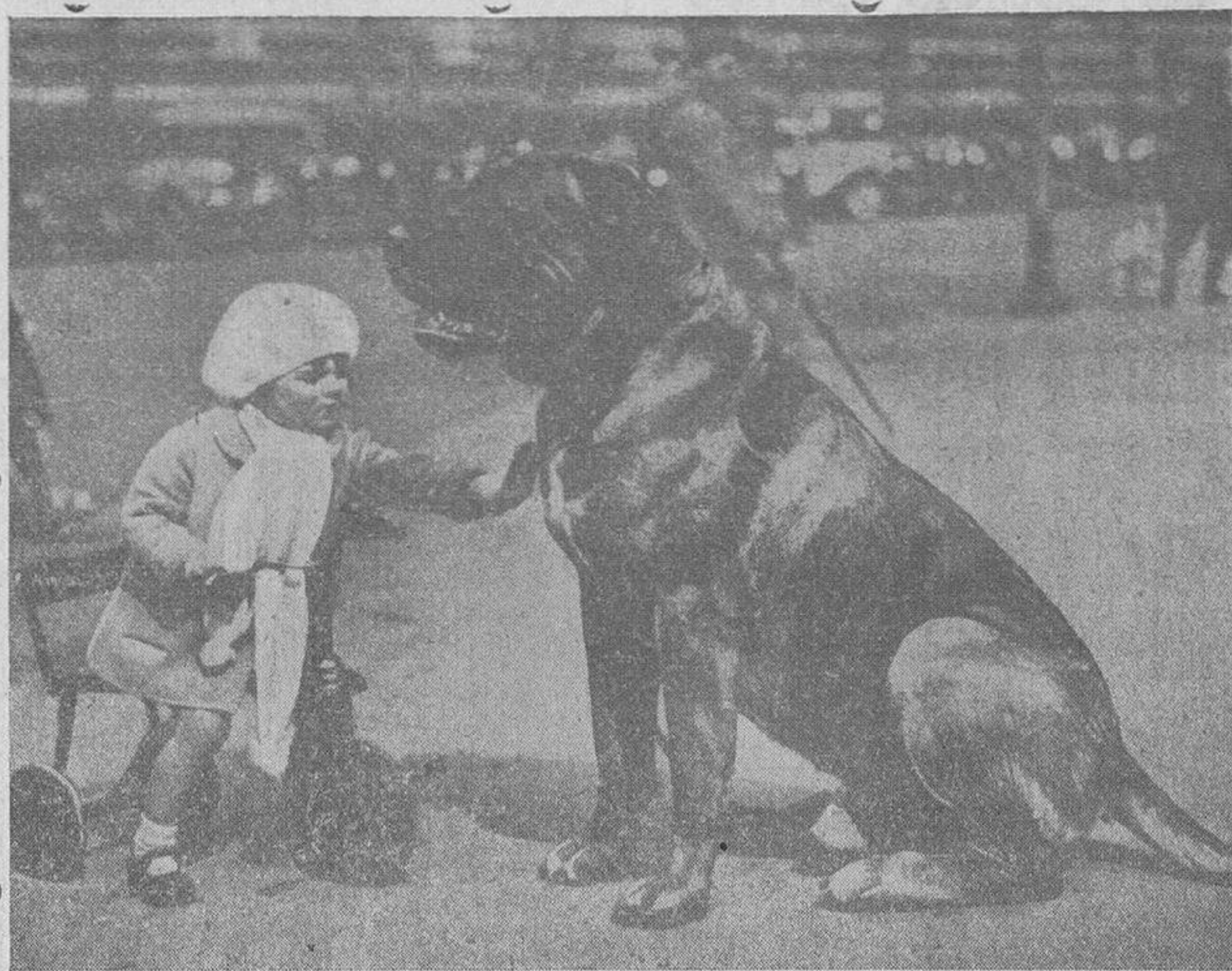
Los buenos amigos en la Exposición Canina celebrada últimamente en el Palacio de Cristal, de Londres