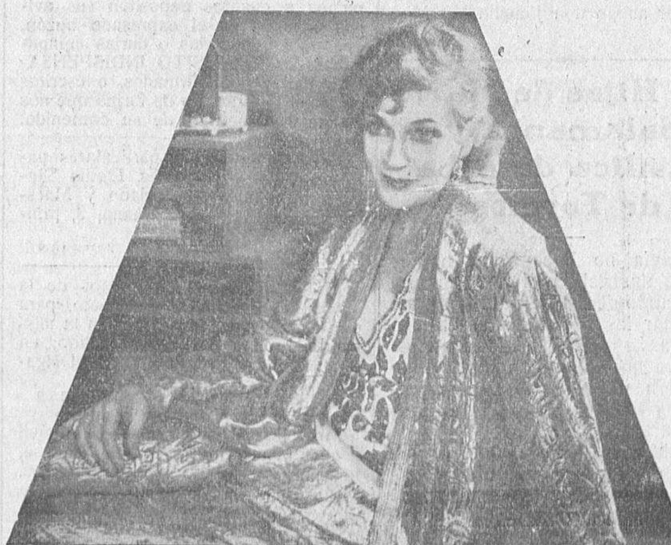
Esther Ralston, una de las artistas más famosas de la Paramount