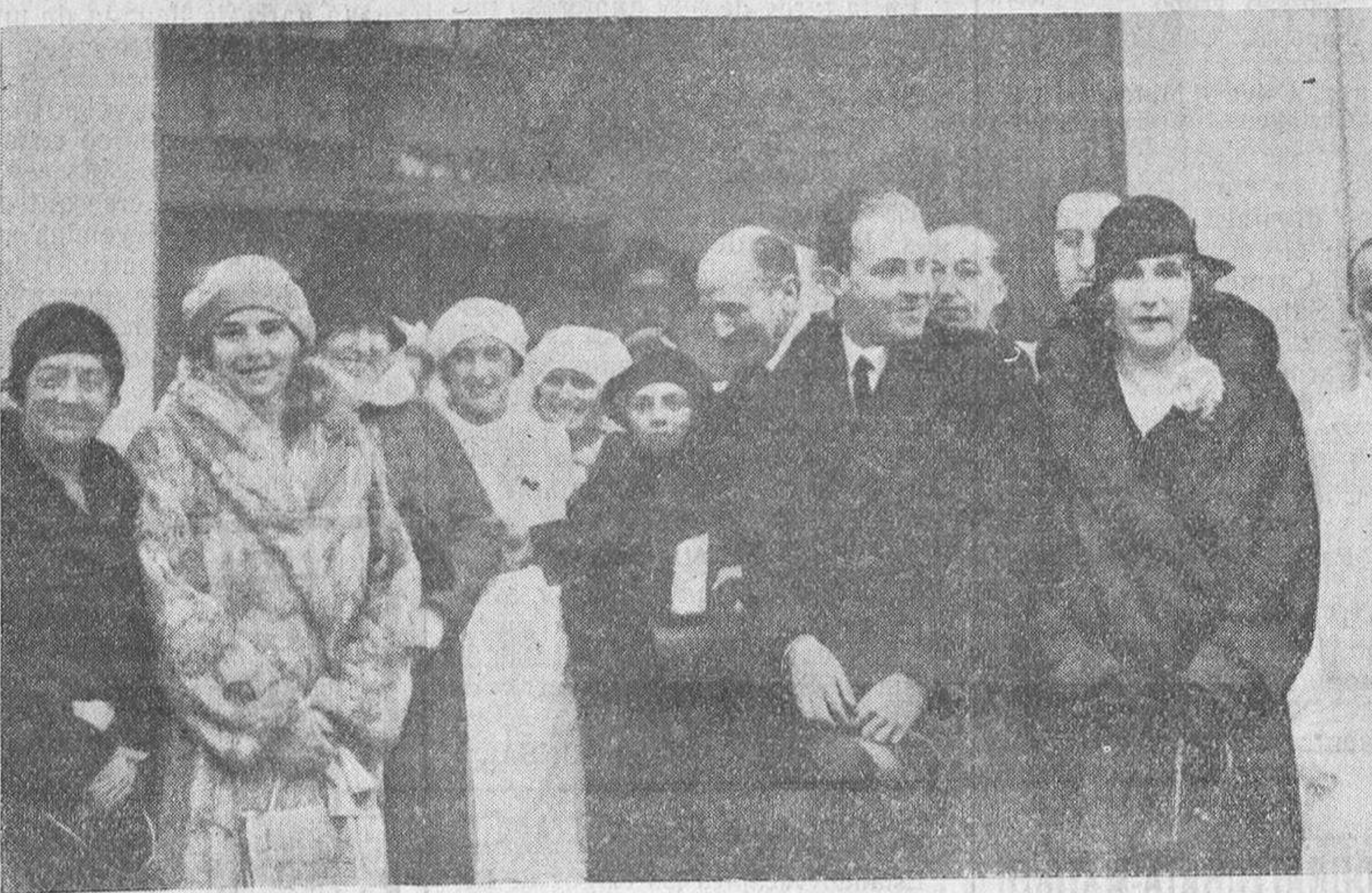
Su majestad la Reina, con el príncipe de Asturias y la infanta Beatriz, saliendo del Hospital de San José y Santa Adela, de presidir una conferencia médica