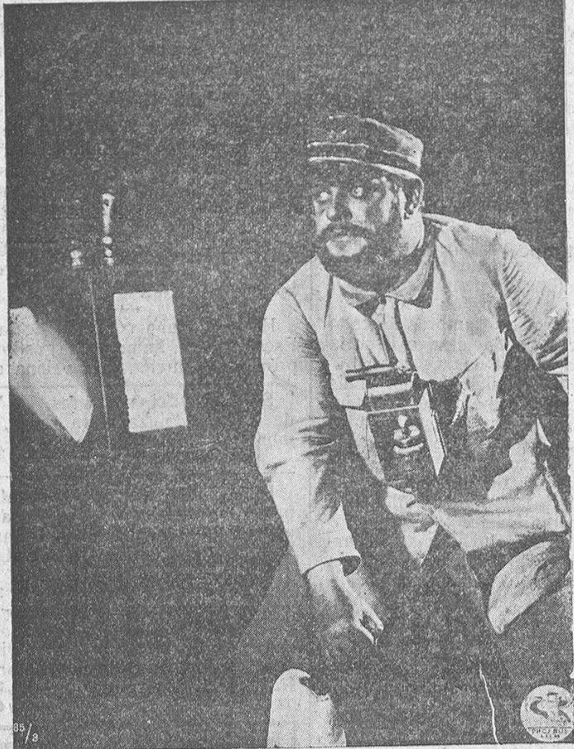
Una interesante escena de la gran super-producción "Oriente Expres"