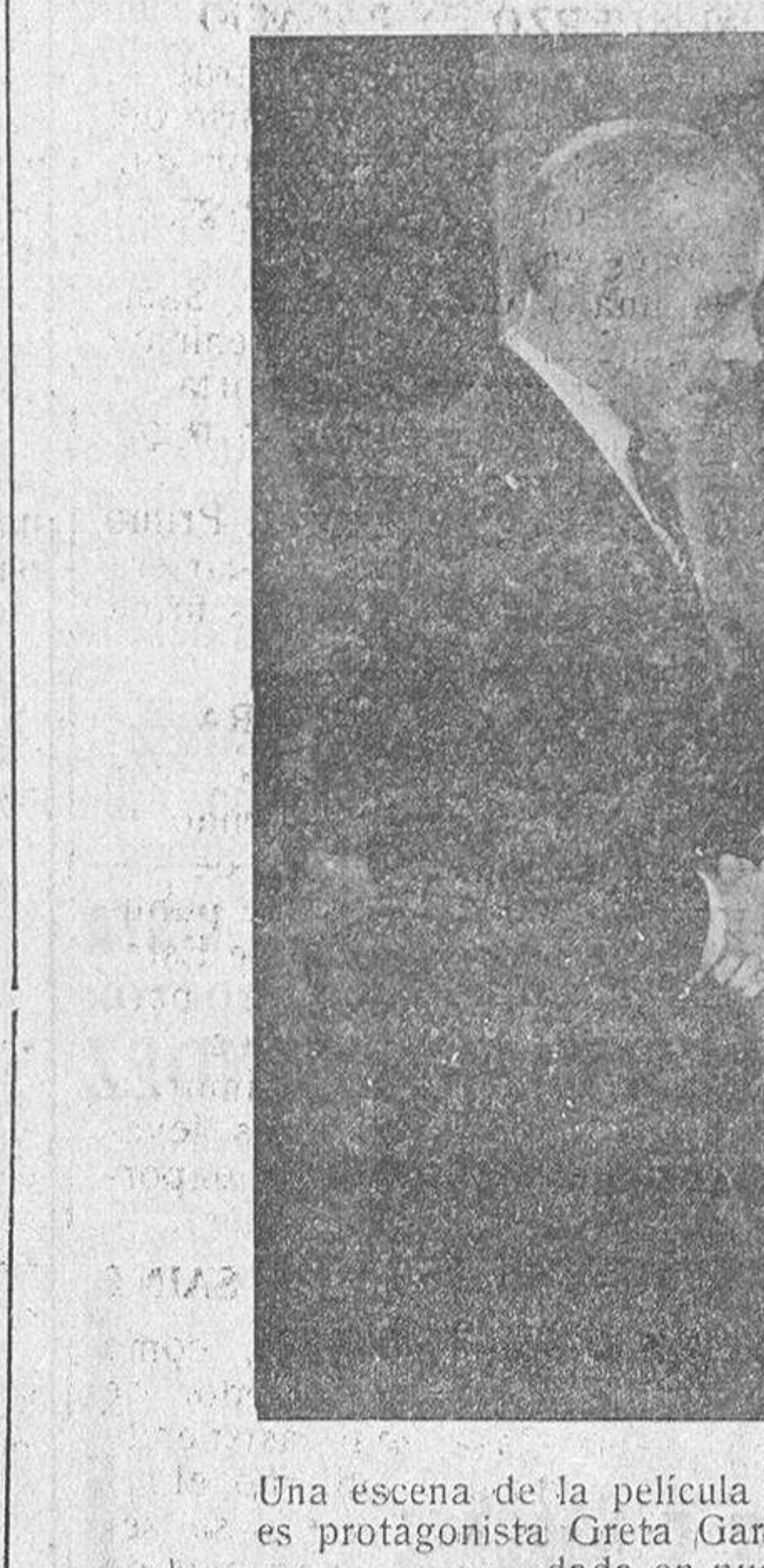
Una escena de la película "La mujer ligera", de la que es protagonista Greta Garbo, y que en breve será rodada en nuestros coliseos