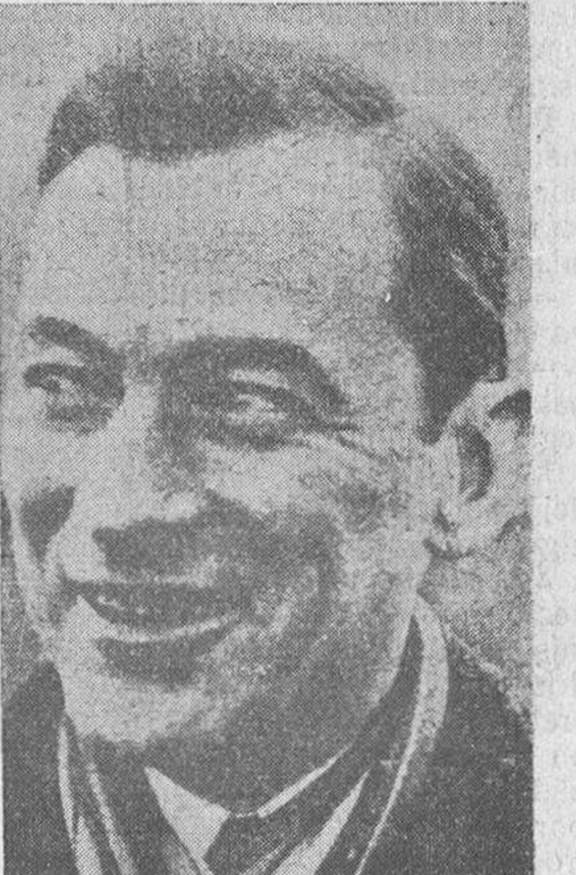
Mr. Jimmy Walker, alcalde de Nueva York, a quien se ha concedido la encomienda de Isabel la Católica por el brillante recibimiento que dispensó aquella ciudad al buque escuela español "Juan Sebastián Elcano", en el año 1929. Nuestro embajador en los Estados Unidos le ha impuesto, en nombre del Gobierno, las insignias, cuyo acto ha sido bien acogido en Nueva York