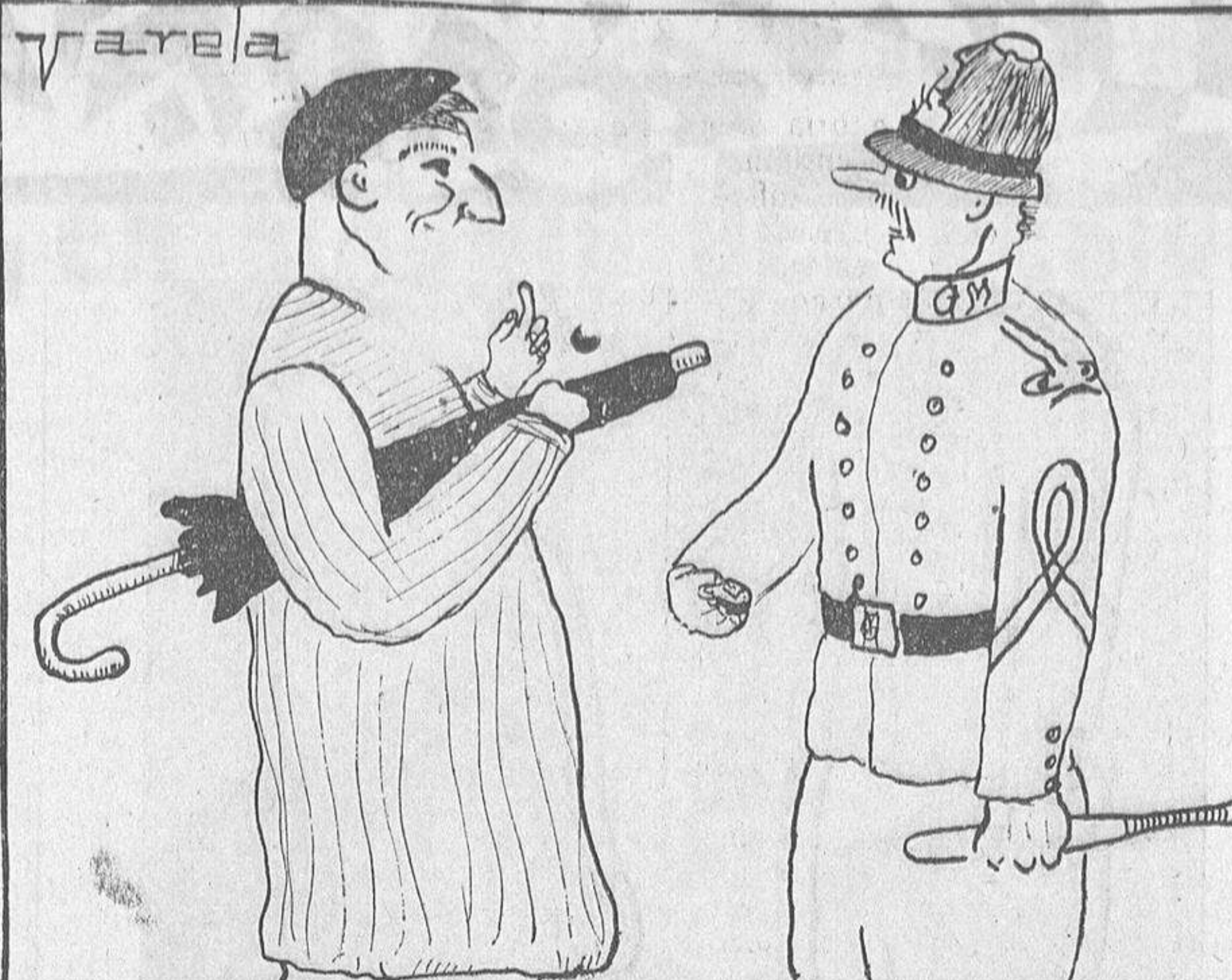
—¿Qué hora es, guardia? —Las cuatro y cinco. —¿Cuatro y cinco? Las nueve entonces. ¿Crear te has hecho que no sabías sumar?

POZO AMARILLO, 7, segundo; entrada por Ruiz Aguilera, 7 (calleja de Terminus).