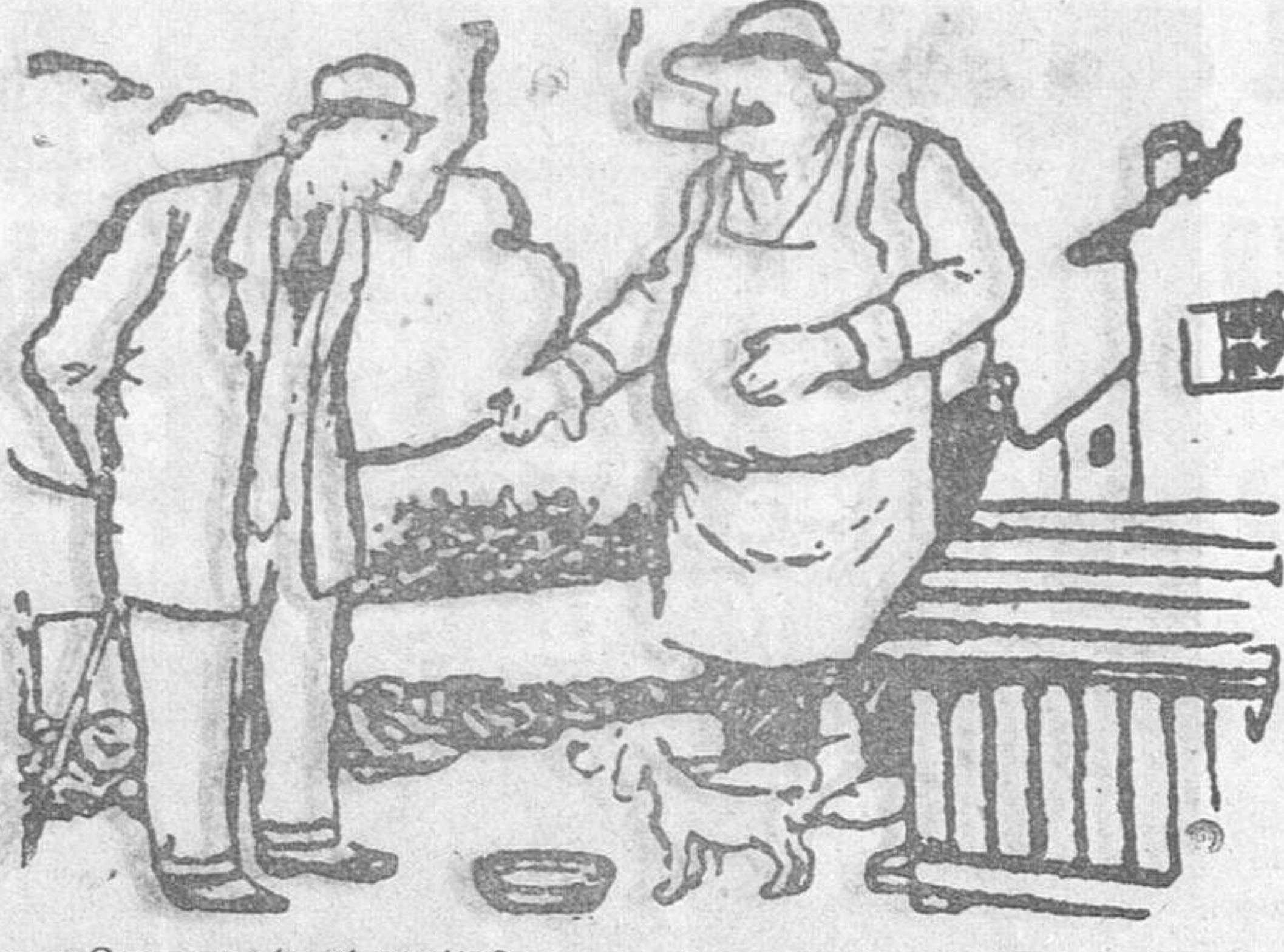
¿Come mucho el perrito? Muy poco. Mire, hace un momento mordió en la pantorrilla al cartero y ya no tomará nada hasta mañana.