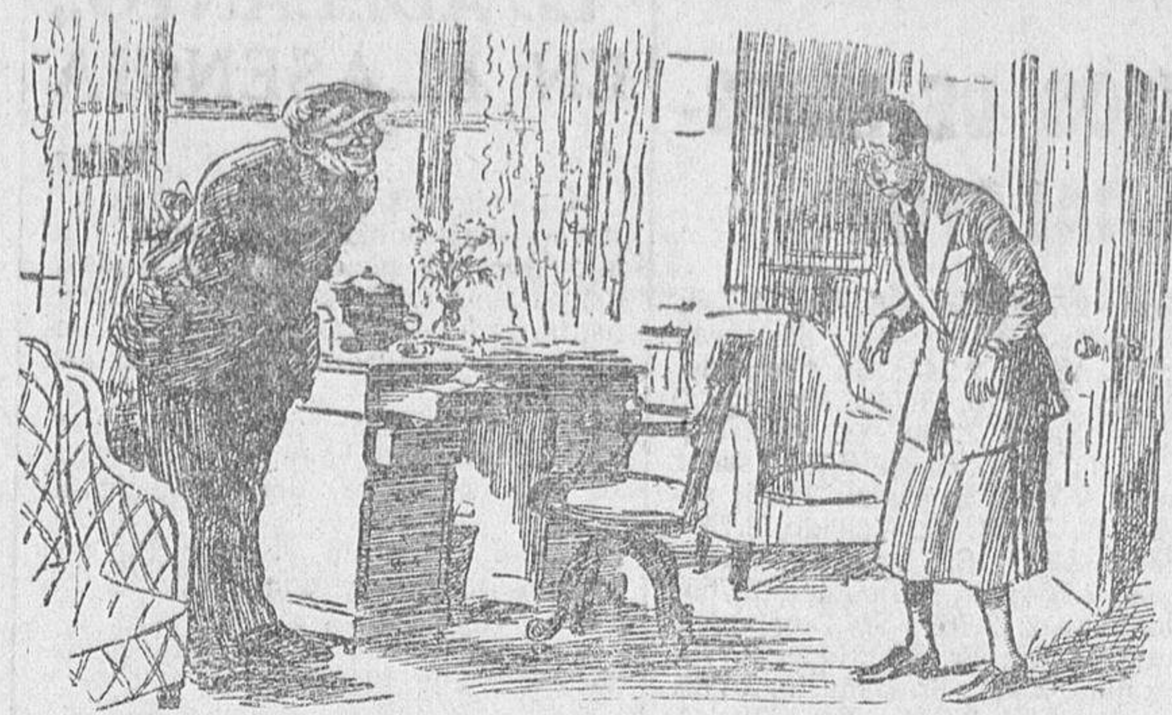
La señora, al sorprender en su casa al ladrón: —¿Qué hace usted aquí? —No es el hombre que vi el otro día en la cárcel? —Sí, señora. He venido a devolverle la visita.