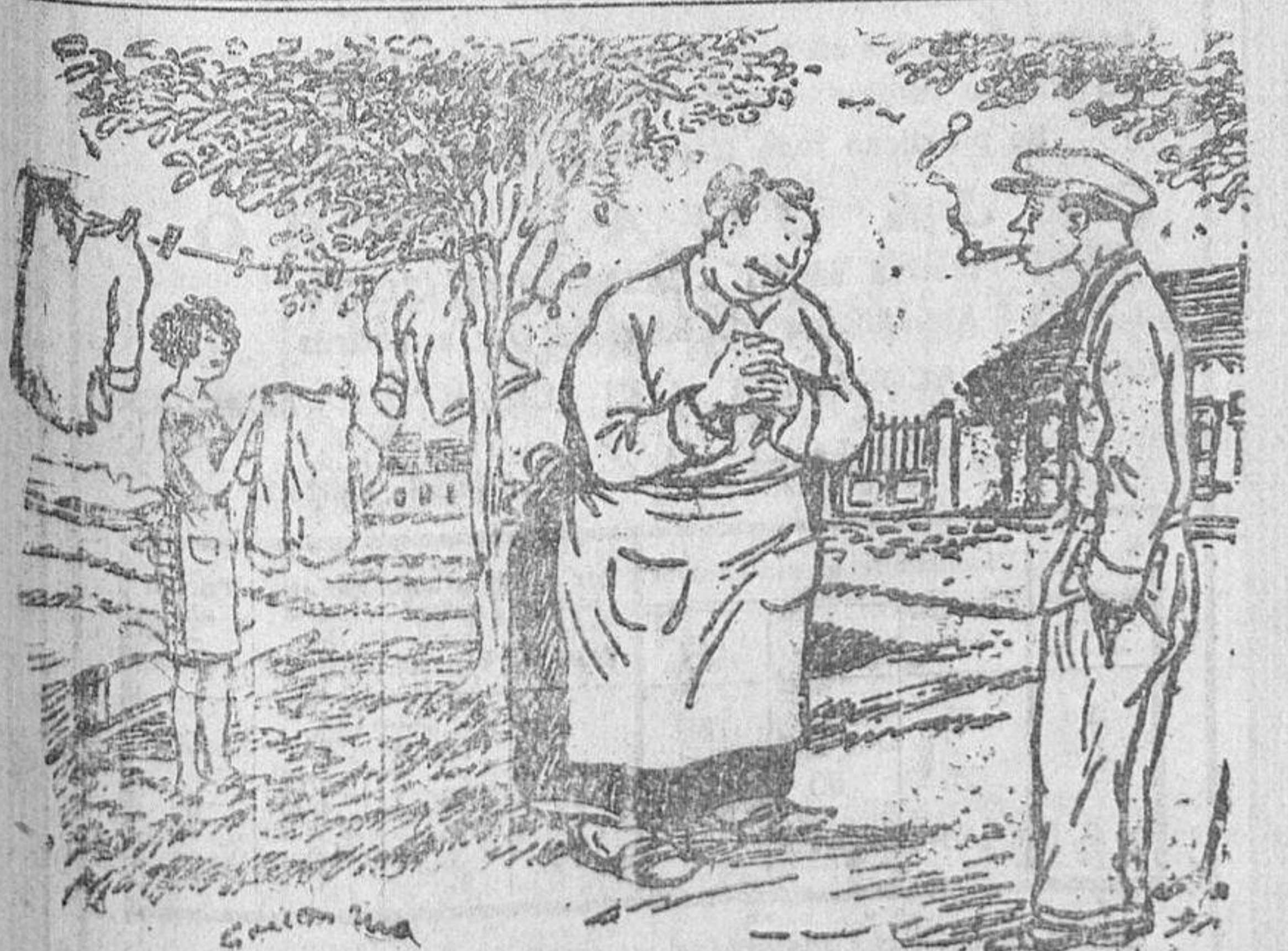
LA NUEVA COCINERA

Toda la correspondencia de EL ADELANTO se dirigirá al APARTADO DE CORREOS, NUM. 10