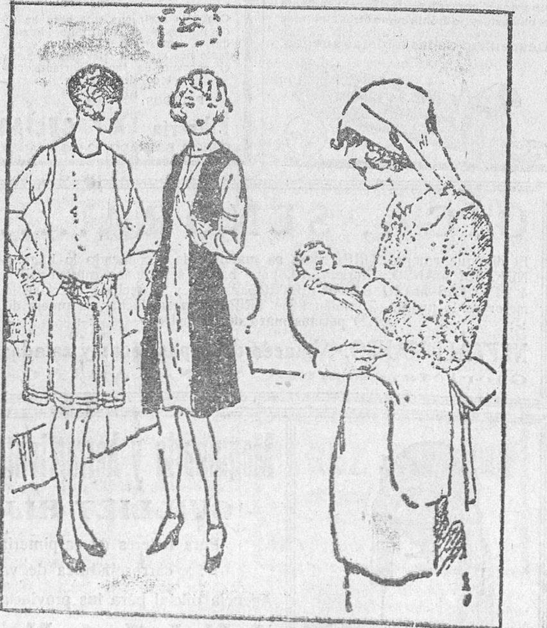
RECTIFICACION... OBLIGADA —¿De quién es esta criatura tan feúcha? —Es mi hijita. —¡Caramba, qué nena más preciosa!

La Unión Carbonera. Esta noche, a las ocho, y en su domicilio social, Cámara de Comercio, se reúnen en junta general ordinaria, los industriales que pertenecen a esta entidad. La directiva ruega a todos los afiliados asistan con puntualidad a esta sesión, en la que se tratarán asuntos de gran interés para los mismos.