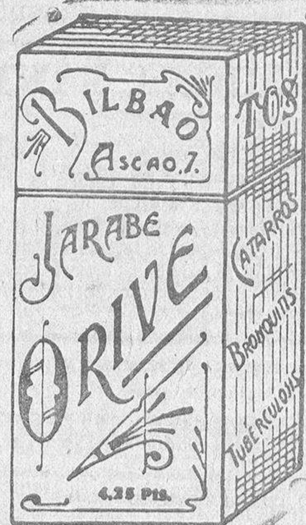
El mejor remedio para el peor catarro Jarabe Orive. Precio, 4,25 pesetas.