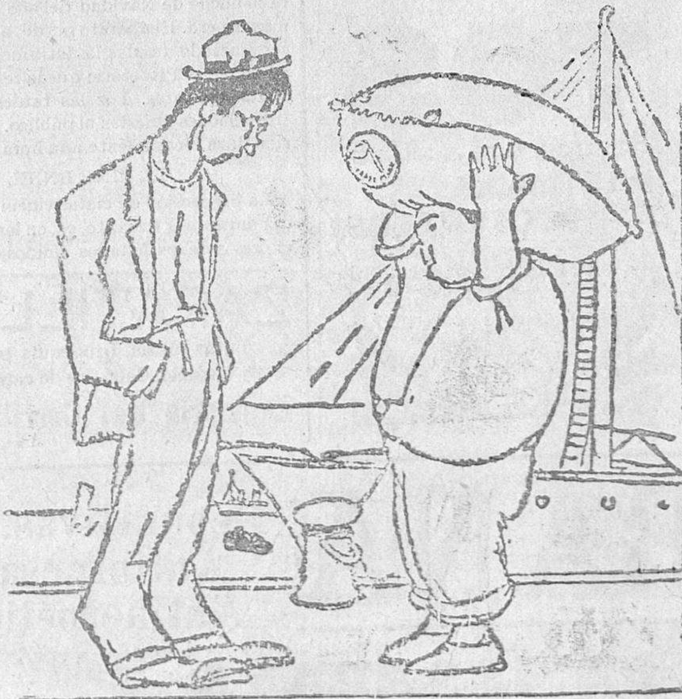
—Creo que eres una verdadera especialidad cargando sacos. ¿Y cómo ganas tan poco jornal? —Chico, estos trabajos de cabeza están muy mal retribuidos.

Se acordó, a fin de reforzar los elementos con que ahora cuenta el Ayuntamiento, con el objeto de empezar a trabajar cuanto antes en este respecto, pedir a la Dirección general de Sanidad el envío a título de préstamo, del material de desinfección que pueda facilitar el parque central de Sanidad.