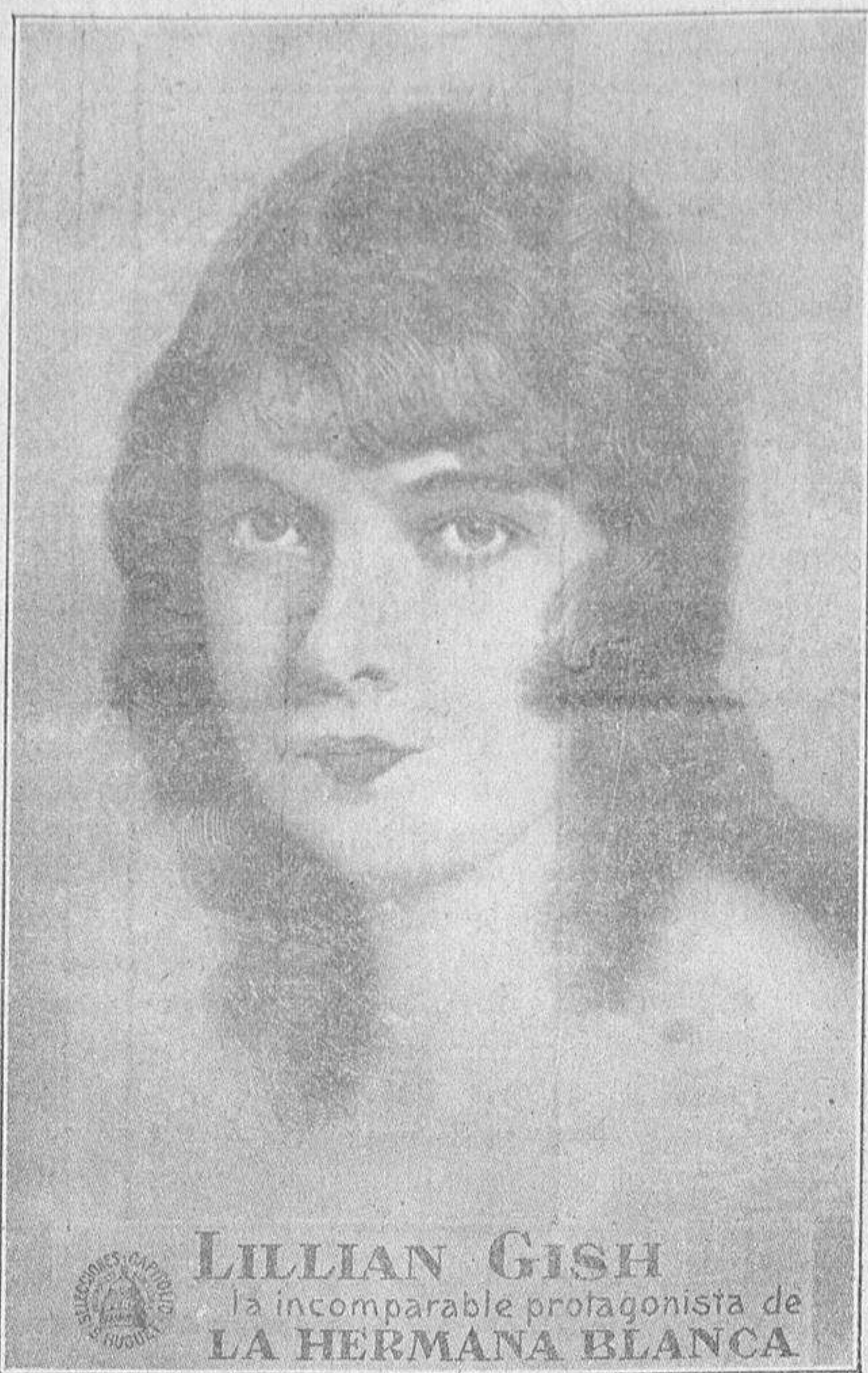
PELICULA QUE SE ESTRENA HOY EN EL TEATRO LICEO