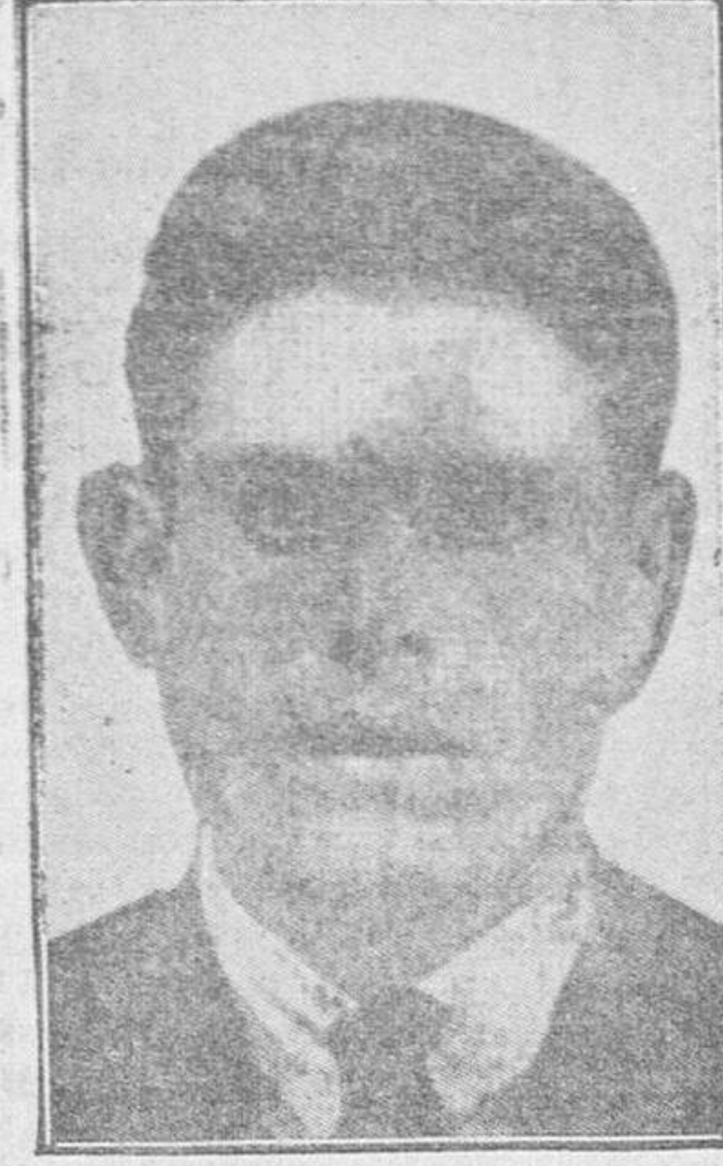
Buenaventura Durruti Domínguez (a) el Gorila, el famoso pistolero, considerado autor de numerosos atracos y atentados y cómplice de Ascaso en el complot contra el Rey

Hemos trabajado sin cesar en la construcción de casas y carreteras, hemos arrastrado cañones de un lado a otro, no hemos comido, hemos padecido hambres, enfermedades, han muerto muchos sufrimos todas vejaciones y castigos... ¿Qué más puedo decir del cautiverio?