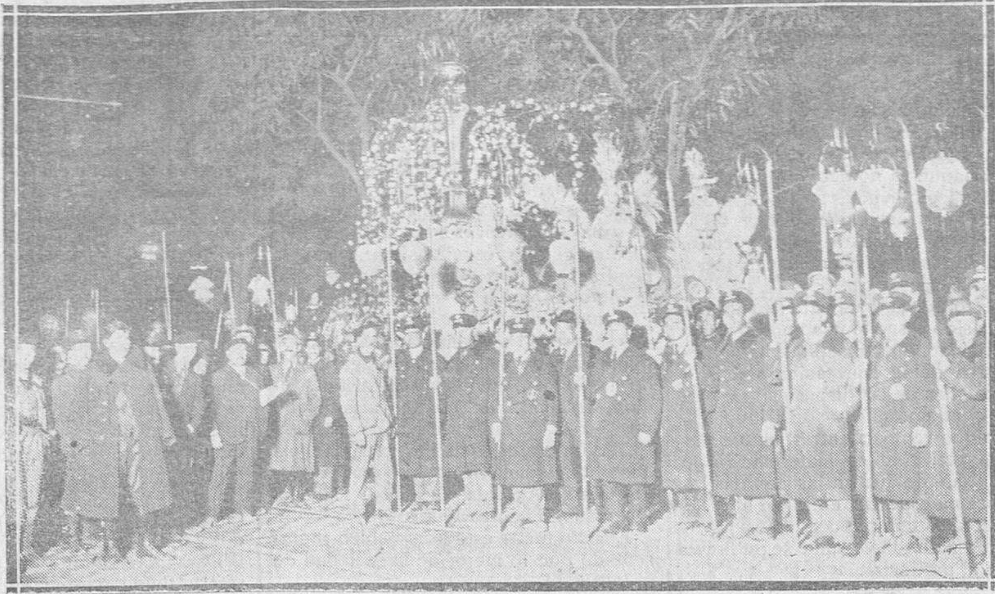
Carroza de la Sociedad de Autobuses, que figuró en la retreta celebrada con motivo del final de las fiestas y que llamó poderosamente la atención.