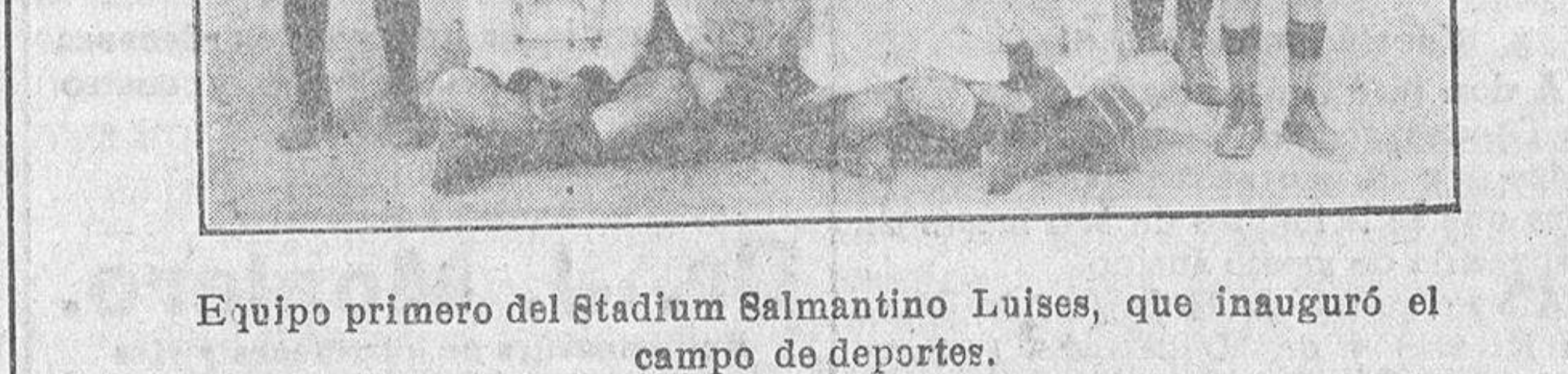
Equipo primero del Stadium Salmantino Luises, que inauguró el campo de deportes.

Una grave afección que se constituyó en crónica, le obligó a dejar el establecimiento, imposibilitándole para el trabajo, y desde entonces, su situación económica se hizo bastante precaria, agravándose con la prosecución de la dolencia, hasta el punto de que desde el primer momento nos damos cuenta de que para los A va a ser una tarde fatal, la falta de Sanohez y Polo ya se nota, aparte