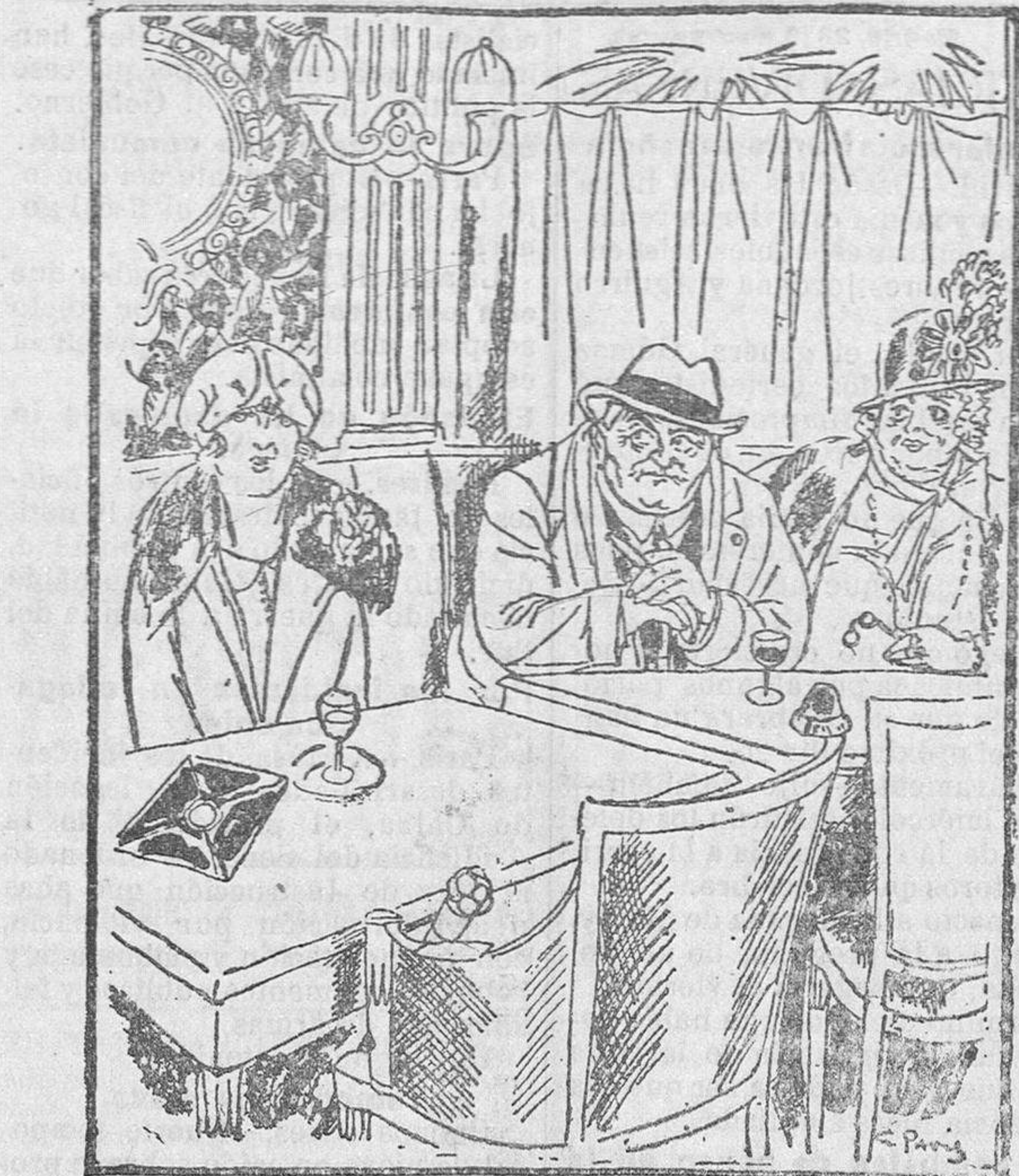
La señora.—¿Qué esperará esa muchachita...? El marido.—Que tú te vayas...

Esmerados servicios por señores y a la carta. Se sirven bodas y banquetes.