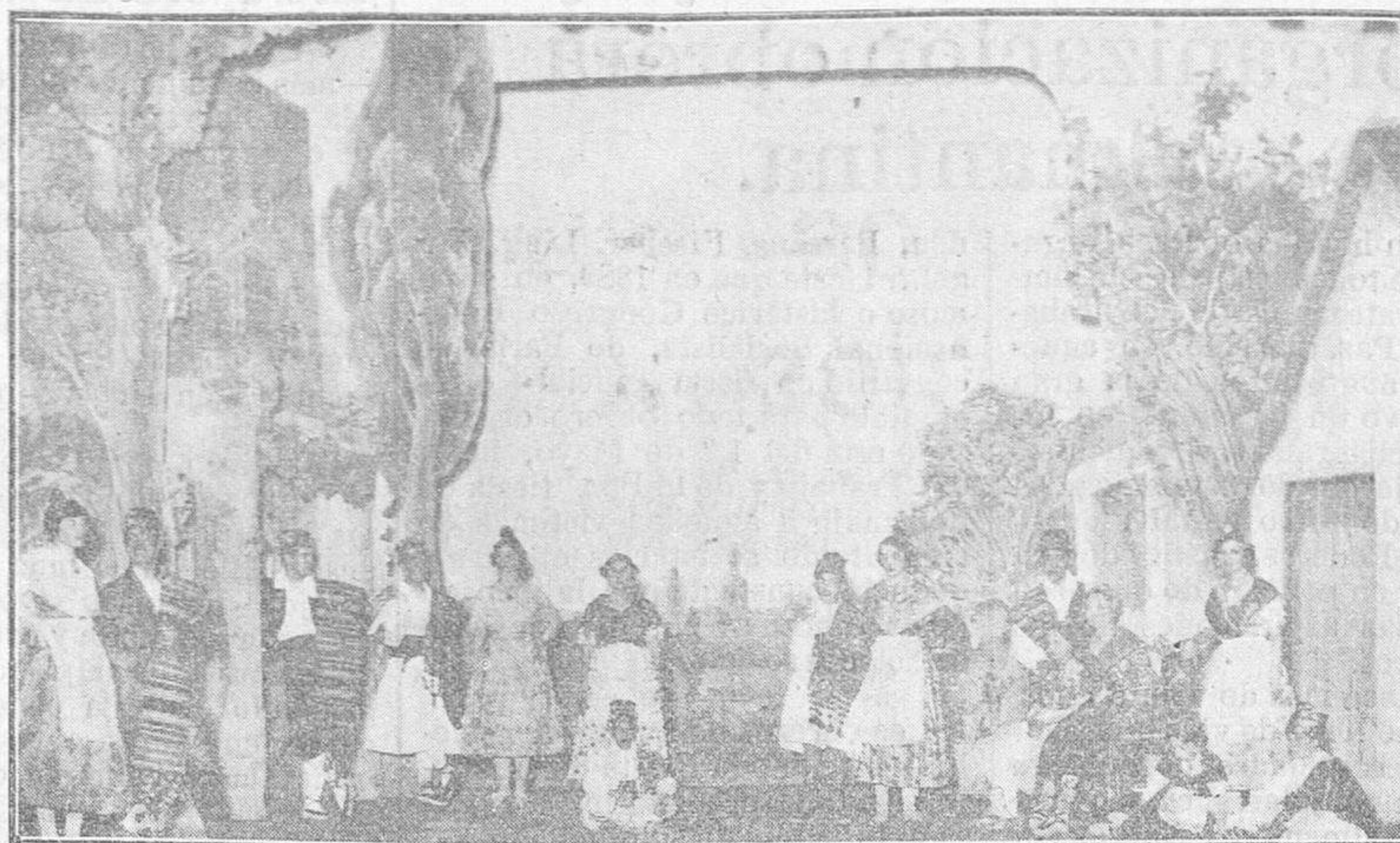
De la velada de la Cruz Roja en Bretón.—«Salve», estampa española del señor Espinós. (Foto Ansedé y Juanes).