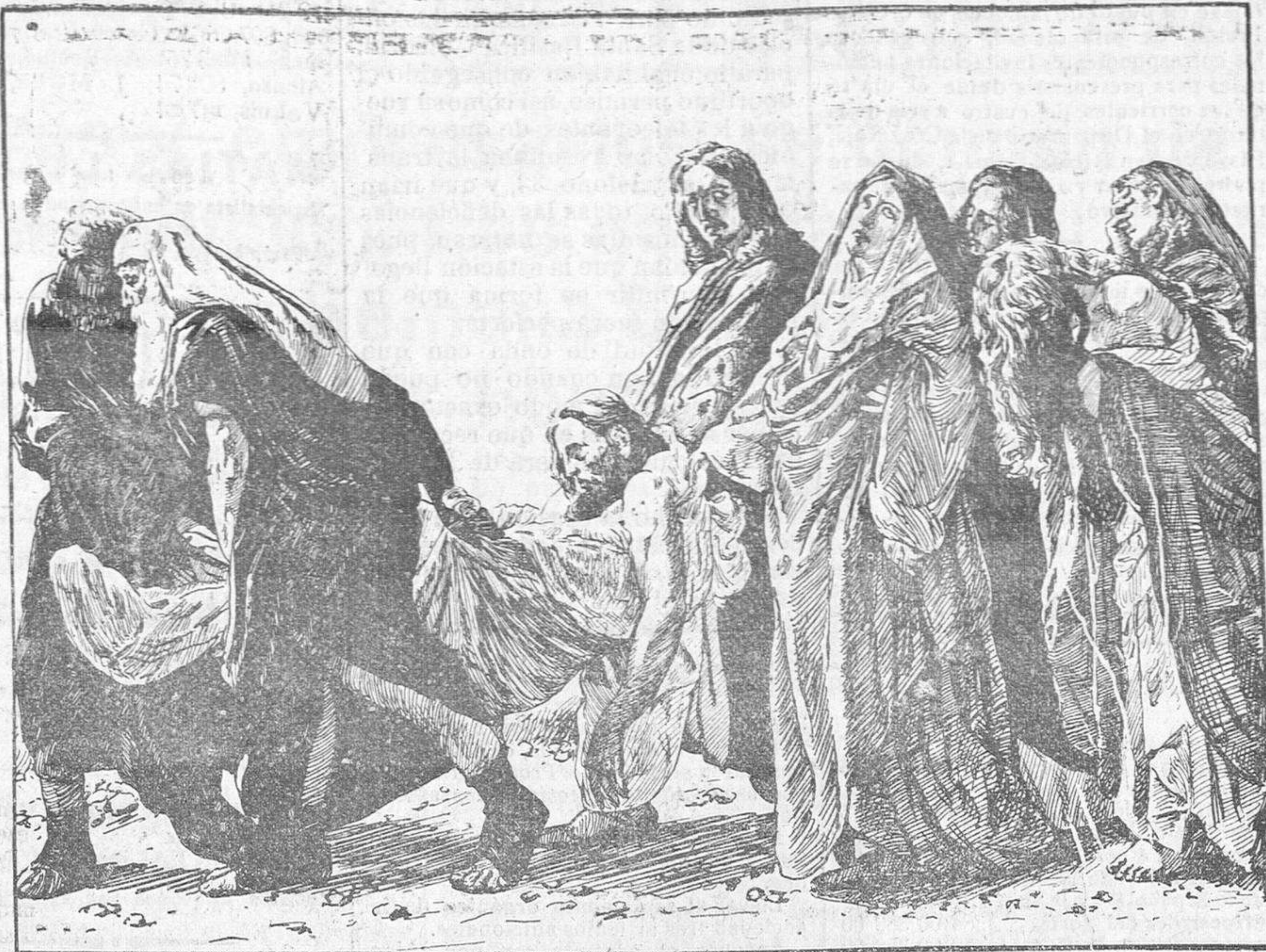
De la Semana Santa.—Entierro del Divino Redentor, célebre cuadro del pintor Crossio, que se conserva en Roma.

Así que vayan ustedes preparándose, que va a empezar.