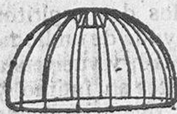
Imenso surtido de armaduras para pantalones y pantalones de seda a precios muy económicos. Lámparas de las mejores marcas de 115. Pías secas para timbres de gran duración, marca LIGHT, a 3,50; para teléfonos, marca MAGNA, a 4 pesetas. Almacén de material eléctrico, Valentín Solórzano, Azafrañal, 1. 15-a-2.

Finalmente, se acordó suspender la sesión, para reanudarla en la próxima semana.