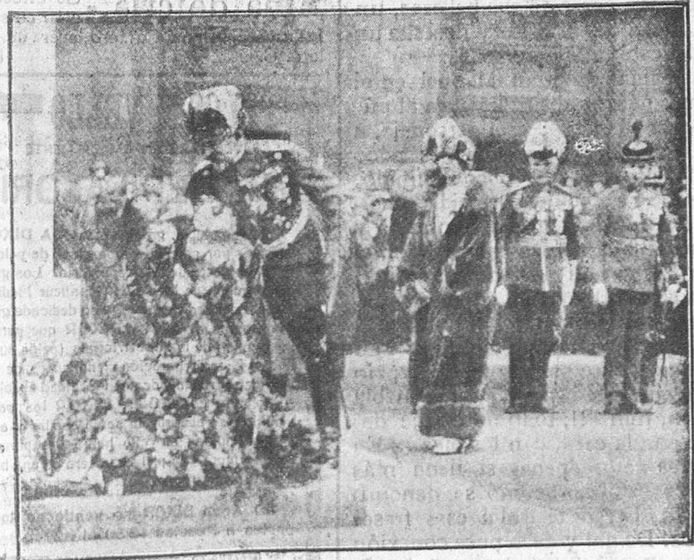
Los Reyes de Rumania depositando una corona en la tumba del Soldado Desconocido, en Londres.