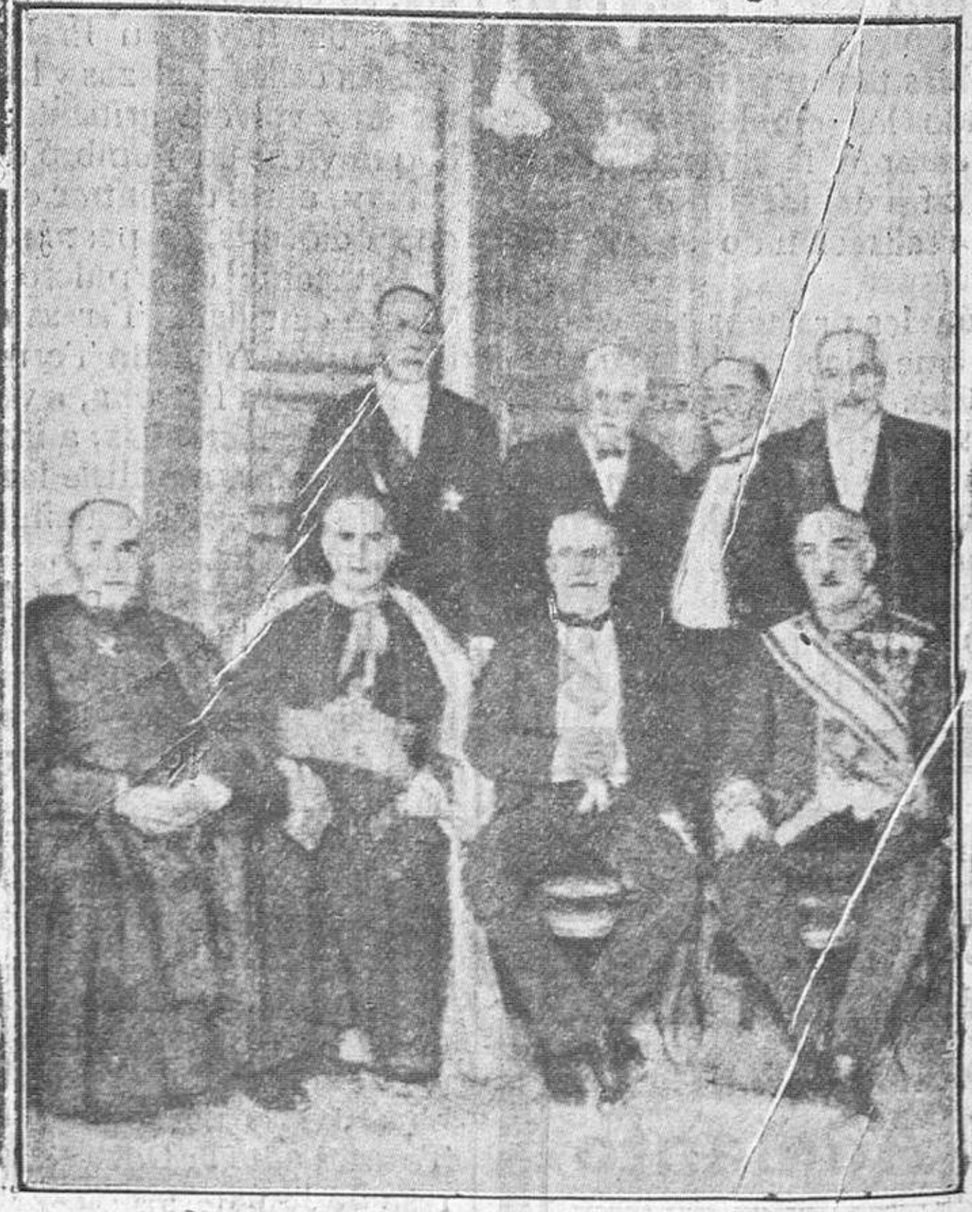
El nuevo académico de la Historia D. Miguel Asín Palacios, después de leer su discurso de ingreso en la docta Corporación, el pasado domingo.

El Adelante es el más conveniente a los anunciantes por su gran tirada y circulación. Corresponsales en todos los pueblos de la provincia. Redacción y talleres, Ramos del Manzanao, número 45. Teléfono número 87.