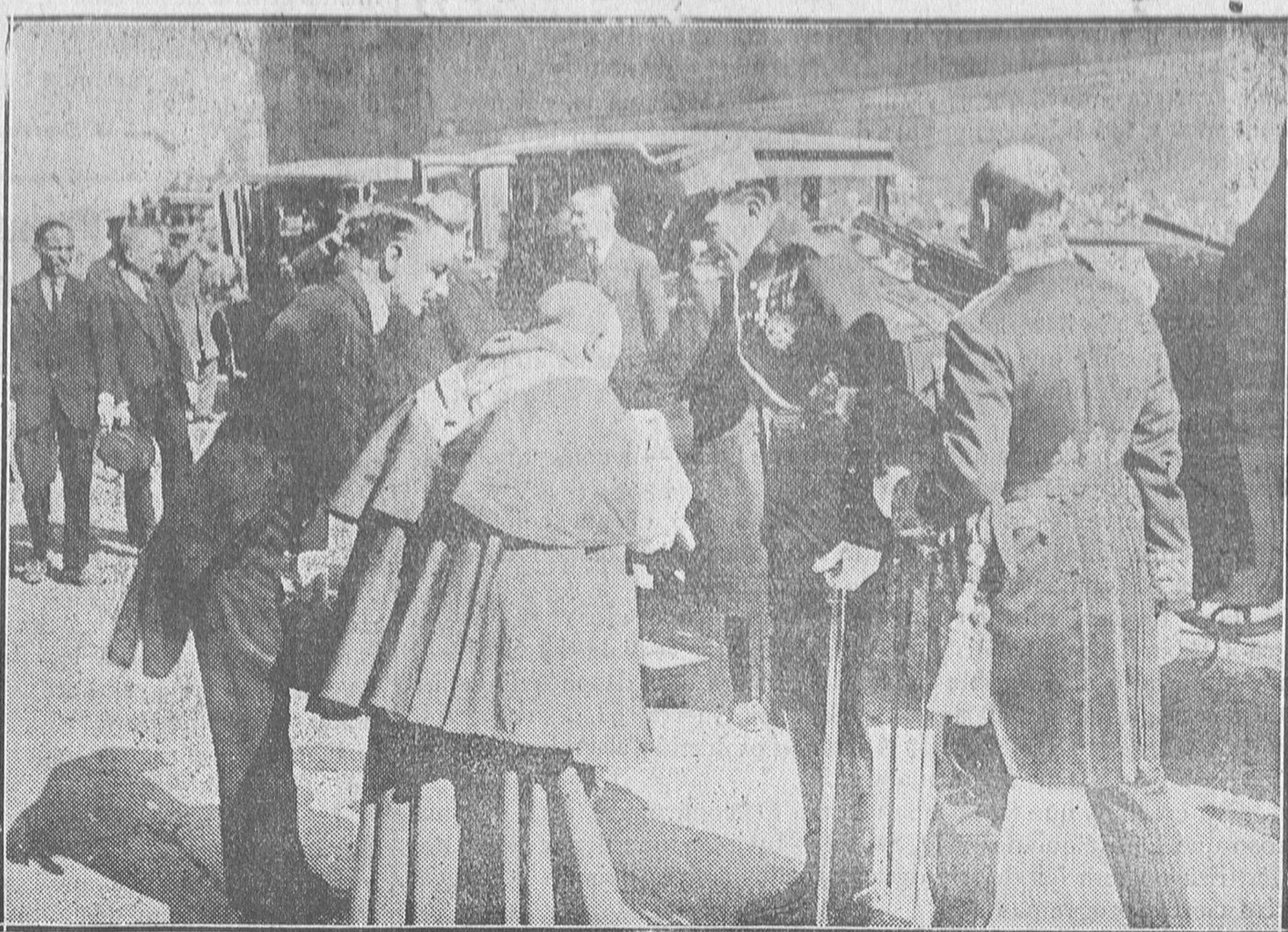
El Prelado salmantino saludando al Rey.