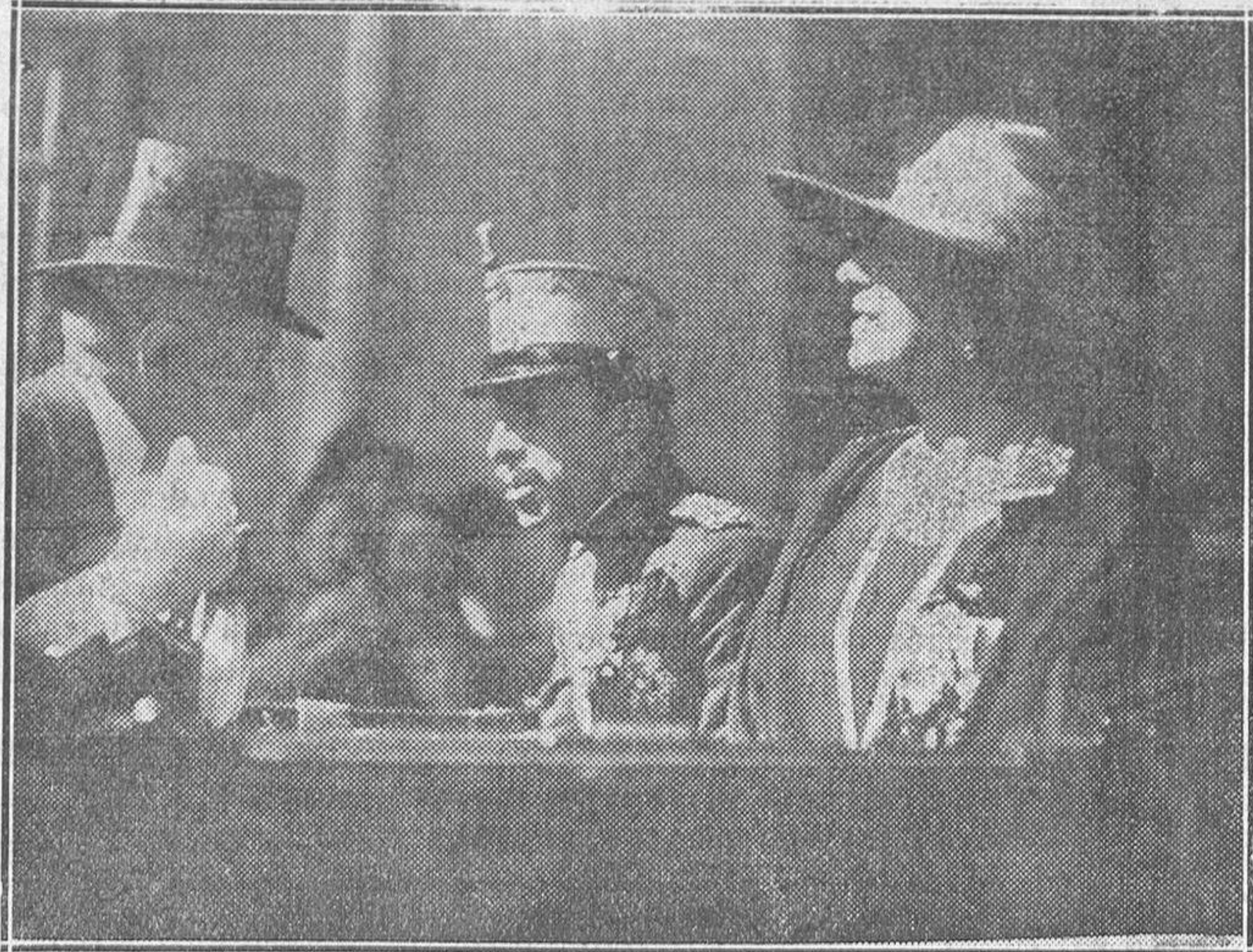
Los Reyes y el Alcalde de Salamanca.