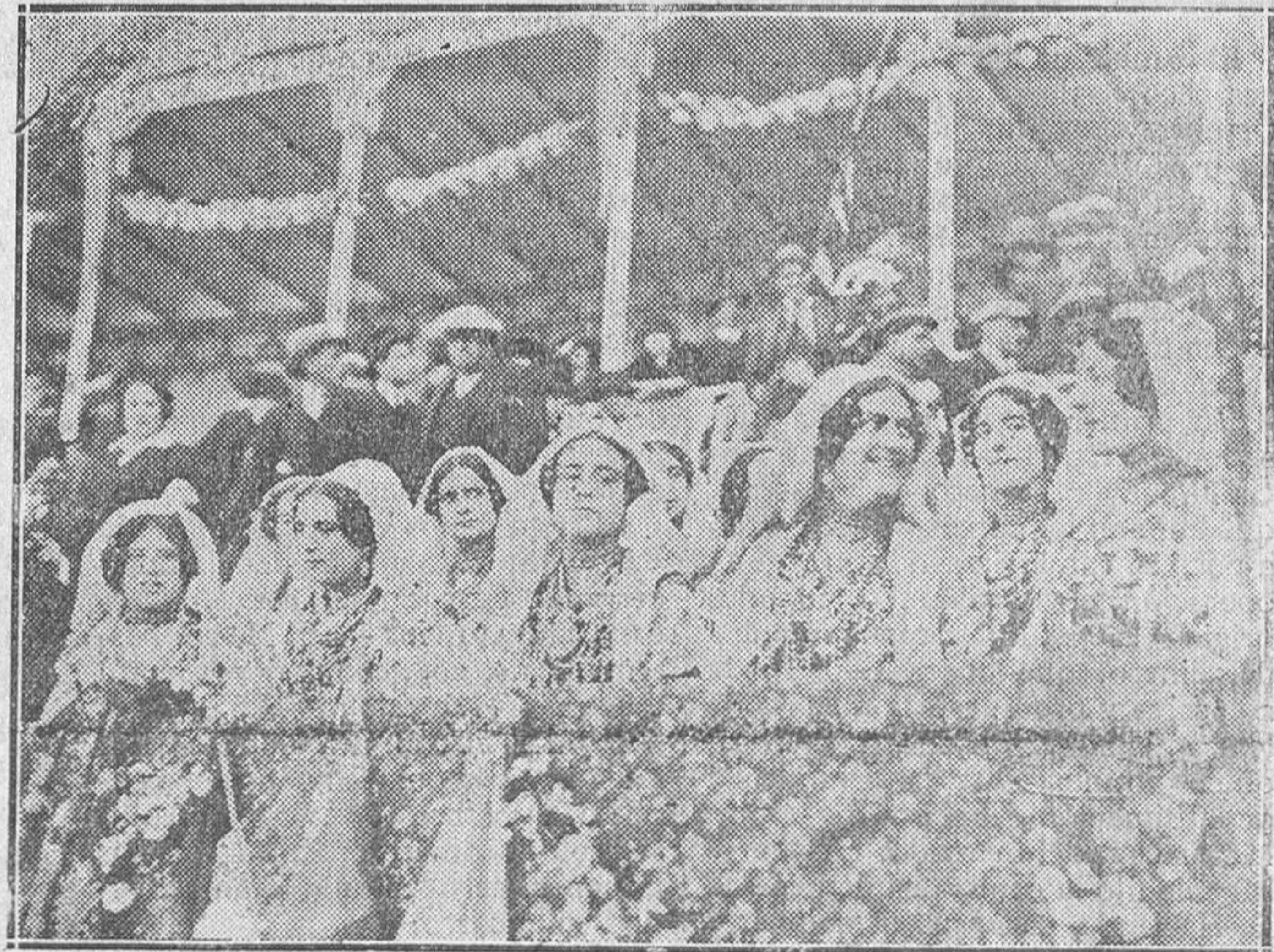
Las charras en la Plaza de Toros.

Y es que de Dios s'apartao el mundo desatinao, y no tendrá miaja sese