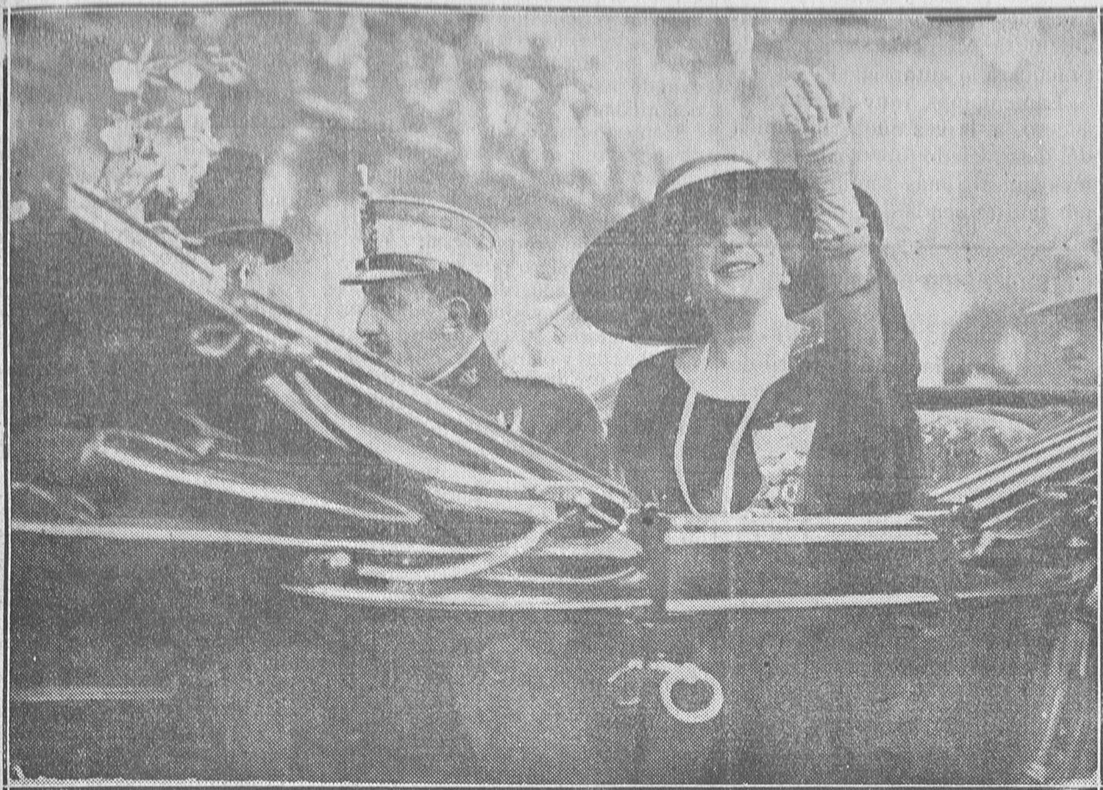
La Reina D. a Victoria contestando a las aclamaciones del pueblo.