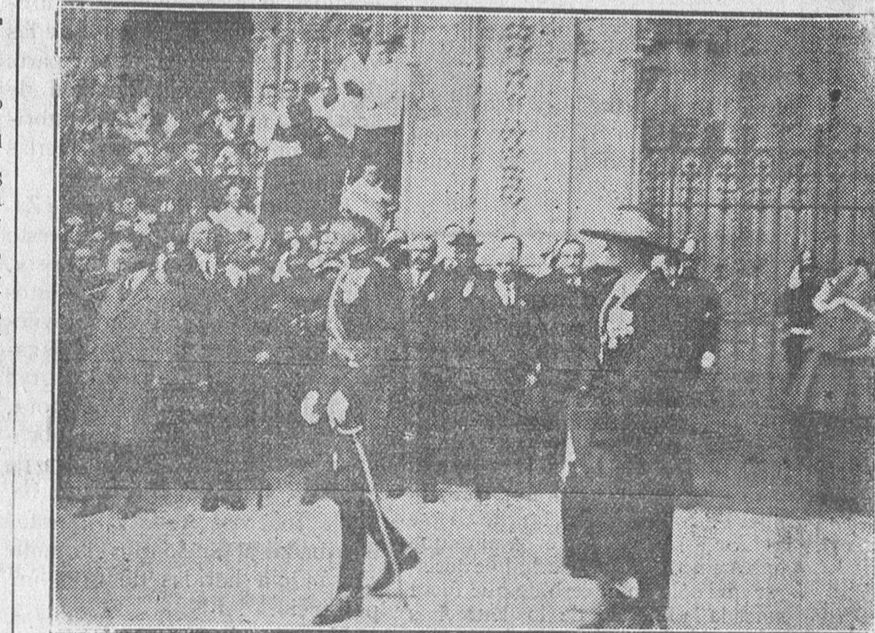
Los Reyes a la puerta de la Catedral.

El fuego se produjo en el depósito de la gasolina, por lo que tomó incremento, siendo imposible evitar que fuera destruido, casi en su totalidad por el voraz incendio.