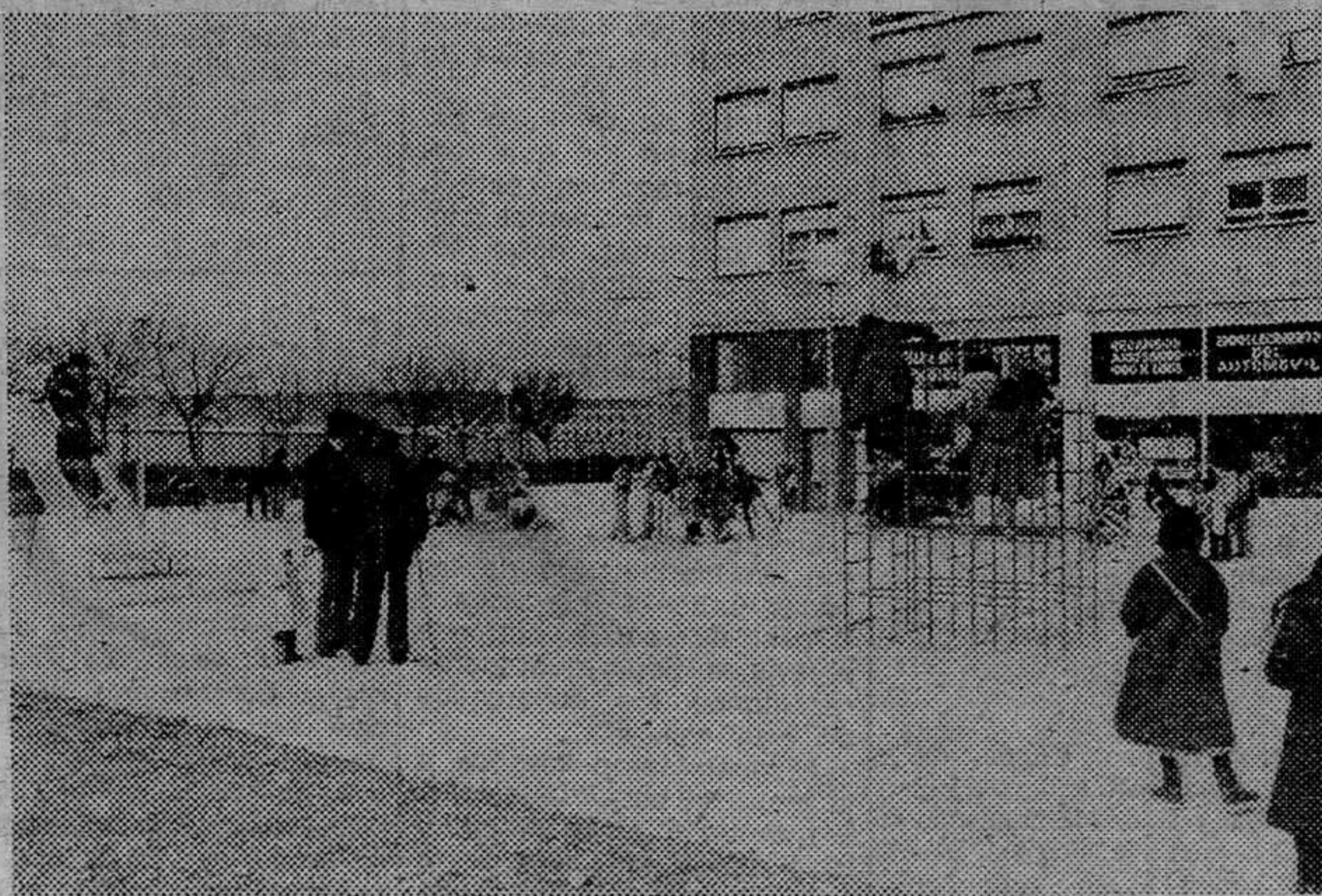
El Ayuntamiento de la ciudad ha ultimado estos días las obras del nuevo parque de la Barriada Juan XXIII, en la zona de Fátima. Uno de los problemas de la periferia de la ciudad está en la carencia de espacios verdes y de recreo. Falta por colocar una fuente que completará esta ornamentación urbanística. A este proyecto hay que añadir el parque que llevará el nombre de Félix Rodríguez de la Fuente en el «G-3» y cuya subasta de obras se ha anunciado.