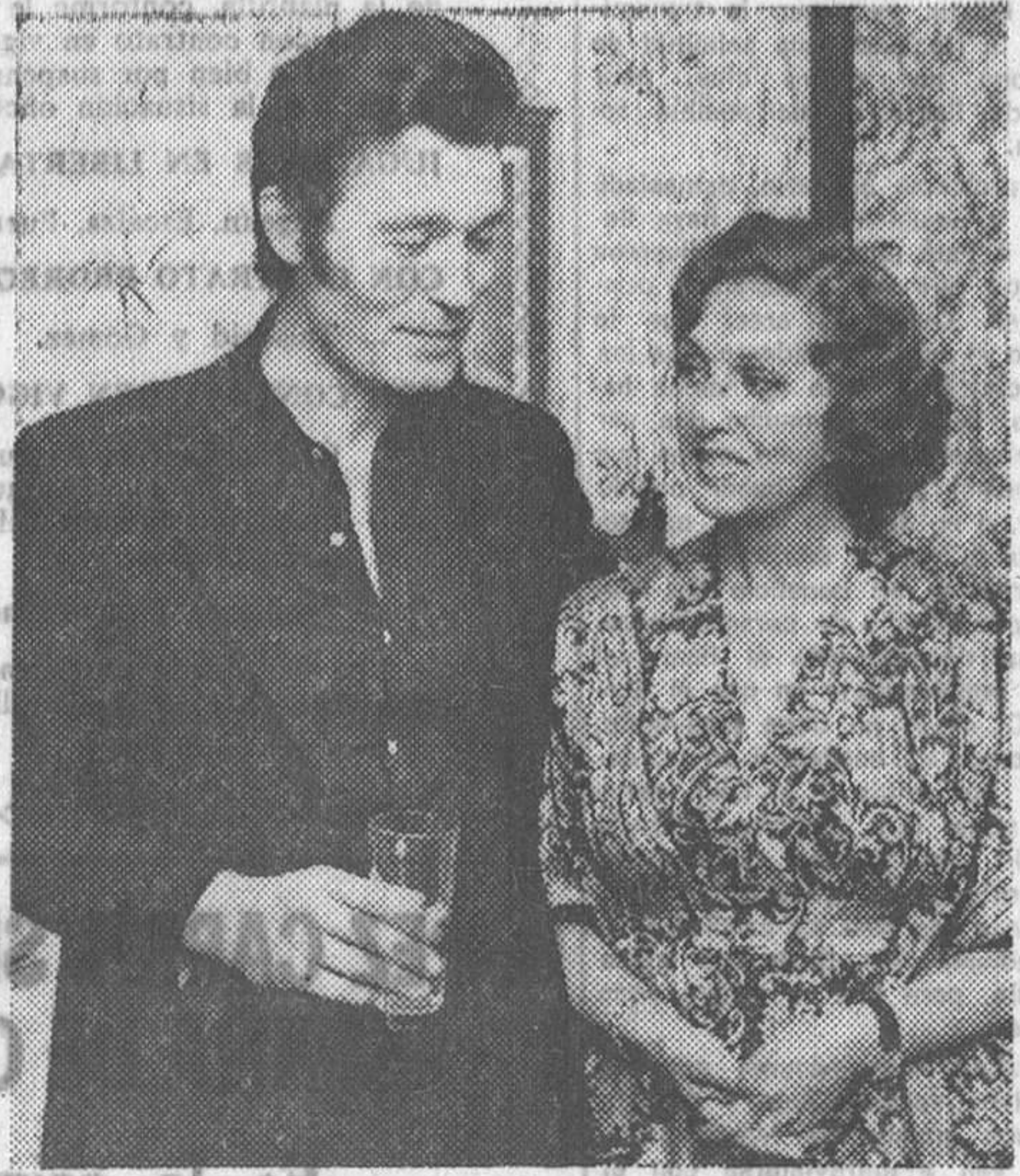
Amparo Rivelles con el galán español Ramiro Oliveros. Juntos actúan en «La Madastra», bajo la dirección del mejicano Roberto Gavaldón.

da y mejor tratada. Allí se convirtió también en «estrella» importantísima. Y sigue siéndolo. —¿Crees que realmente tienes un momento cumbre actualmente en tu carrera? —Pienso que he aprendido mucho, que soy más actriz que «estrella», termina.