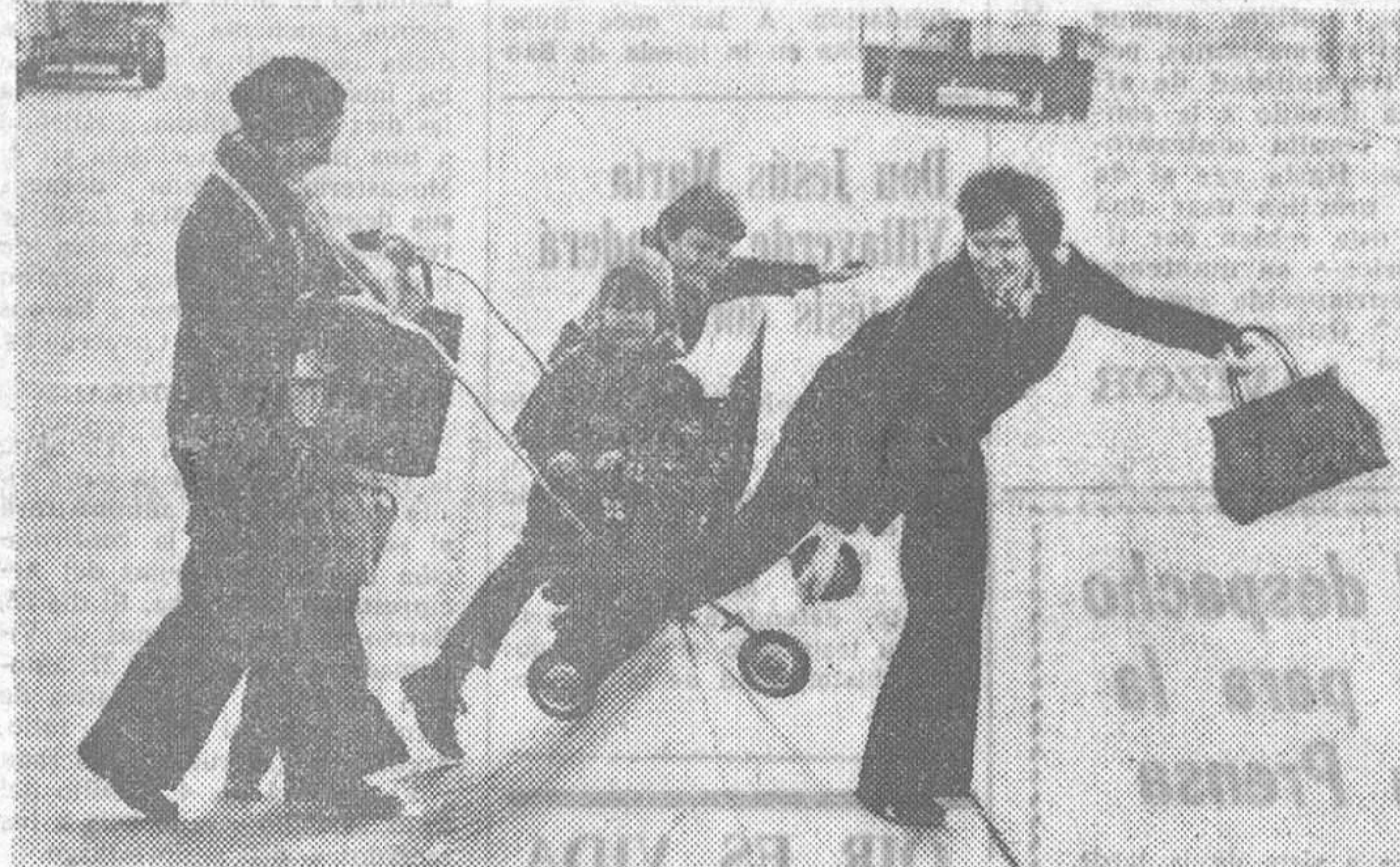
Lo que estamos viendo aquí no es un juego, sino un cruce "ilegal" de fronteras. Así como sueña. La "foto" ha sido tomada en la línea divisoria de Herzogenrath (Alemania Occidental) y Kerkrade (Holanda). Ambas poblaciones formaban una sola ciudad, pero fueron separadas por una restitución fronteriza. Donde hoy no existe sino un murete de 40 centímetros de altura, hasta 1968 se alzaba una alambrada de espino de dos metros. Además, suele ser costumbre que los aduaneros de ambas partes cierren los ojos a los cruces "ilegales" de fronteras y no utilicen sus talonarios de multas. — (Dd.)