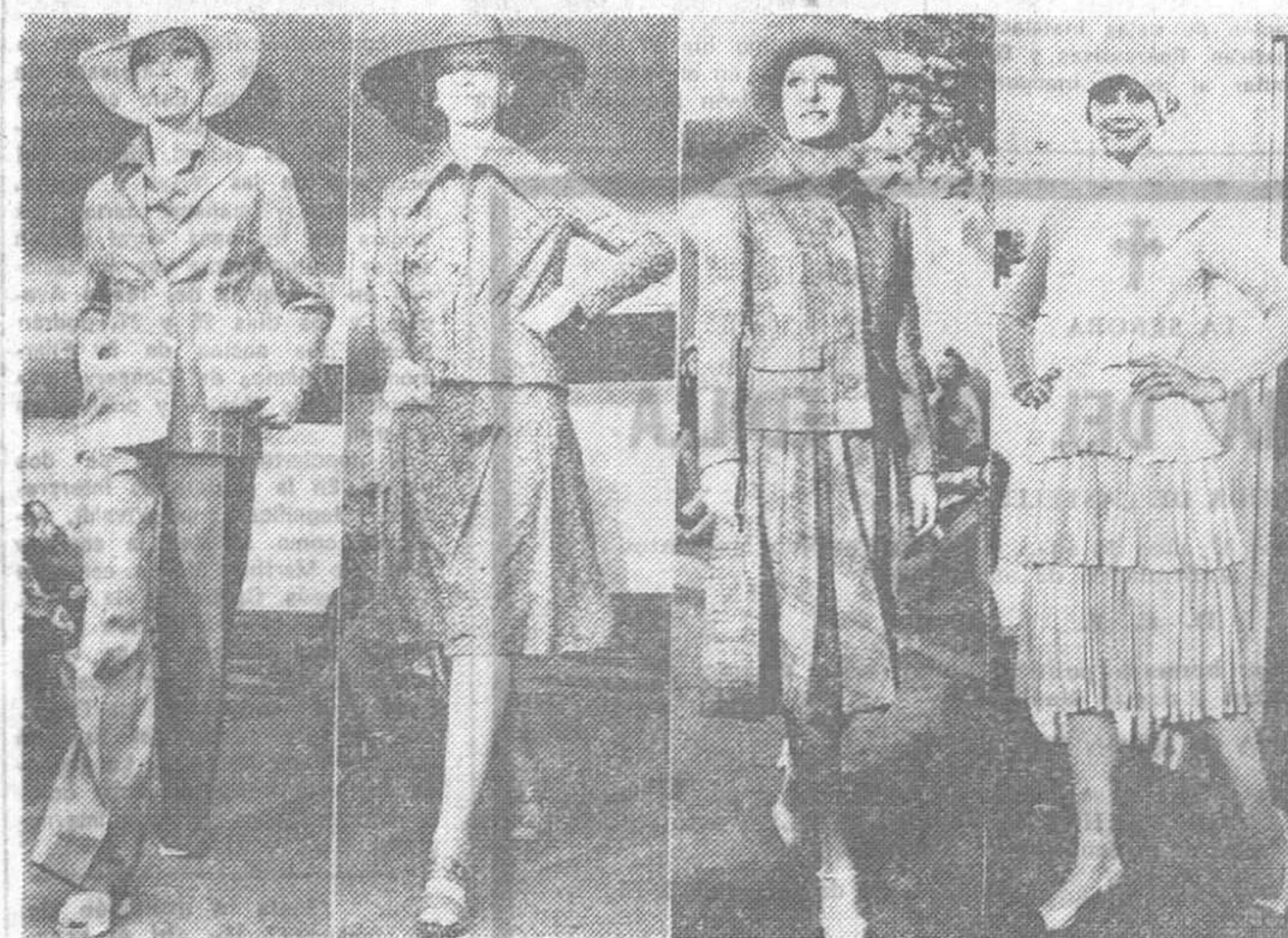
Los creadores de moda del Berlín occidental han presentado sus colecciones en Bonn. Para verano y otoño. Tonos cromáticos variados y armónicos; corte sencillo y telas suaves y flexibles; influencia evidente de los "años treinta". Y por encima de todo, elegancia.