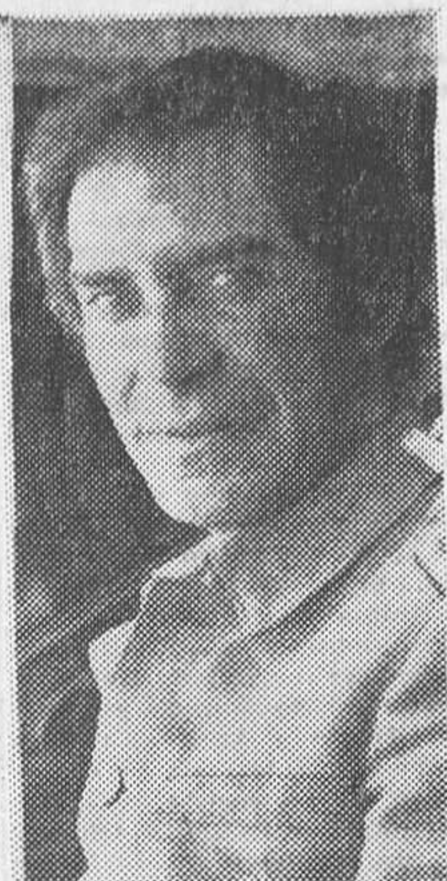
Martin Landau en una pausa del rodaje de «Una ciudad llamada Bastardo» en las cercanías de Madrid.

Martin Landau, el héroe de la serie de televisión, «Misión Imposible» está en España, en Madrid. Se encuentra rodando «Una ciudad llamada Bastardo». Cuando nos ponemos en contacto con él, tenemos nuestras reservas sobre lo que habría de ser su comportamiento con nosotros. Nos habían dicho que no era amigo de conceder entrevistas, que era una persona desagradable, arisca en extremo. Lo cierto es que todo lo que nos habían dicho carece del más pequeño fundamento. Es más, todo es una burda mentira. Landau es, doy fe de ello, una de las personas más agradables que me he encontrado en los avatares de la información... y estoy en estos menesteres desde hace ya bastantes años.