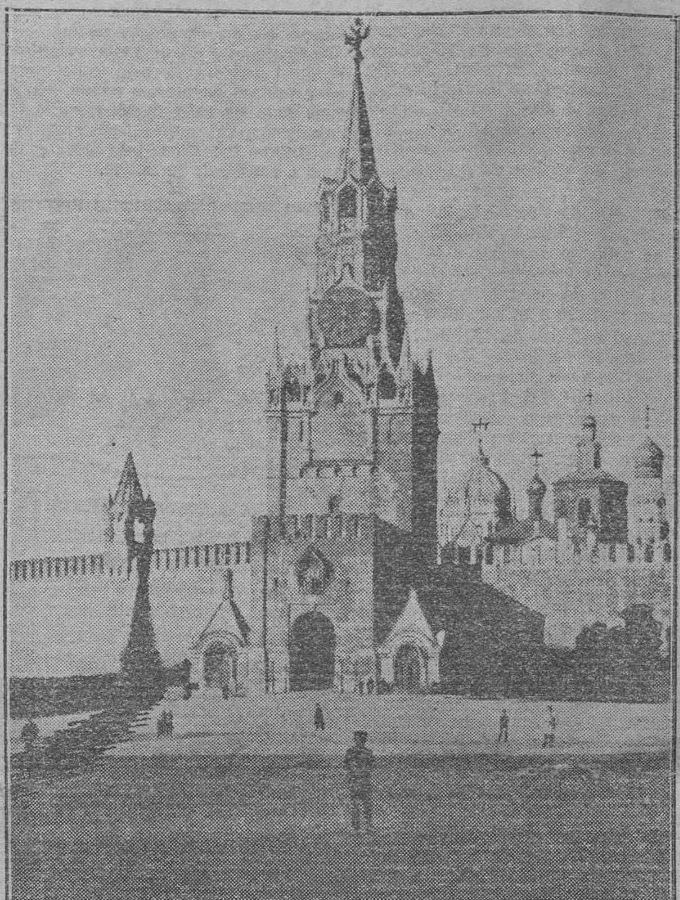
La Puerta del Redentor, «Spasskiya Vorótá», la entrada principal al Kremlin de Moscú

Panslavistas y pacifistas Los que dirigieron el país antes, estaban divididos en dos grupos: en panslavistas y pacifistas. Los panslavistas querían la guerra mundial, eran aventureros militares con el gran duque Nikolai Nikoláievitch por jefe. Aspiraban a la posesión de los Dardanelos con Constantino-