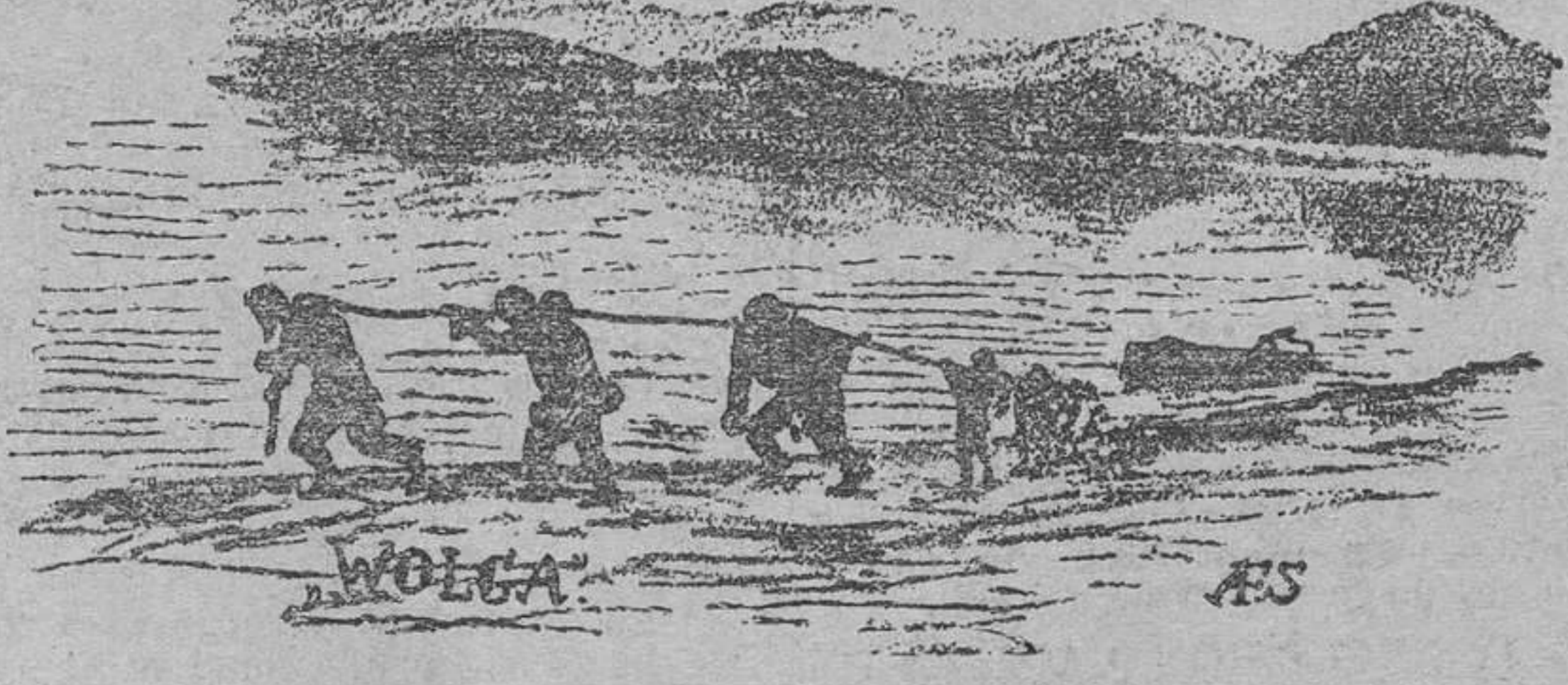
El duro trabajo en las orillas del río Wolga

cuadros de Rembrandt y Rubens debajo del brazo, dejando en Rusia una fortuna de muchos cientos millones de rublos oro, pues era en Rusia el hombre más rico después del Zar. El carácter del Zar ¿Y el Zar mismo? ¿Cuál era su posición? Débil de carácter por naturaleza, indeciso, verdadero tipo del Hamlet shakespeariano, con poca instrucción, era un médium de los dos muy poderosos grandes duques, sus tíos Serguey Alexandrovitch y Nikolai Nikoláievitch. El más atroz de los dos era el primero, el gran duque