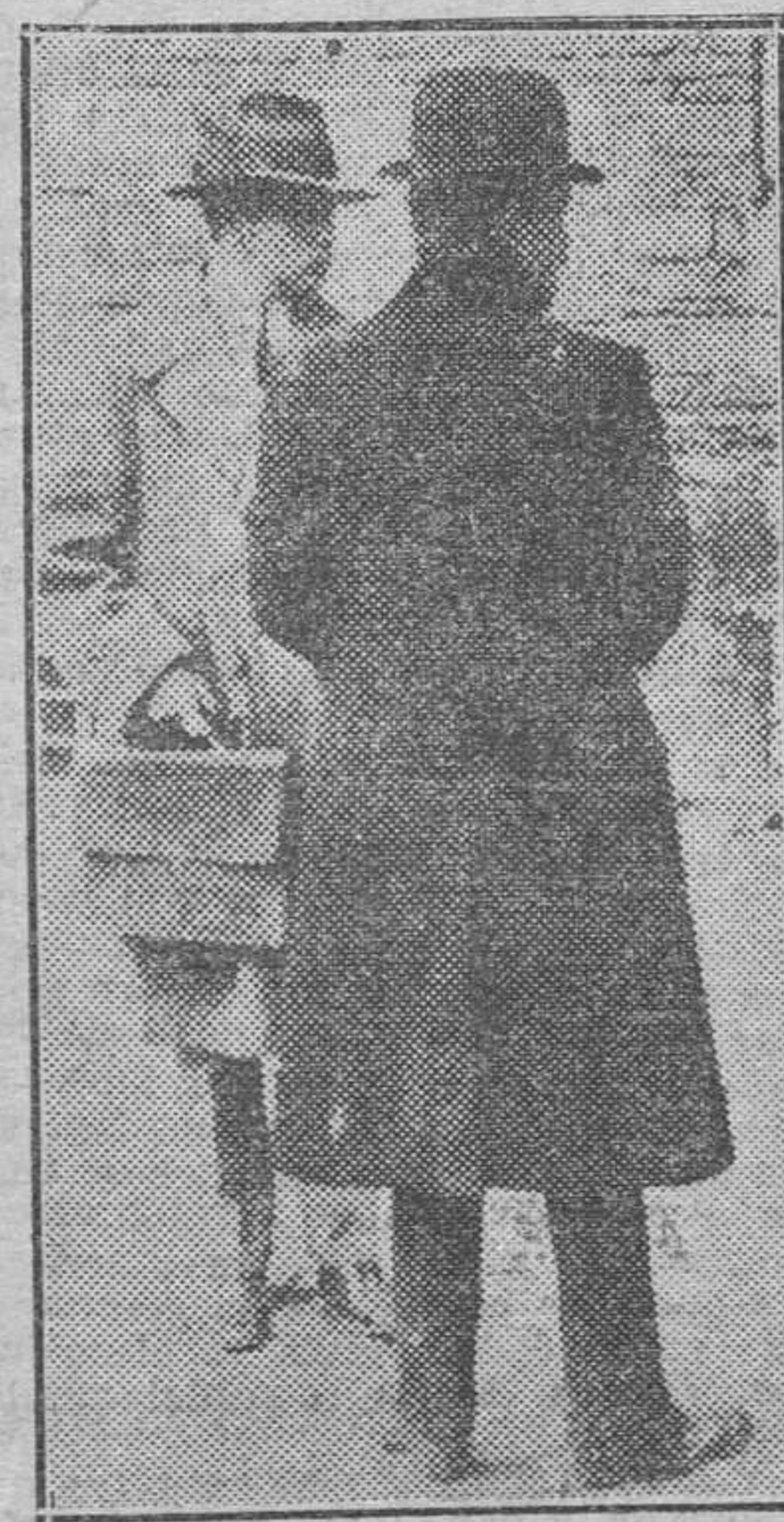
El Príncipe Othón, heredero del Trono de Hungría, es ahora estudiante en la Universidad de Lovaina.