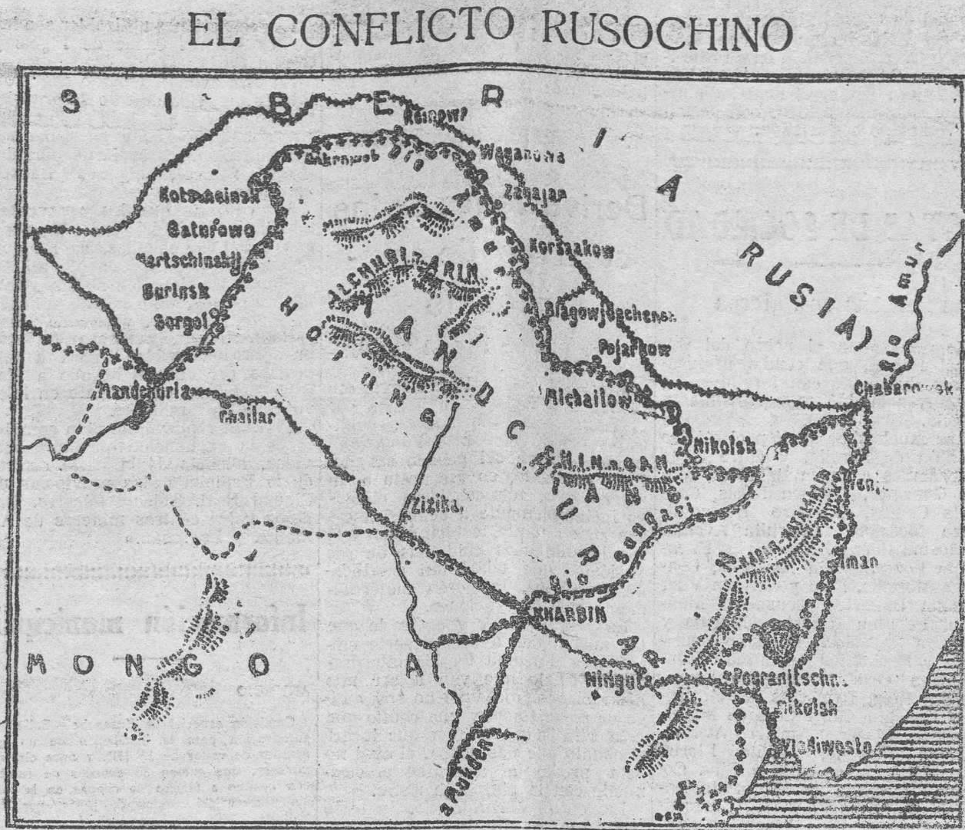
El escenario donde han comenzado a desarrollarse los primeros sangrientos sucesos