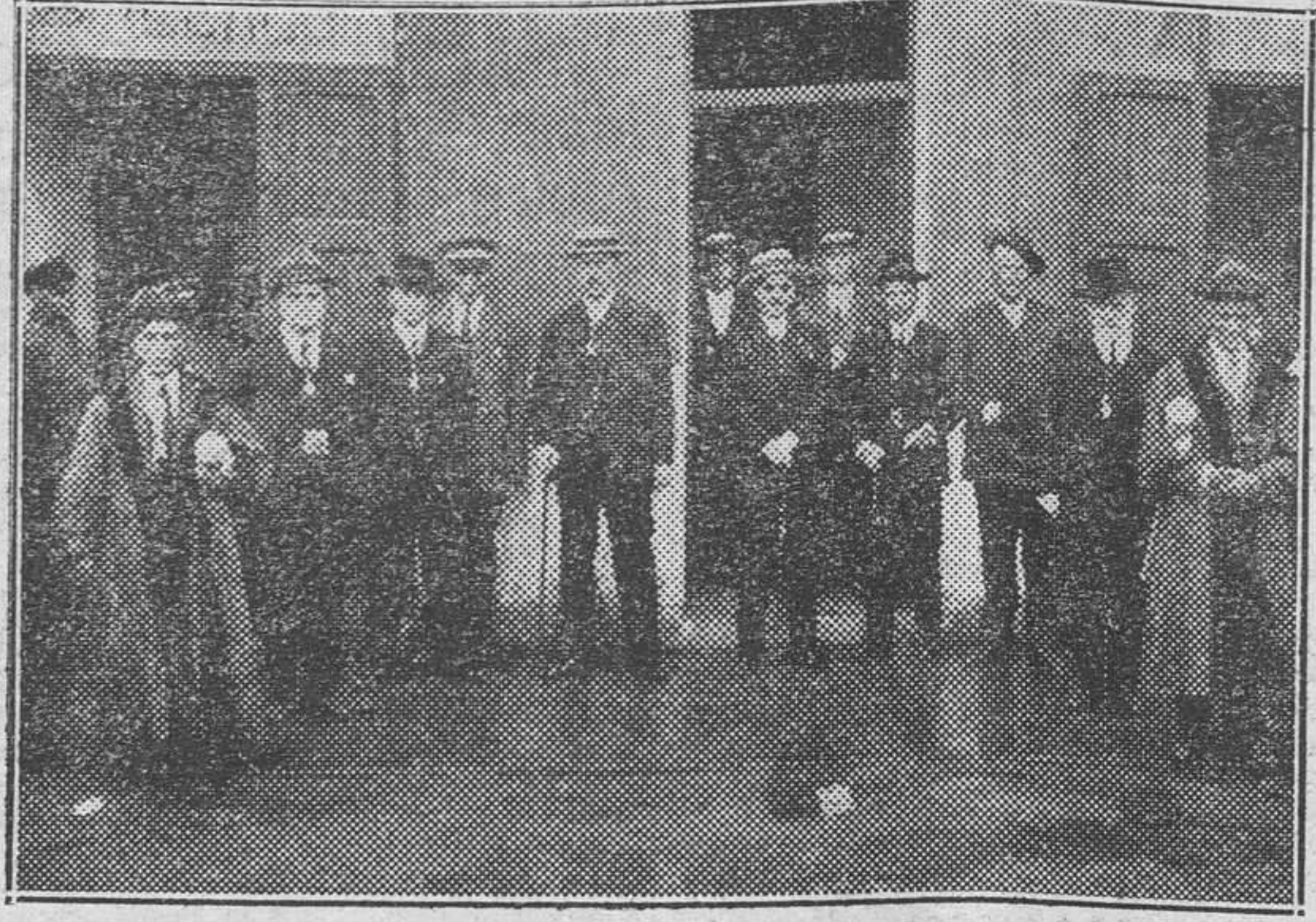
El Ayuntamiento de Sagunto en el momento de salir en corporación de la tenencia de Alcaldía delegada de su poblado del Puerto...