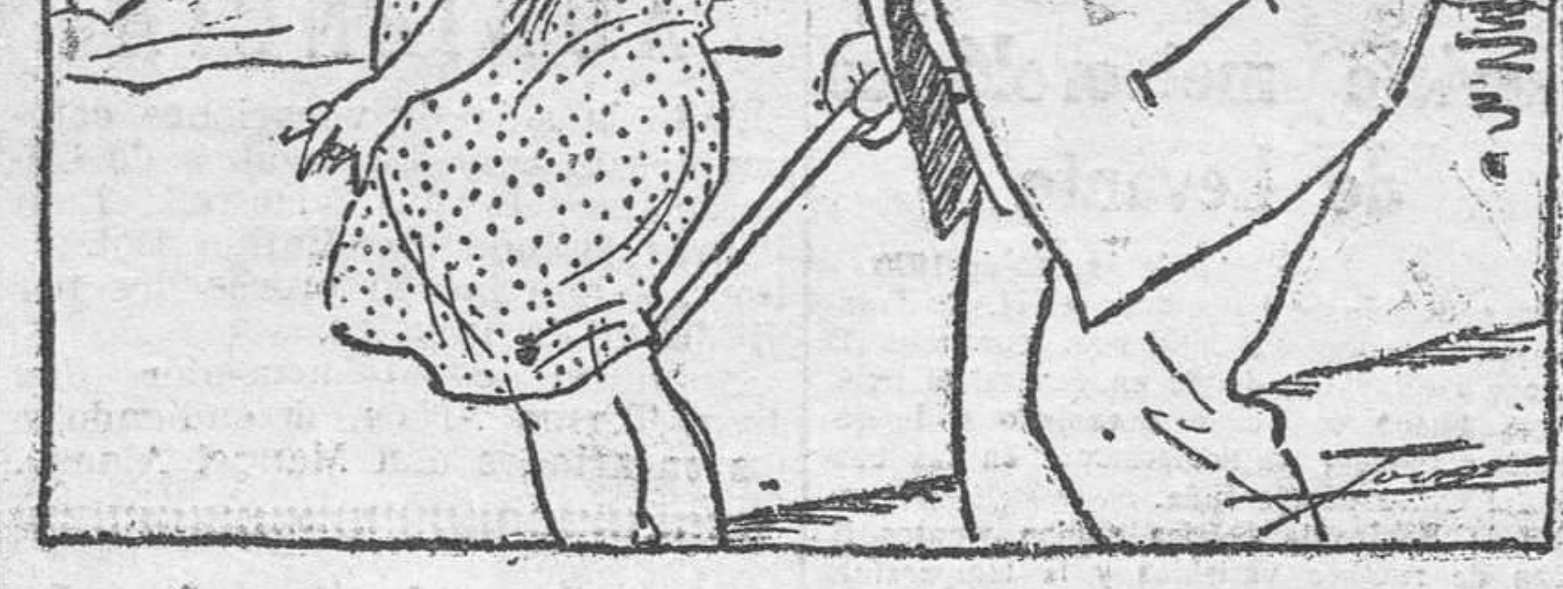
—¿Me quieres decir... estos cardenales que tienes aquí? —Que estando bañándome, un golpe de ola... —¿Dónde está esa ola? ¿Que me la voy a beber! (De La Voz, de Madrid.)