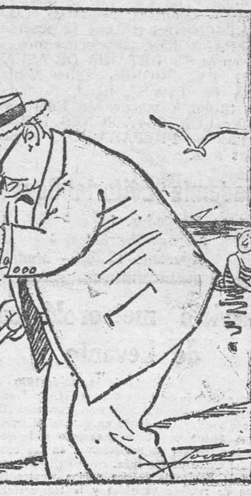
—¿Me quieres decir... estos cardenales que tienes aquí? —Que estando bañándome, un golpe de ola... —¿Dónde está esa ola? ¿Que me la voy a beber! (De La Voz, de Madrid.)