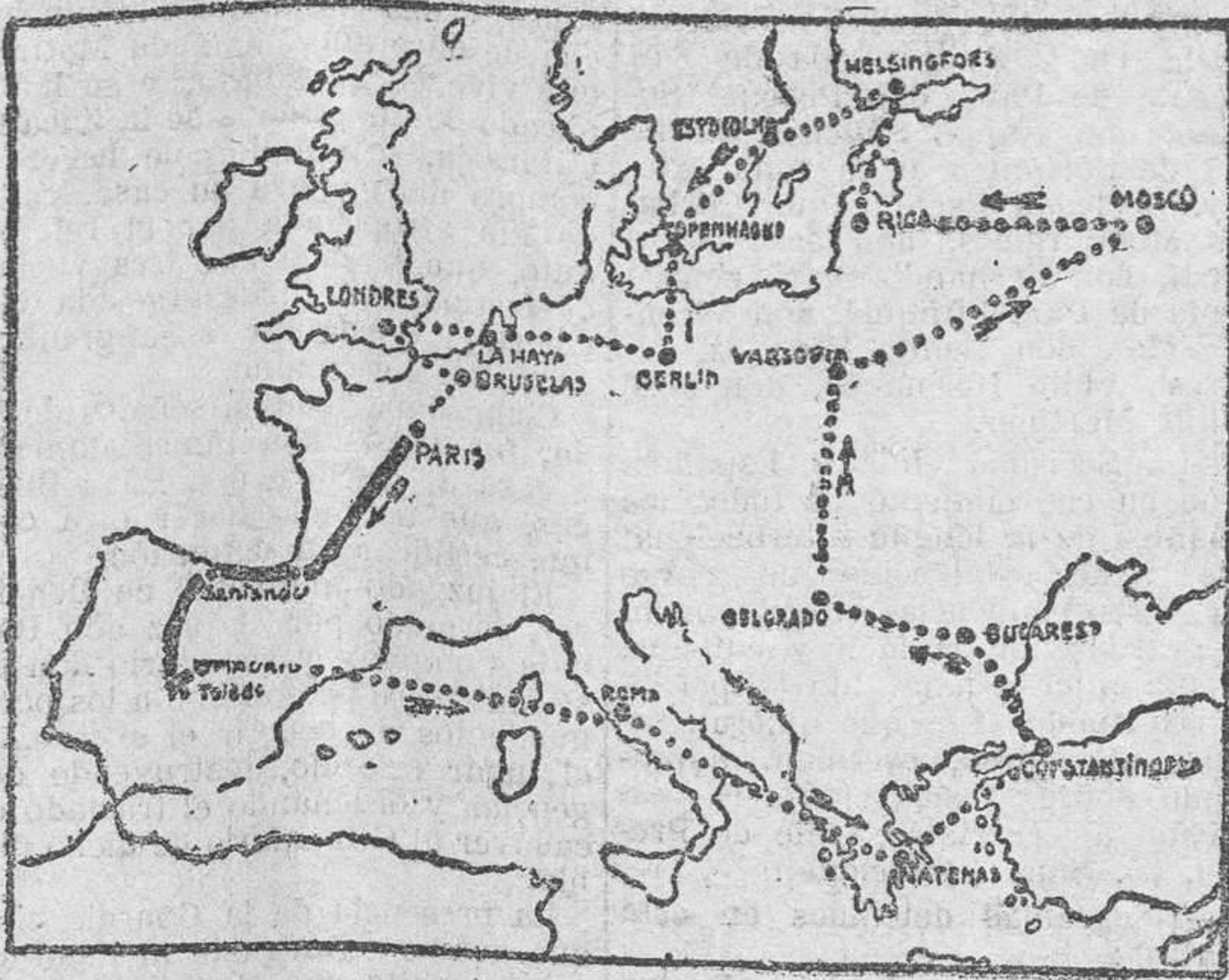
El trayecto de su vuelta a Europa